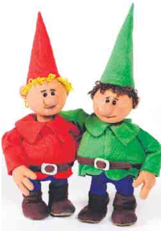
Himpelchen und Pimpelchen haben eine wichtige Botschaft

der Ablauf dieses denkwürdigen alpinen Unternehmens. Hier bringt die Inszenierung vom „theater 1“ Licht ins Dunkel und die Zuschauer (sofern sie schon 3 Jahre alt sind) können an diesen Erkenntnissen teilhaben.