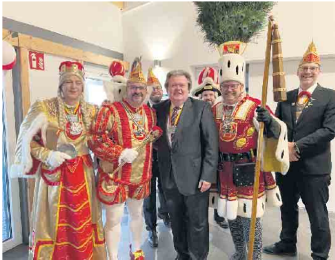
Das Euskirchener Dreigestirn besuchte die CDU Euskirchen.

Ende: Aus der Arbeit der Parteien CDU Euskirchen