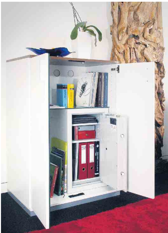
Schutz für alle Fälle: Wertschränke sind der passende Aufbewahrungsort für Schmuck, Uhren und Bargeld, aber auch für wichtige Dokumente.

auch Möbel erhältlich, die den Wertschrank komplett umrahmen und sich somit harmonisch in das Wohnumfeld einfügen. (djd)