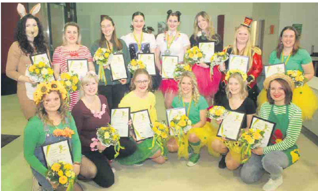
Traditionell werden bei der HJK Sitzung ehemalige Tänzerinnen verabschiedet. Aufgrund der zwei Jahre „Pause“ aufgrund von Corona hatten sich 15 Verabschiedungen „angesammelt“