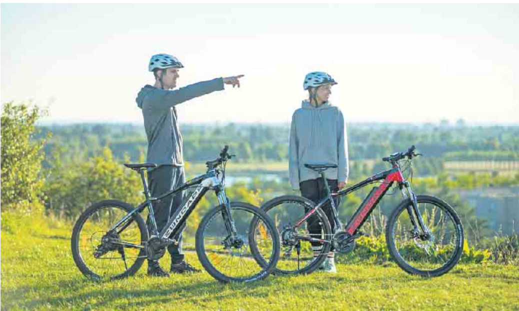
Sicherheit beim Fahrradfahren betrifft nicht nur die Ausrüstung mit Schutzhelm, sondern auch die Ausstattung des E-Bikes.

In den meisten E-Bikes sind Lithium-Ionen-Akkus verbaut. Werden sie beispielsweise bei einem Sturz beschädigt, kann es zum Kurzschluss kommen. Das ist auch möglich, wenn