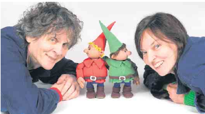
Himpelchen und Pimpelchen mit ihren beiden Akteuren.

Soviel zum bekannten Teil der Geschichte. Was bislang unbekannt blieb, ist der Zweck und