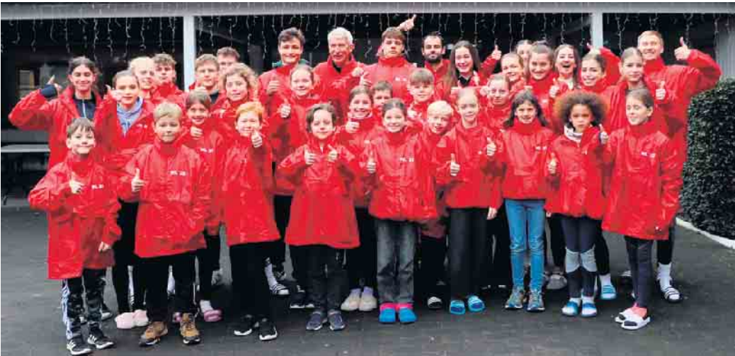
Gruppenbild der Teilnehmer

Endlich zurück im Winterlager! Wie jedes Jahr begann am 27. Dezember unser Winterlager in Gerolstein. Voller Motivation ging es gleich mit der ersten Trainingseinheit los, die aus einem 5 Kilometer-Lauf sowie einer Sprung- und Sprinteinheit bestand. An den folgenden Tagen wechselten sich Sport- und Freizeitaktivi-