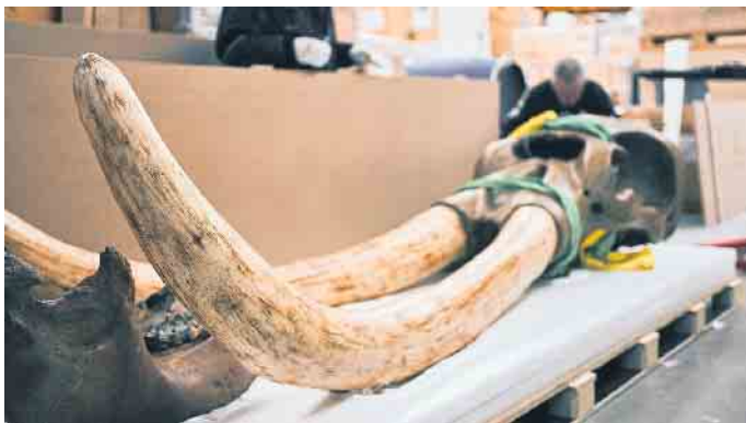
Das Amerikanische Mastodon war eine Art der Rüsseltiere aus der ausgestorbenen Gattung Mammut. Der Transport der kostbaren Zähne stellt auch für spezialisierte Kunstlogistiker eine Herausforderung dar.

von Clara sind Logistiker zuständig, die sich auf das Bewegen kostbarer und sensibler Objekte spezialisiert haben. Aber selbst für sie war der Transport von Clara eine Herausforderung. Clara in der Spezialkiste Denn neben Fingerspitzengefühl und Augenmaß beim Bewegen durchs Museum verlangte die schiere Größe des Bildes einen entsprechend großvolumigen Transportbehälter. In der Kölner Manufaktur des Speziallogistikers Hasenkamp wurde eine Kiste in den Maßen 340 mal 511 Zentimeter gefertigt, der hölzerne Schutzkorpus wiegt 832 Kilogramm. „In unserer Firmengeschichte stellt die exklusiv für Clara gefertigte Transportkiste ein Novum dar“, erklärt Geschäftsführer Dr. Tho-