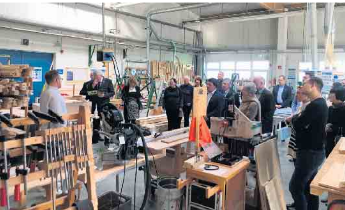
Besichtigung einer Werkhalle der NEW