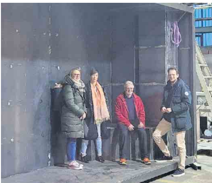
Vertreter*Innen von SPD und DLRG in einem im Bau befindlichen mobilen Schwimmcontainer.

Vertreter*innen der SPD-Kreistagsfraktion und der DLRG informierten sich über Schwimmcontainer. 2022 hatte die SPD-Kreistagsfraktion, nach vielen Gesprächen mit Expert*innen, gefordert, das Bündnis „Kreis Euskirchen kann schwimmen“ zu gründen.