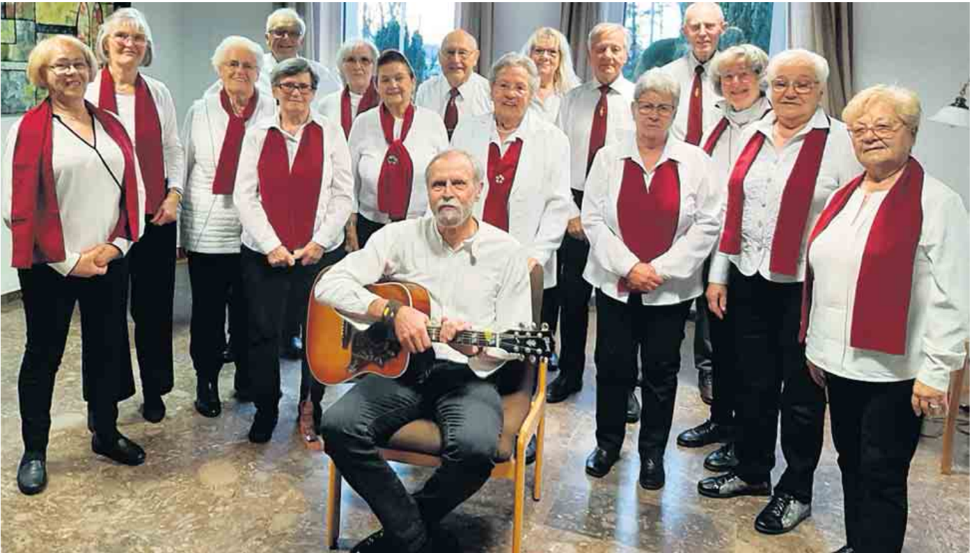
Harmonica Sound nach ihrem Auftritt in Maria Rast am 8. Januar.

Die Coronapandemie ist auch an Musikgruppen wie Harmonica Sound Euskirchen (Mundharmonika) nicht spurlos vorübergegangen. Über einen Zeitraum von rund zweieinhalb Jahren waren die Aktivitäten der Mundharmonikagruppe Harmonica Sound Euskirchen durch strenge Kontakt- und Abstandsregeln weitgehend zum Erliegen gekommen. Bei abklingender Pandemie ist wieder Raum für regelmäßige