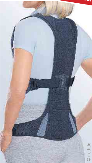
Versorgung des Rumpfs

NEU in Mechernich: Mittwochs bis 18 Uhr geöffnet und jeden 1. & 3. Samstag im Monat von 09-13 Uhr!