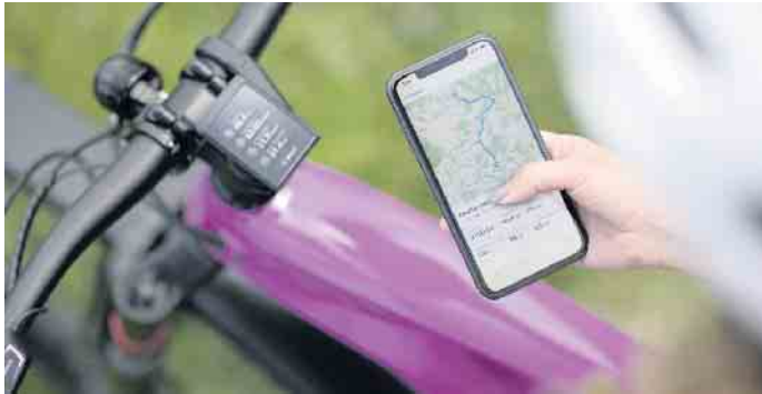
Smartphone-Apps sind praktische Begleiter für Touren mit dem E-Bike. Routen und Fitnessdaten werden ab dem ersten Tritt in die Pedale automatisch aufgezeichnet.

Mit jedem Kilometer auf dem E-Bike verbessern sich Fitness und Ausdauer. Das Herz-Kreislauf-Sys-