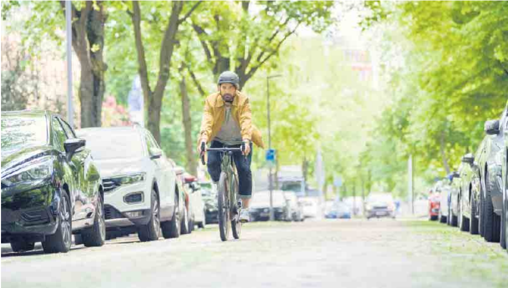
Fitter werden auf dem Weg zur Arbeit: E-Bikes sind für viele eine Alternative zum Auto oder öffentlichen Verkehrsmitteln geworden.

Mehr Bewegung und Fitness im Alltag dank smarter E-Bike-Technik