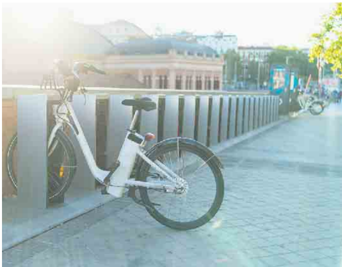
Teure E-Bikes und Pedelecs gut versichern.

Es handelt sich dabei um das kleine schwarze und meist ein Jahr gültige Saisonnummernschild. Man bekommt es, wenn man eine gesetzlich vorgeschriebene Kfz-Haftpflichtversicherung abschließt. So ist man bei einem Unfall gut abgesichert (Quelle Zurich Versicherung). Bei teuren E-Bikes ist auch eine zusätzliche Kaskoversicherung sinnvoll, um sich gegen Diebstahl oder Schäden am Akku zu schützen. Dazu sollte man aber eines wissen: Wenn man eine Hausrat-