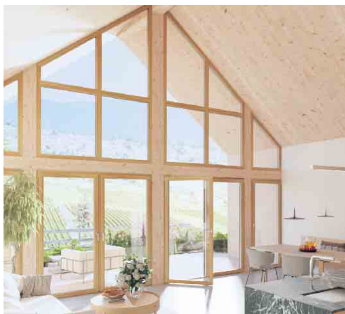
Bei großen Fensterfronten ist der Energiespar-Effekt von gut gedämmten Fenstern besonders groß.