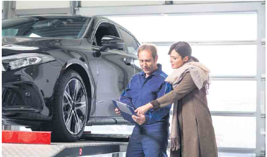
Bei einem Wintercheck überprüft die Kfz-Werkstatt all wichtigen Fahrzeugkomponenten.

Zu den häufigsten Pannen gehören Startschwierigkeiten durch eine schwache oder defekte Autobatterie. Besserung kann das Säubern und Einfetten von Plus- und Minuspol bringen. Ein Batterietester gibt Auskunft über den