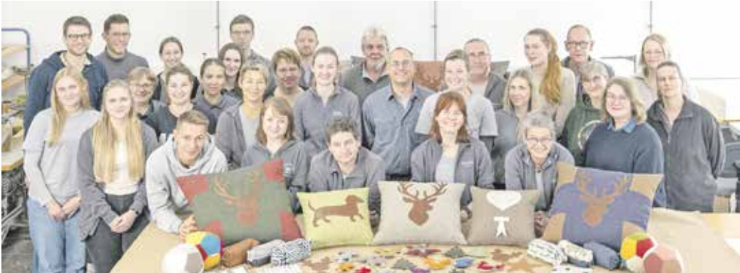
Unter kreativer Leitung der eigenen Auszubildenden entstehen aus überschüssigen Stoff- und Lederkomponenten handgefertigte Unikate. Neben Weihnachtsschmuck sind das in diesem Jahr vor allem Tassenuntersetzer, Kissen oder kleine Etuis.

Upcycling lautet das Motto: Das Team des Haldemer Familienunternehmens SINN Living hat aus Materialresten etwas ganz Neues entstehen lassen.