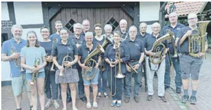
Posaunenchor Bad Holzhausen

andere heimlich im Auto – aber am 9. Dezember ist gemeinsames Singen offiziell erlaubt und sogar erwünscht! Denn in der Kirche wird nicht nur musiziert, sondern gemeinsam geschmettert, gesummt und mitgeklatscht. „Hier darf jeder mitmachen – egal ob Sopran, Brummbass oder rhythmisch begabtes Fußwippen“, sagt Bärbel Kuhlemann vom Chor Lunedi Sera. „Hauptsache, man hat Spaß. Die Töne kommen dann schon von allein!“ Ein Konzert mit Herz, Humor und Handschuhen Denn, kleiner Spoiler: Die Kirche ist nicht beheizt. Aber keine Sorge – das wird durch musikalische