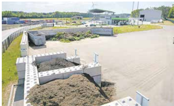
Im Winter gelten neue Öffnungszeiten auf den AWIGO-Grünplätzen im Landkreis.

Alternativ können Kunden auch die AWIGO-Recyclinghöfe in Ankum,