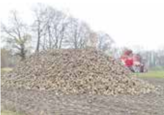
Zuckerrüben nach der Rodung