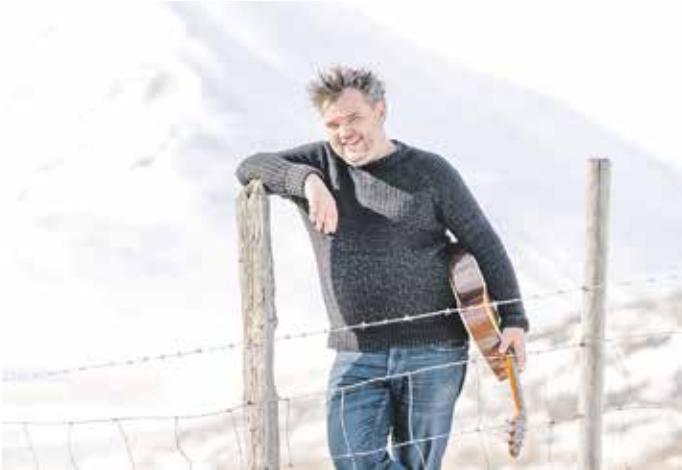
Der Singer-Songwriter Svavar Knútur bringt Lieder, Legenden und Mythen über das isländische Weihnachtsfest mit. Humor das Publikum vom ersten Moment an zu fesseln. Er präsentiert seine Songs auf berührende Weise, unterbrochen von absurd-komischen Geschichten und spontanen Anekdoten.

Ostercapeln-Venne. Der isländische Troubadour und jungen und der gefürchteten Jólaköttur – der menschenfressenden, schlecht gelaunten Weihnachtskatze. Auch einige freundlichere Wintergeschichten gehören zum Programm. Ein Abend, den man nicht verpassen sollte – für alle, die einen kleinen festlichen Kulturschock und leichtherzige Gruselgeschichten gemischt mit stimmungsvollen Winterliedern schätzen. Wer Svavar Knútur schon einmal live erlebt hat, weiß: Seine Auftritte sind eine emotionale Achterbahnfahrt – zwischen gerührt und Tränen lachend. Der isländische Singer-Songwriter und Entertainer versteht es, mit seiner überbordenden Sympathie und seinem schwarzen