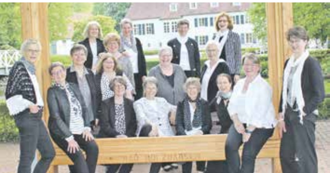
Chor Lunedi Sera

und menschliche Wärme locker ausgeglichen. Also: Schal einpacken, Mütze aufsetzen und los geht’s. Und damit niemand mit kalten Händen nach Hause gehen muss, gibt’s nach dem Konzert in der Kirche Glühwein und Punsch – selbstverständlich auch alkoholfrei. Ein herzliches Dankeschön an alle fleißigen Helfer, die dafür sorgen, dass man sich nicht nur musikalisch, sondern auch innerlich aufwärmen kann!