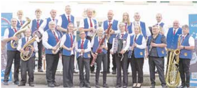
Blasorchester Bad Holzhausen Foto: Mathias Böhme und Text