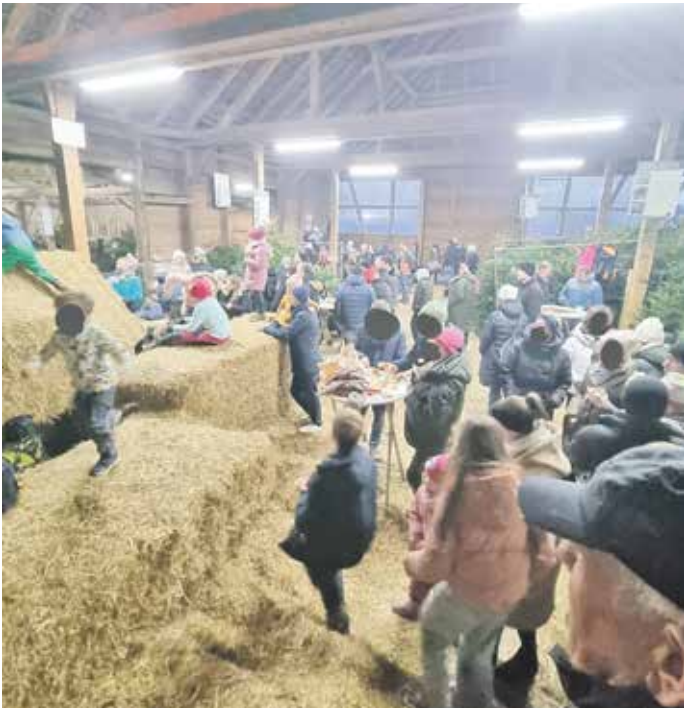
Strohbürg zum Spielen für Kinder, während die Eltern einkaufen