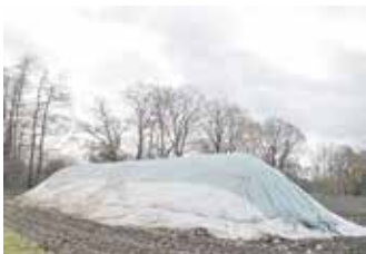
Geschützt unter Vlies, vor dem späteren Abtransport