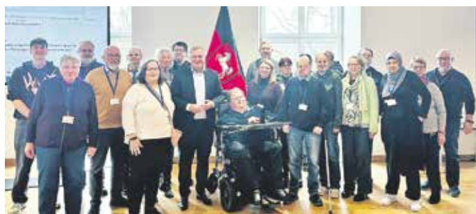
Guido Pott (MdL) empfängt den Gesamtwerkstattrat der HHO im Leibniz-Saal des Landtages

Im Mittelpunkt der Gesprächsrunde standen die aktuellen Herausforderungen der Werkstätten für Menschen mit Behinderung – von Entlohnung und Finanzierung bis hin zu besseren Übergängen in den allgemeinen