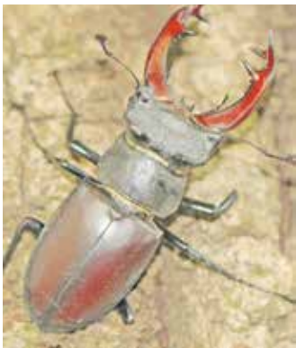
Lucanus cervus Hirschkäfer nur noch in ihr neues Heim einziehen! Christina Mau-Hansen für NABU Gruppe Dümmer e.V.

das Weibchen seine Eier ab. Je nach Nahrungsverfügbarkeit dauert das Wachstum der Larven bis zu acht Jahren. Im Mai schlüpfen die Käfer aus dem Boden und haben nur eine kurze Lebensspanne von ca. 8 Wochen, in der sie sich paaren. Verstärkung und Know-how wurde von Mitgliedern der NABU Gruppe aus Damme erhalten, die mit einem noch stabilen Vorkommen dieser größten Käferart in Niedersachsen in den Dammer Bergen bereits Erfahrung im "Meilerbau" haben. Der Meiler wird nach dem Ausbuddeln eines tiefen Erdlochs mit Stubben, morschem Holz, Ästen und Holzschredder gefüllt, damit die Larven genügend zu fressen bekommen. Jetzt müssen sie