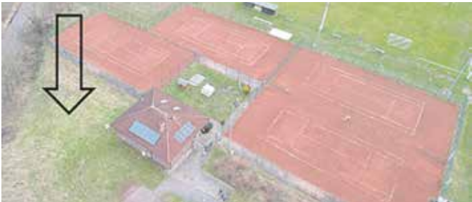
Der Padel-Court wird in unmittelbarer Nähe zum Clubhaus der Hunteburger Tennisanlage gebaut.

Wittlager Land Wer das Padel-Projekt mit einer größeren Spende unterstützen möchte, kann sich gerne direkt an die Tennisabteilung wenden.