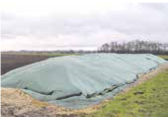
Kartoffeln in der Feldmiete, geschützt durch Vlies

Der Herbst ist Ern- te- und Lagerzeit. Rechtzeitig vor stärkeren Frösten und Nässe wurden Kartoffeln und Zuckerrüben noch im November gerodet und in Feldmieten – vorübergehend – gelagert.