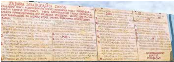
21 Thesen waren der Ausgangspunkt für die Streiks und für die Gründung von Solidarnosc

des Stalag IB und der Geschichte von Olsztynek. Interessant auch der Besuch im historischen Wasserturm, der mit europäischen Fördermitteln aufwändig saniert wurde und der Öffentlichkeit unter anderem für Schulungen und Ausstellungen zur Verfügung steht. Den Abschluss bildete ein Besuch bei der Feuerwehr in Olsztynek. Neben der Vorstellung des Feuerwehrsyste.ms sowie des Feuerwehrgerätehauses konnten die Gäste viel über die Arbeitsweise der Feuerwehren erfahren. Artur Wrochna, der frühere Bürgermeister von Ol-