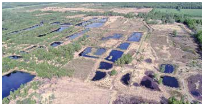
Blick von oben auf den Moor-Erlebnispfad

Die Veranstaltung beginnt um 14.00 Uhr und dauert ca. 2 Stunden. Treffpunkt ist der Parkplatz am Diepholzer Moor am verlängerten Kielweg, Einfahrt vom Junkernhäuser Weg, 49356 Diepholz. Die Kosten betragen 7,00€ für Erwachsene sowie 3,50€ für Kinder. Wasserfestes Schuhwerk und Kleidung ist empfehlenswert. Um eine Anmeldung bei D. Wibbing per E-Mail an umweltbildung@naturschutzring.com oder ab dem 23.10. unter 01578-8362467 wird gebeten. Weitere Informationen