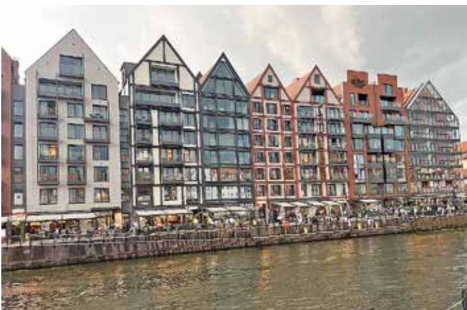
Danzig – Altstadt

Am Sonntag schließlich ein Tag ausschließlich in Olsztyn. Die immer wieder lohnende Besichtigung im Freilichtmuseum sowie einem erholsamen Aufenthalt im Erholungszentrum Mierki folgte die Besichtigung im multimedialen Museum