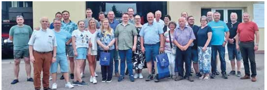
Die Reisegruppe mit Gastgebern bei der Feuerwehr in Olsztynek

Jugendliche an. Eröffnet wurde das Gebäude am 10. Dezember 1995 in einem Festakt durch den damaligen Marschall des Sejm Józef Oleksy und die damalige Bundestagspräsidentin Rita Süssmuth. Die Ostercappeller Gruppe konnte feststellen, dass hier sich für Schulen