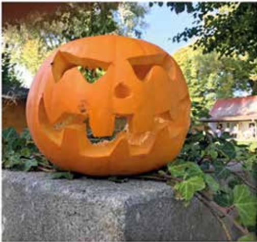
Lustige Kürbisgesichter und frisch gepflückte Äpfel hießen die Gäste am Eingang zum Leuchtenburger Garten willkommen.

gerichtet steuerten die Kinder den Basteltisch an, um alleine oder gemeinsam mit Eltern oder Großeltern einem der orangefarbenen Gesellen eine lustige Fratze zu verpassen. Spezielle Schnitzmesser sorgten für Spaß ohne Verletzungsgefahr. Auch die heiße Kürbissuppe fand großen Anklang. Nach veganer Rezeptur von einigen Frauen des Ver-