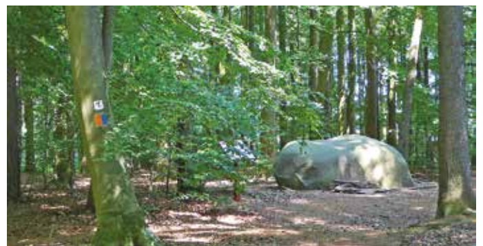
Der Butterstein ist der größte Findling im Naturschutzgebiet Steinernes Meer. Um ihn rankt sich eine besondere Sage. Als was er vor langer Zeit tatsächlich einst diente, erklärt der Archäologe Bodo Zehm auf einer Führung zum 100-jährigen Jubiläum des Naturschutzgebiets.