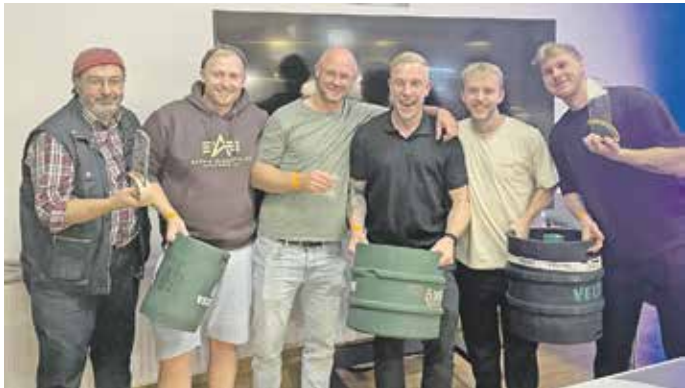
V. l. Team Die wilden Hähne, Mitte Team Pegelbrüder, rechts Team Promille Jünger