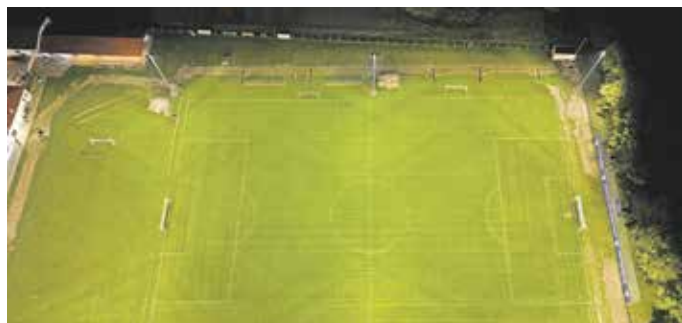
Leistungsstark und gleichzeitig energieeffizient – Spitzenleistung von Fa. Sportslight GmbH aus Engelskirchen

oder muss. Hinzu kommen die gesetzlich vorgeschriebenen Prozesse des Bau- und Immissionsschutzrechts, notwendige öffentliche Ausschreibungen, externe statische Prüfungen und Freigaben – und all das musste mit dem laufenden Trainings- und Spielbetrieb abgestimmt werden.