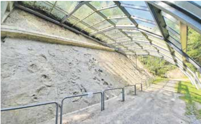
Vor 150 Millionen Jahren hinterließen Dinosaurier ihre Fährten.