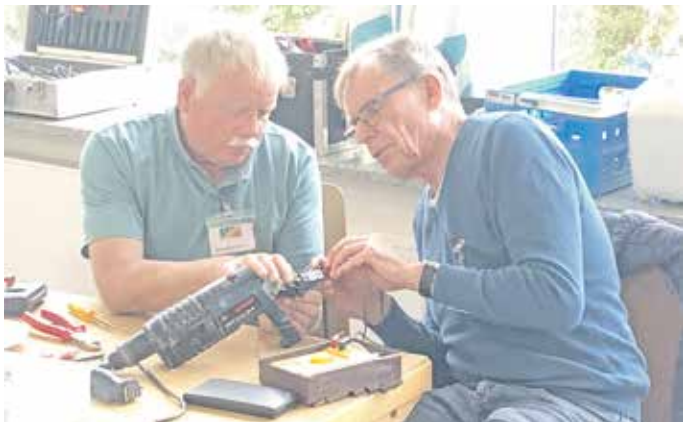
bel verschiedener Durchmesser und Längen ab.

instand gesetzt. Hierbei bleibt bei Kaffee und Kuchen gerne auch Zeit für ein (Fach-)Gespräch. Im Übrigen bietet der Verein in seinem Laden in der Klosterstraße 1 (geöffnet jeden Samstag von 9:30 bis 11:30 Uhr) und auf der Internetseite www.retro-ostercappeln.de gut erhaltene, teils neuwertige Geräte (Haushalts-, Multimedia-, Büro- und Gartengeräte sowie Werkzeuge) gegen eine Spende an. Anfragen gerne auch per E-Mail an info@retro-ostercappeln.de . Übrigens: ReTrO hat auch LED-Leuchtmittel und Glühbirnen – auch ältere und seltene Modelle – im Angebot. Ebenso gibt ReTrO Elektroka-