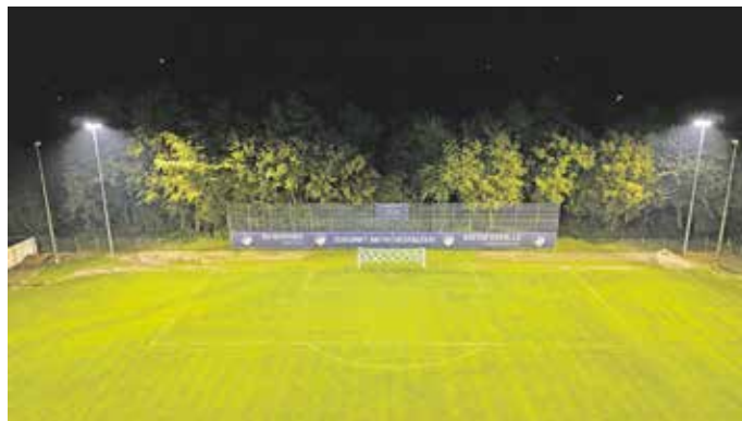
Der Sportpark in Wimmer – hochmodern und leistungsstark – ZUKUNFT AKTIV GESTALTEN

Dann um die Frage, wie die technische Lösung aussehen darf, soll