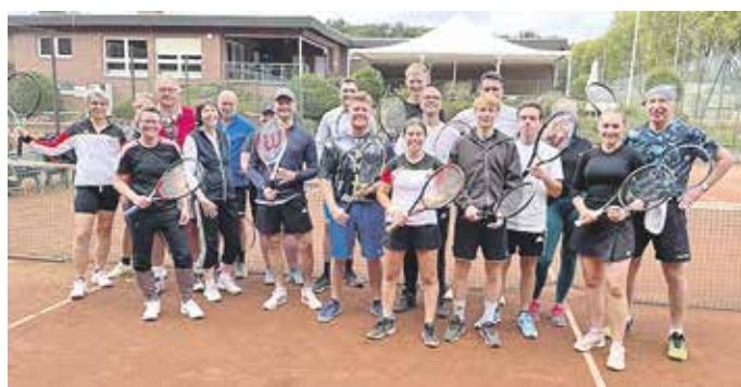
Teilnehmer Saisonabschluss 2025

Am Abschluss des Nachmittages wurden dann die Sieger des Tages, aber auch die der zurückliegenden Vereinsmeisterschaft geehrt. Nach den Ehrungen klang der Tag mit einem gemütlichen Zusammensein aus. Dabei wurden noch viele Anekdoten erzählt, neue Ideen ausgetauscht und neue Pläne geschmiedet. So gingen schließlich alle mit der Erinnerung an viele schöne Stunden auf dem Tennisplatz und noch mehr neuen Ideen und Plänen für die kommende Saison nach