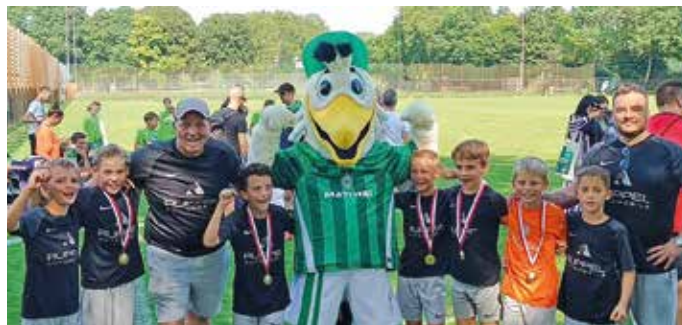
Ein echtes Siegerteam zusammen mit dem WERDER-Maskottchen

schaftsfoto mit dem WERDER-Maskottchen sind wir ziemlich stolz nach Hause gefahren. Als Stärkung wurde (natürlich) auch beim MCD angehalten.