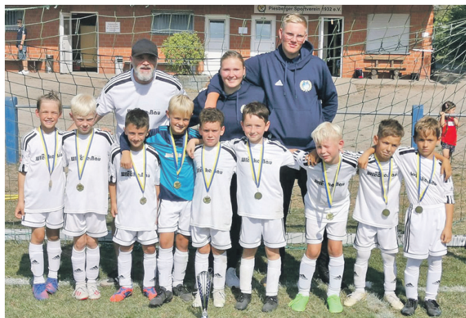
U9 der JSG Wimmer/Lintorf - Platz 2 nach einer überragenden Leistung

Sonja Dunkhorst und Finchen Bergmann hatten alles vorbereitet und verwöhnten uns mit leckerem Butterkuchen und Kaffee. Nach dem sich alle gestärkt hatten, begann die Führung, aber erst mussten alle über die Schuhe, aus hygienischen Gründen und zum Schutz der Tiere, Schuhüberzieher überstreifen.