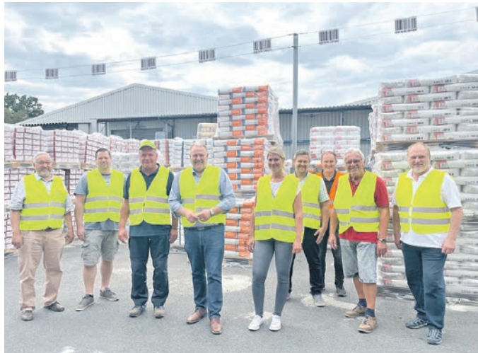
Mit Sicherheitswesten bei quick-mix unterwegs

Quick-mix ist die Traditionsmarke für hochwertige Mörtel-, Beton- und Reparatur- sowie Abdichtungssysteme. In Ostercappeln-Schwagstorf ist die Firma bereits seit vielen Jahren ansässig, nämlich mit Beginn des Kiesabbaus.