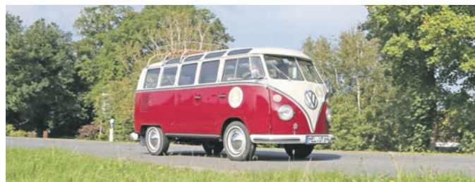
Klassiker auf vier Rädern wie dieser werden am 16. und 17. September bei den Classic Days durch das Osnabrücker Land fahren.

Am 16. und 17. September machen sich wieder Fahrerinnen und Fahrer von historischen Automobilen und modernen Elektro-Autos auf den Weg durch das Osnabrücker Land.