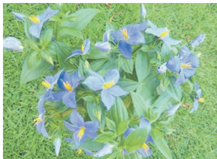
'Blaues Lieschen' im Topf

Lungenenzian wächst bevorzugt auf anmoorigen, sauren, feuchten Böden und blüht ab Ende Juli, vorwiegend im August mit seinen hübschen intensiv-blauen Blüten, kann mit seinen Blütenstängeln 30-40 hoch werden und ist eine wichtige Futterpflanze speziell für einen Schmetterling, den Ameisenbläuling.