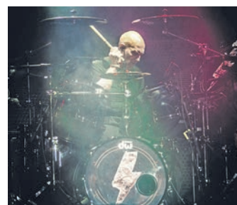
Chris Slade MD