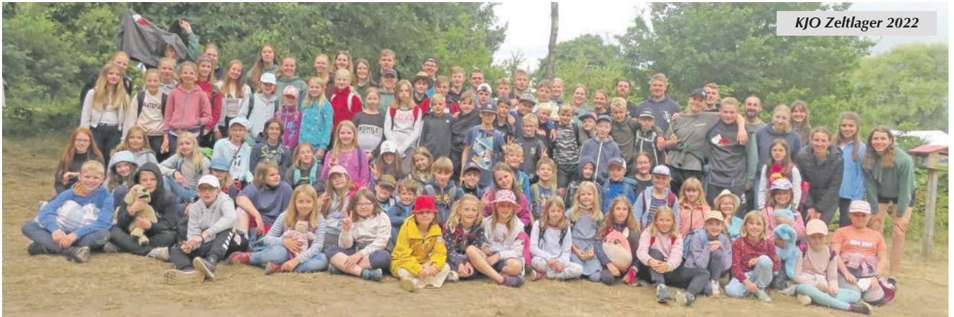
KJO Zeltlager 2022