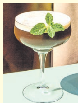
Kaffee und Honig für die Zubereitung des Espresso-Juleps gibt es auch aus fairem Handel.

Als Erstes einen doppelten Espresso zubereiten. Diesen dann mit der Minze und dem Honig oder Sirup im Cocktailshaker gut mixen. Eiswürfel dazugeben und nochmals kurz schütteln. Den Inhalt in ein Glas geben und mit einigen Blättern Minze garnieren. Wahlweise Milchschaum hinzufügen.