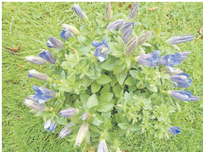
Stängelloser Enzian als Topfpflanze

Gehölzen und die zunehmende Trockenheit.