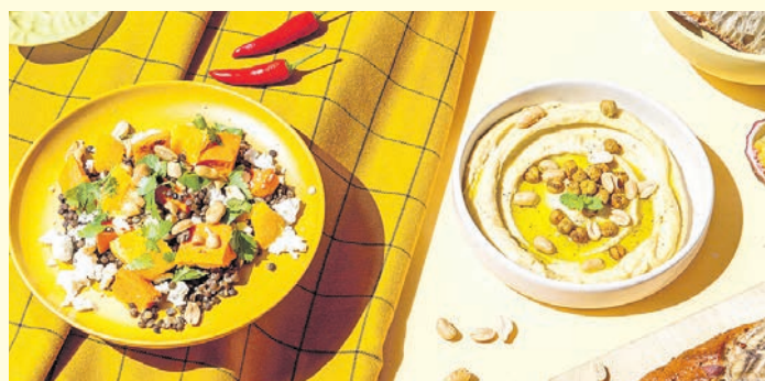
Faire Vielfalt: Ob Süßkartoffeln mit Feta, ein Bananenbrot oder Linsenhofladen mit Erdnuss-Humus: Mit fair gehandelten Zutaten lassen sich viele Köstlichkeiten zubereiten.

Ein Einkaufsfinder unter www.fairtrade-deutschland.de/ einkaufen verrät, wo es die Produkte in Wohnortnähe zu kaufen gibt – ein Rezeptfinder bietet zudem leckere Rezepte mit Zutaten aus dem fairen Handel.