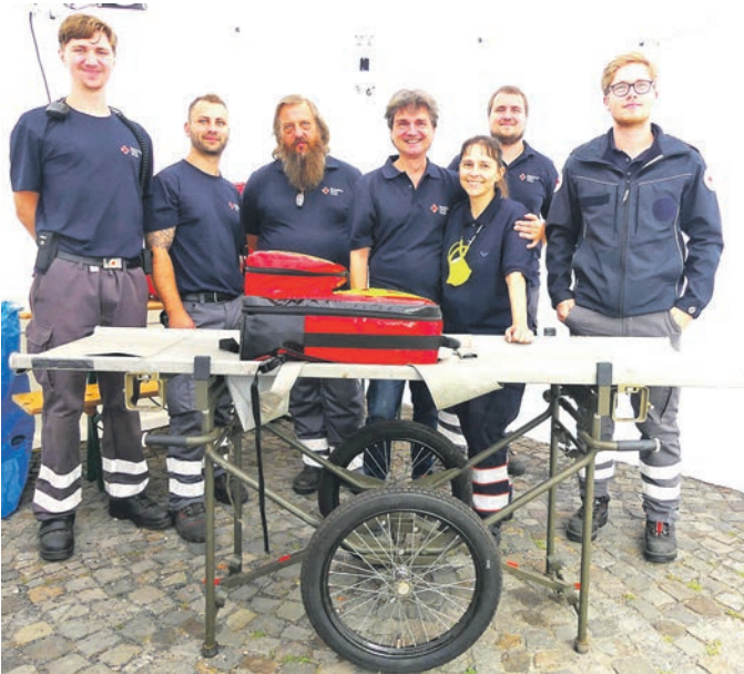
Die Sanitätshelfer des DRK-Ortsvereins Bad Essen beim Historischen Markt

Aufgeteilt in mehrere Schichten leisteten die DRK-Hilfskräfte bis 2 Uhr nach Mitternacht einen anspruchsvollen Bereitschaftsdienst. Bereits am Freitag gab es zwei Patienten zu versorgen, die an akuter Kreislaufschwäche litten. Die ehrenamtlichen Sanitätskräfte erkannten sofort den Ernst der Lage und verständigten den hauptamtlichen Rettungsdienst und den Notarzt, weil Kreislaufschwächen immer ein Hochrisiko bedeuten können.