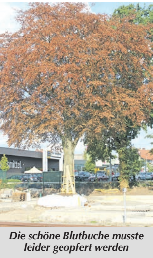
Die schöne Blutbuche musste leider geopfert werden

Ich bin gespannt auf das eigenartige Bild: Der große Dohlenschwarm in dem großen Baumgerippe. Dr. Klaus Mees, Herringhausen ●