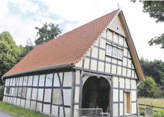
Ein sehr schmales Dreiständer-Fachwerkhaus und das große Dielentor auf der Nord-Ost-Seite.

Belastung. So wurde ein Abbruch des Gebäudes erwogen. In der Ortschaft Brockhausen waren etliche Einwohner mit dem Gebäude emotional verbunden, womöglich weil sie selbst in Jugendjahren ihre Freizeit in dem Gebäude verbrachten. Es gab – wie in solchen Fällen üblich – eine Abstimmung und eine knappe Mehrheit entschied sich für den Abbruch. Ein Argument war auch: Das Gebäude steht zu dicht an der Hauptverkehrsachse, dem Brockhauser Weg; der Fahrbahnverlauf ist nicht einsehbar.