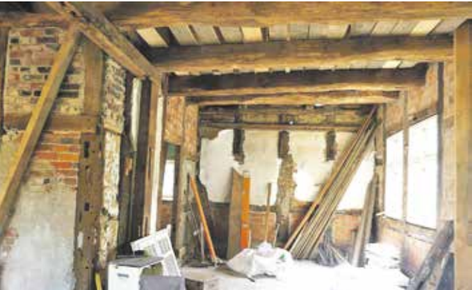
Das Kamerfak von der Innenansicht im Rohbau-Zustand

Die Gemeinde Bad Essen nahm die Abstimmung zur Kenntnis und die