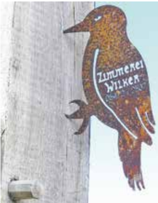
Der Specht – wohl passende Symbolik zum alten Handwerk der Bauzimmererei.

mit seinem Betrieb schon qualifiziert viele Fachwerkhäuser grundsaniert hat. Er bot der Gemeinde eine angemessen niedrige Kaufsumme nur für den Bodenwert. Die Gemeinde Bad Essen zeigte sich flexibel und auch kostenbewusst – denn sonst hätten aus dem Gemeindehaushalt die Abbruchkosten bezahlt werden müssen. Das Gebäude war nicht mehr als Baudenkmal eingestuft – und nachträglich kann dieser Status angeblich nach dem Denkmalschutzgesetz nicht wieder zuerkannt werden. In dem Kaufvertrag wurde dinglich vereinbart, dass der Erwerber das Gebäude für eine folgende Nutzung innerhalb von sechs Jahren sanieren muss. Zimmermeister Jens Wilker ist hierbei auf einem guten Weg; immer dann, wenn er Handwerkskräfte bei anderen Auftragsbauten entbehren kann, arbeiten diese an dem Projekt in Brockhausen. Hier ist alles offen und sehr einsichtig; die Einwohner der Ortschaft sind mit dem Sanierungsprojekt wohl überwiegend sehr einverstanden. Jens Wilker, der den Baufortschritt begleitet, erklärt dem Laien die Grundstruktur des Gebäudes. Es könnte einst ein Wagenschuppen mit einer Stallzeile gewesen sein. Das Kamerfak zur Südseite dürfte zu einem späteren Zeitpunkt angefügt worden sein, wie die Ständerstruktur zeigt. Das Gebäude soll einst auf dem Meyerhof in Brockhausen gestanden haben; es wurde vermutlich irgendwann umgesetzt auf den jetzigen Standort. Die Renovierung eines solchen Ge-