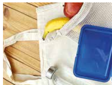
Die AWIGO gibt Tipps zur Abfallvermeidung im Alltag.

Wer über eine Neuanschaffung nachdenkt, sollte sich überlegen, ob der Kauf wirklich notwendig ist. Viele Dinge, zum Beispiel Werkzeuge, können heute ausgeliehen oder