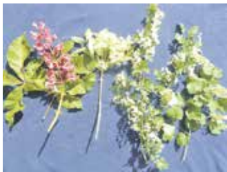
Rotblühende Kastanie, Blumenesche, Weißdorn, Gew. Schneeball

Unübersehbar ist die Vielzahl der jetzt blühenden Wild- und Gartenpflanzen. Aus der Fülle sollen nur die wenigen Beispiele herausgegriffen werden. Bei den Gehölzen fallen besonders die prachtvollen „Kerzen“ der weiß blühenden Rosskastanie ( Aesculus hippocastanum ), leider zunehmend befallen von der Kastanien-Miniermotte und die bisher befallsfreie rotblühende Art ( Aesculus carnea ) ins Auge. Hübsch sind auch die Blütenstände der leider viel zu selten gepflanzten Blumenesche ( Fraxinus