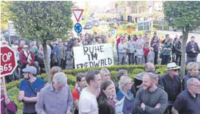
2. Mai 2016: Eine solche Demonstration hatte Bad Essen bis dato noch nicht gesehen.

Er folgte gern der Einladung der Bürgerinitiative, um sich vor Ort in Bad Essen ein Bild vom Verlauf der