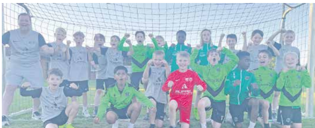
Fußball verbindet - die Nachwuchstalente von H96 bei uns in Wimmer zum gemeinsamen Abschlussabend

Damit dieses Turnier überhaupt stattfinden kann, werden Partnerschaften mit regionalen Vereinen aus Osnabrück geschlossen, die Teams aus den Nachwuchsleistungszentren als Übernachtungsgäste aufnehmen. Diese Gelegenheit und Chance haben wir uns natürlich nicht entgehen lassen. Die Losfee hat uns Hannover 96 als Gegner zugelost. Darüber waren wir sehr glücklich, da wir bereits seit einigen Jahren mit der Nachwuchsschule eine erfolgreiche Partnerschaft pflegen. Hochmotiviert, aber auch ziemlich nervös haben wir uns am vorletzten Samstagmorgen auf den Weg nach Osnabrück gemacht und unser Lager aufgebaut. Schließlich hatten sich ca. 500 Fußballer und etwa 1000 bis 1500 Zuschauer auf dem gesamten Sportgelände versam-