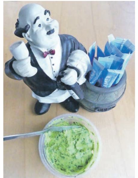
Ein Becher mit frischer Kräuterbutter, schmackhaft, vitamin- und nährstoffreich, als frischer Brotaufstrich oder als Sauce für Nudelgerichte – Bärlauch wächst im Wittlager Land und auch in der Normandie.

Rechteinhaber ist der Verfasser. Dieser Beitrag ist dauerhaft auf der Homepage „Centrales Ländliches Vereins-Archiv e.V.“ www.clva.de im Virtuellen Lesersaal in der Rubrik „2. Brauchtum in Haushalten“ veröffentlicht.