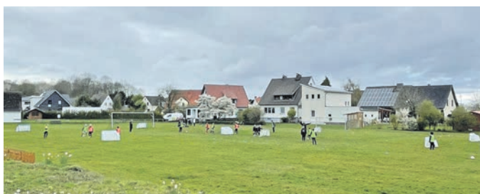
Abbildung 1: Die U10 der JSG Wimmer/Lintorf mit voller Begeisterung beim Training

Der Deutsche Fußball-Bund hilft den Vereinen, die Herausforderungen der Zukunft erfolgreich zu meistern. So kommt der DFB mit seinen Trainern auch direkt an die Basis und hat hierfür 30 DFB-Mobile bundesweit zur Verfügung.