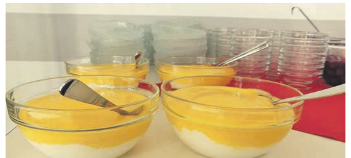
Weißgelb, die zwei Schichten der beliebten „Welfenspeise“, ein Hochgenuss auch im „Wittlager Land“.

„Welfen“ – deshalb auch der Name. Es soll die Lieblingsspeise des damaligen Kurfürsten Ernst August zu Braunschweig und Lüneburg gewesen sein. Die Welfen sind heute der Generation kaum mehr bekannt, wenn sie nicht geschichtsbewusst sind – aber der Name der „Welfenspeise“ wird womöglich das Adelsgeschlecht noch überdauern.