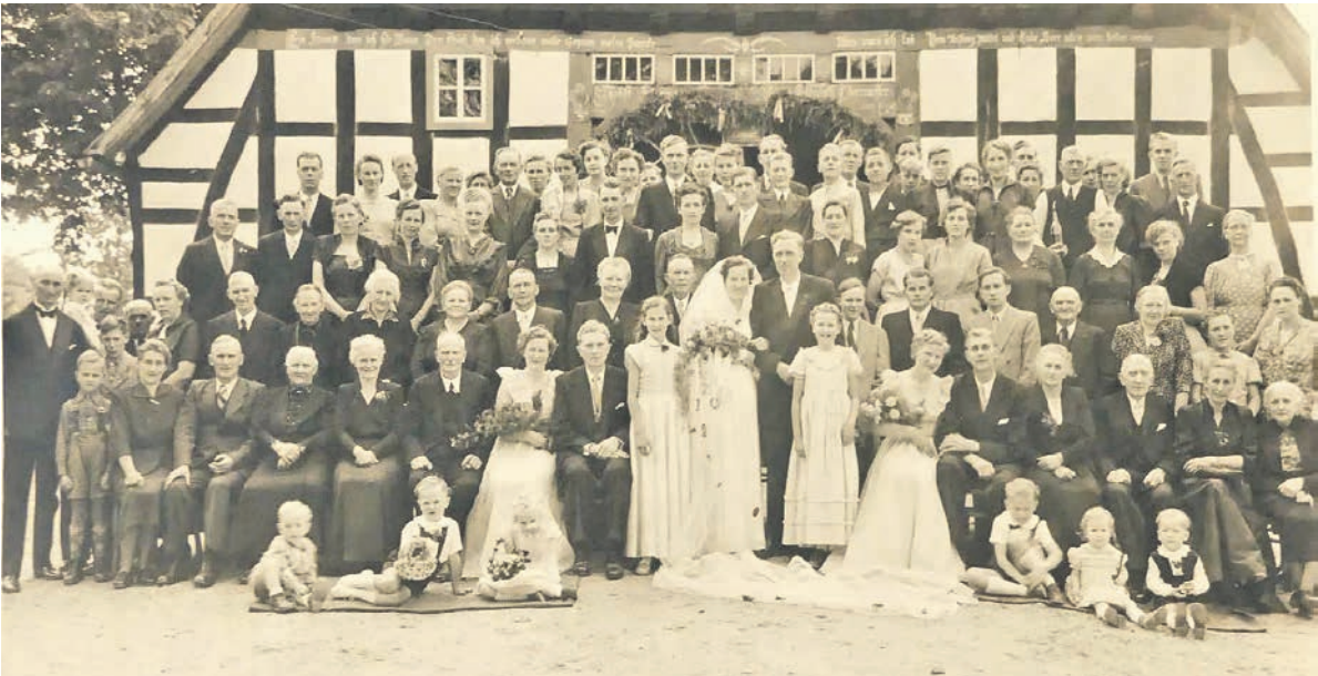
Foto der „Lichtbildanstalt Dorscheid“ Bad Essen, mit einer Plattenkamera auf Stativ. Repro: E. Grönemeyer

© Copyright 2023 – Alle Rechte an vorstehenden Texten und Abbildungen sind urheberrechtlich geschützt. Rechteinhaber ist der Verfasser. Dieser Beitrag ist dauerhaft auf der Homepage „Centrales Ländliches Vereins-Archiv e.V.“ www.clva.de im Virtuellen Lesersaal in der Rubrik „2. Brauchtum in Haushalten“ veröffentlicht.