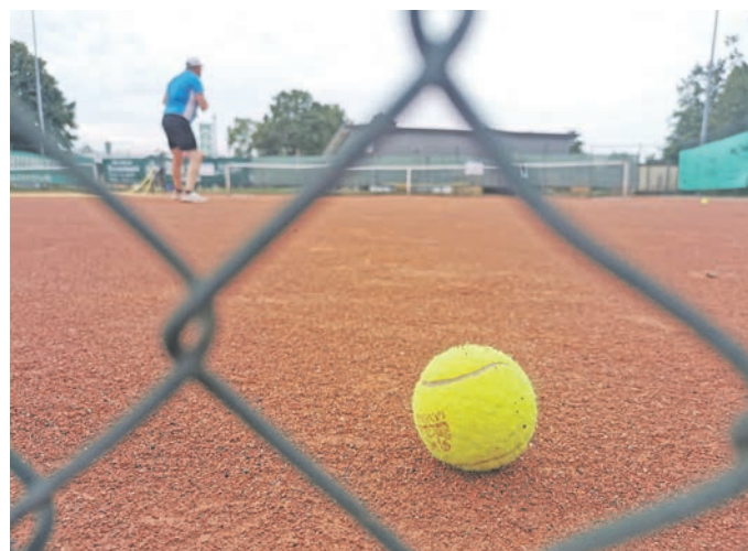
Die Tennissaison in Hunteburg startet am 27. April mit dem Schleifchenturnier.

Das Schleifchenturnier ist der Auftakt in eine Sommersaison, die geprägt sein wird von einem regen Punktspielbetrieb auf der Tennisanlage. 12 Mannschaften hat der Hunteburger Verein in diesem Jahr gemeldet - bei einer Mitgliederzahl von 210 Personen (Stand