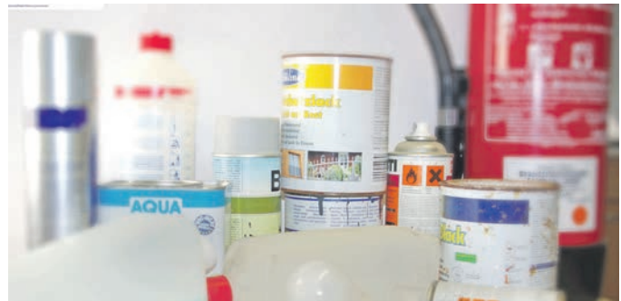
Sonderabfälle wie die hier abgebildeten können Privathaushalte beim AWIGO-Schadstoffmobil entsorgen.

Folgendes kann in haushaltsüblichen Mengen zum Schadstoffmobil gebracht werden: Abbeizmittel, Batterien und Bleiakkus, Energiespar- lampen, FCKW-haltige Stoffe, Feuerlöscher, Foto- und Hobbychemi- kalien, Frostschutzmittel, Holzschutzmittel, Lack- und Farbeimer aus Kunststoff oder Metall, Laugen, Leuchtstoffröhren, Pestizide, Pflan- zenschutzmittel, Ölfarben, Quecksilber, Rostumwandler, Salmiak, Säuren, Schädlingsbekämpfungsmittel, Spiritus sowie Spraydosen. Völlig ausgehärtete Farbreste und ausgetrocknete Pinsel können über die Restmülltonne entsorgt werden, da die schadstoffhaltigen Löse- mittel in den Farben bereits verdunstet sind. Aufgrund der Rücknah- mepflicht für den Handel bei Altöl kann dieses nicht bei dem Schadstoffmobil entgegengenommen werden.