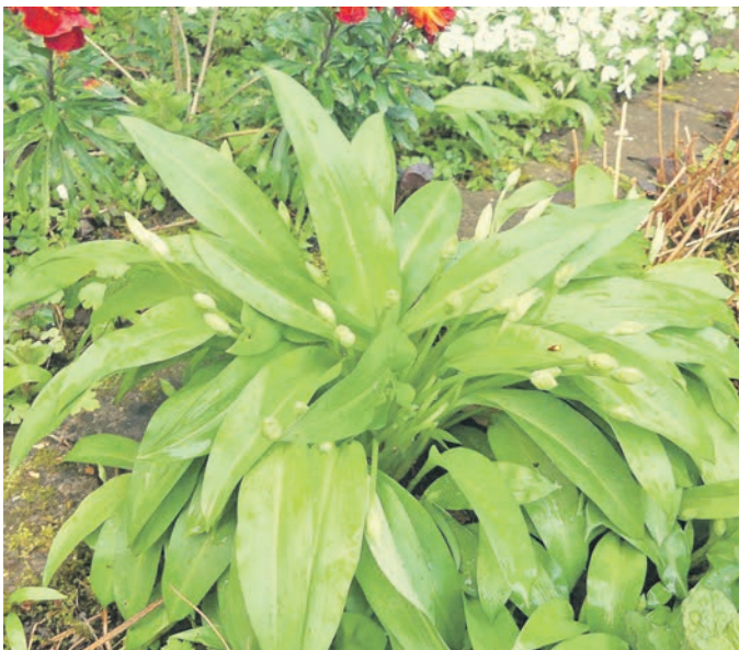
Ein Bärlauch-Busch, der etwa 20-30 cm hoch wird, hier schon sichtbar die Blüten, die je nach Witterung etwa im Mai ihre Blütezeit haben.

Die nachwachsende Generation in ihrer Mehrzahl entfernt sich zusehends davon, Gemüse im kleinen Gartenbeet, einen kleinen Kräutergarten anzulegen und die selbst angebauten Gartenfrüchte für den Speiseplan zu verarbeiten. Möglicherweise kennen jüngere Zeitgenossen die Bärlauch-Pflanze im Beet gar nicht; während die