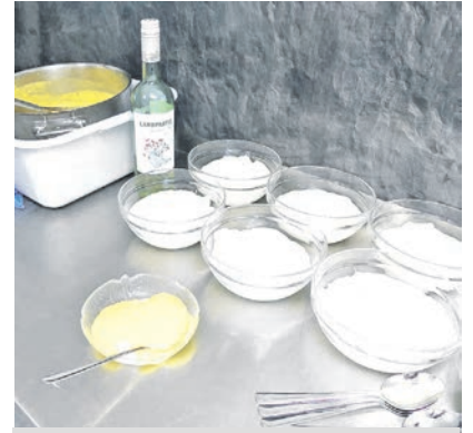
Die mit Milch-Vanille und sehr steif geschlagenen Eiweißschaum hier in Dessertschüsseln zum Erkalten abgefüllt.

Einmal soll ein Koch in Hannover diese süße Nachspeise kreiert haben. Warum: Die Wappenfarben des Welfengeschlechts waren „Weißgelb“ und so entsprechen die zwei Schichten dieser Süßspeise genau der Wappenfarbe der