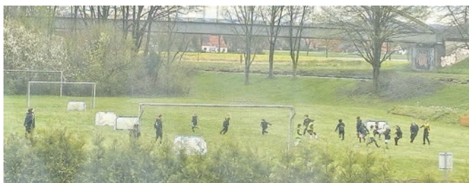
Hier die Aktivierungsphase - Fangspiel mit Teamplayergedanken

Es musste kurzfristig unkoordiniert werden, weil die Trainingsplätze in Wimmer und Lintorf nicht bespielbar waren. Da wir die Gelegenheit nicht verstreichen lassen wollten und die Kids unfassbar viel Bock auf Fußball haben, sind wir spontan nach Brockhausen auf den Bolzplatz ausgewichen. Alles in allem die komplett richtige Entscheidung. Dass der Platz keinem englischen Rasen glich, spielte über-