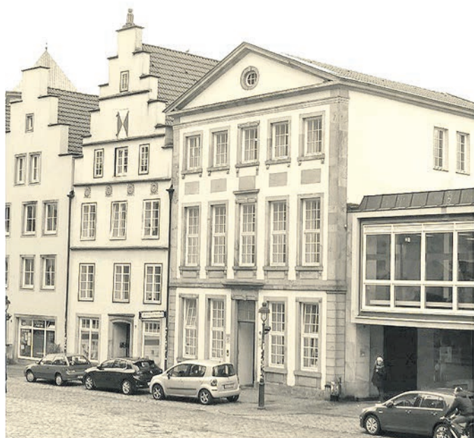
Das „Remarque-Friedenszentrum“ am Rathaus-Platz in Osnabrück