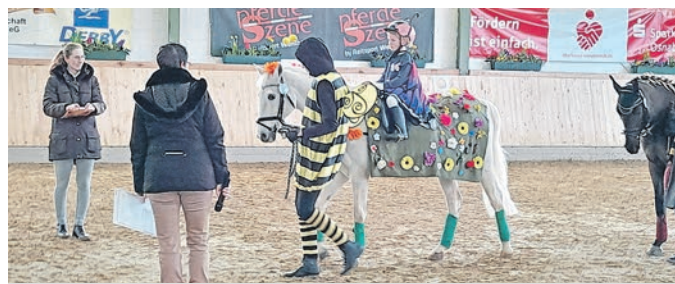
Führzügel-Wettbewerb mit Kostüm

Das Reitturnier des RuFV Bad Essen am 1. Aprilwochenende in Eielstädt bedurfte einigen Optimismus seitens des Veranstalters, der Reiterschar und auch der Zuschauerinnen und Zuschauer, der aber spätestens am Sonntag belohnt wurde.