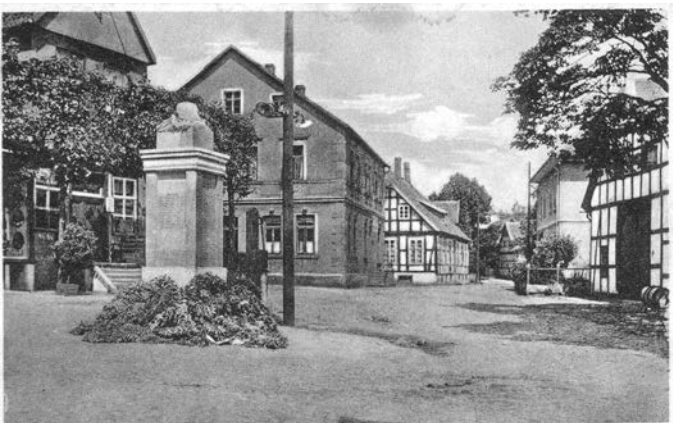
Ostercappeln Marktplatz mit Kriegerdenkmal