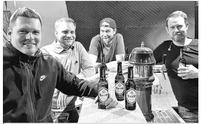
Under The Bitch

Um die Besucher auf die Jam einzustimmen, ist es Tradition, dass zu Beginn des Abends ein oder zwei Bands jeweils für 30 Minuten spielen. Im April werden „Bluesbird“ und „Under the Bitch“ auf der Bühne stehen. „Lady Sings The Blues“ – dieses Motto prägt den Sound von „Bluesbird“. Nicht nur der reine Blues, sondern auch Rock und Country gehen in das Klangerlebnis „Bluesbird“ ein. Ein kerniger Sopran mit angerautem Timbre, schwebende Gitarren, Bluesharp, Resonatorgitarre, dazu die stabile Seitenlage einer treibenden Rhythmusgruppe mit jeder Menge Groove: das ist der Sound von „Bluesbird“. „Under The Bitch“ – das ist eine frische Band aus dem Mühlenkreis, die mit viel Spielfreude den Sound der kalifornischen Funk-Rock-Legenden „Red Hot Chili Peppers“ auf die Bretter bringt. Die Besucher können dabei sein wenn die vier Musik-Nerds ihre Formation erstmalig frische Bühnenluft schnuppern lassen.