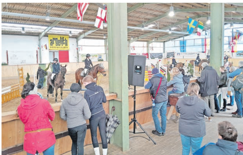
Turnieratmosphäre in Bad Essen

Das Mammobil wird bis Ende Mai 2023 am Sole-Freibad Bad Essen zur Verfügung stehen.