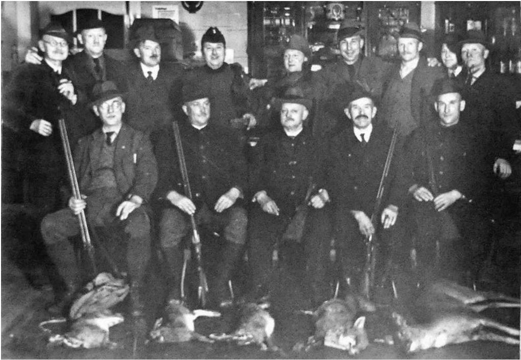
Wittlager Jäger in der Zeit vor dem Zweiten Weltkrieg mit dem erlegten Wildbret.

Industriegewerkschaft Bauen-Agrar-Umwelt