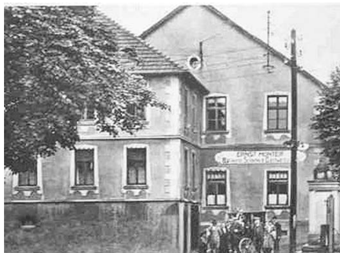
Haus Mönter in den 20er Jahren