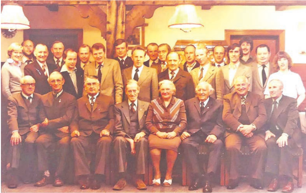
Historisches Foto aus den 1960/70er Jahren mit Angehörigen der Jägerschaft Wittlage bei einem Familienjubiläum im einstigen Kurhotel Höger in Bad Essen

© Copyright 2023 – Alle Rechte an vorstehenden Texten und Abbildungen sind urheberrechtlich geschützt. Rechteinhaber ist der Verfasser. Dieser Beitrag wurde mit Unterstützung des gemeinnützigen Vereins „Centrales Ländliches Vereins-Archiv e.V.“, Bad Essen, veröffentlicht.