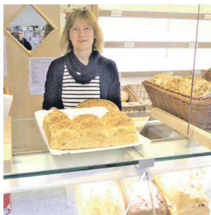
Handwerksbäckereien - dort wo die Backmischungen handwerklich manuell vorbereitet und mit dem Backen abgeschlossen und die