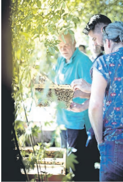
Die Bienen, ihr Wesen und ihre Bedürfnisse stehen bei den Imkerkursen von Mellifera e. V. im Vordergrund.

An 5 Tagen lernen Naturinteressierte dabei, wie Bienen wesensgemäß gehalten werden können und wie das in der Praxis funktioniert.