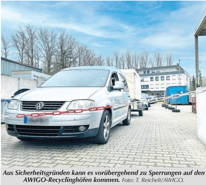
Aus Sicherheitsgründen kann es vorübergehend zu Sperrungen auf den AWIGO-Recyclinghöfen kommen.

Landkreis Osnabrück. Da es aktuell zu vermehrten Rückfragen kommt, will die AWIGO Abfallwirtschaft Landkreis Osnabrück GmbH mit dieser Pressemitteilung zu folgenden Gegebenheiten auf ihren landkreisweit sechs Recyclinghöfen informieren: