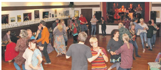
Beim Bal Folk werden Kreis-, Reihen- und Paartänze zu Live-Musik getanzt.

Allen Teilnehmern ein herzliches Dankeschön - es war ein sehr schöner Tag in Hamburg. Mal schauen, wohin die Kolpingfamilie bald wieder „on Tour“ geht.