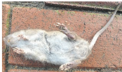
gut genährte Ratte

Das Ergebnis war wie in den vergangenen Jahren deprimierend, denn von einem Rückgang des Mülloutputs im innerörtlichen Bereich und in der freien Landschaft kann nicht die Rede sein.