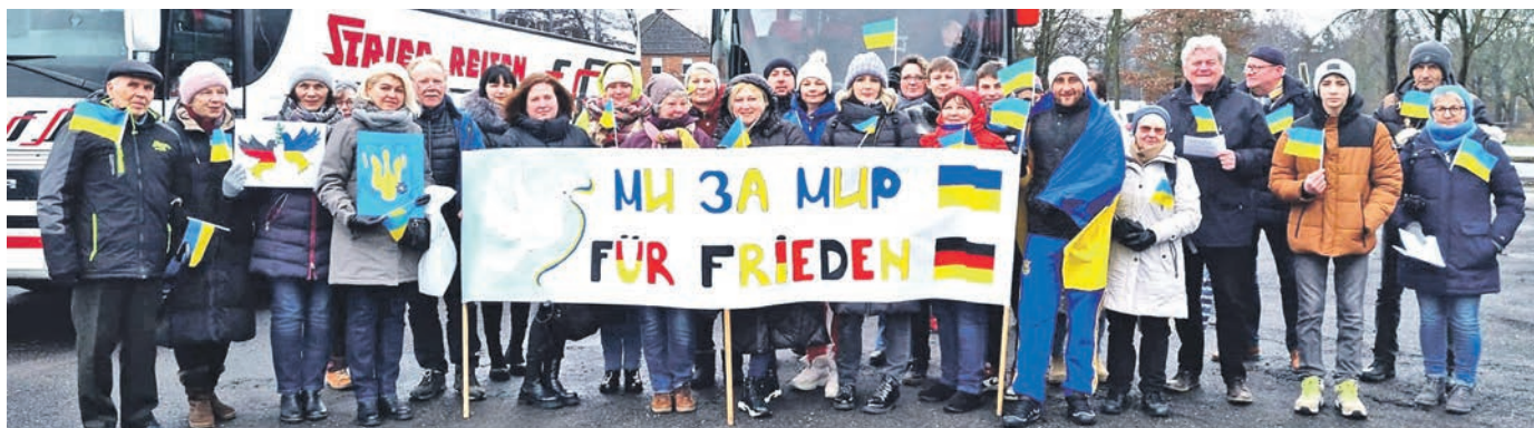
Die Teilnehmergruppe aus dem „Wittlager Land“ an der „Friedenskette“

OK! BAD ESSEN Offene Kommune Bad Essen e.V.