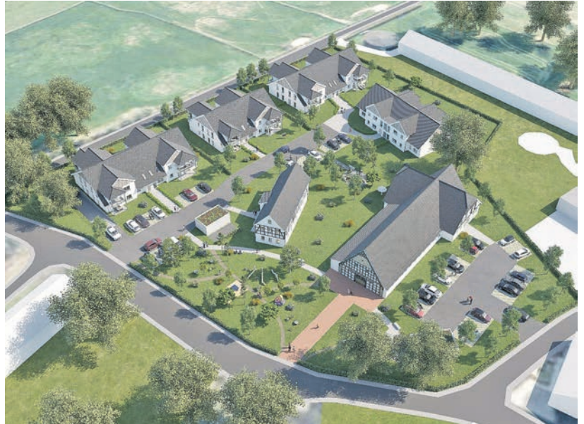
Blick von der Nordseite auf die insgesamt rd. 1,2 Hektar große Hofffläche, vorne am Bildrand der Maschweg. Das Konzept sieht eine Freifläche von rd. 7000 m 2 vor, die frei von Bebauung bleiben soll.

Das Niederschlagswasser der Dachflächen und der versiegelten Hoffflächen soll in den Eielstädter Mühlenbach eingeleitet werden. Damit es bei einem Starkregenereignis nicht zu Überflutung und einem Rückstau kommt, könnte wie bereits beim Baugebiet „In der Eielstädter Spitze“ in unterirdischen Speicherröhren eine Regenrückhaltung vorgenommen werden. Ein offenes Regenrückhaltebecken bietet sich innerhalb einer Ortslage nicht an.