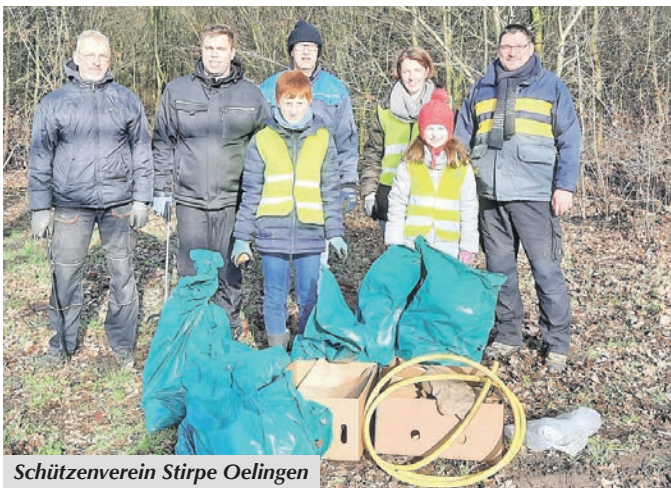
Schützenverein Stirpe Oelingen

Besucher können am Reparaturtag defekte (Elektro-)Geräte bringen. Die Geräte werden von den fachkundigen, ehrenamtlichen Vereinsmitgliedern inspiziert und - soweit möglich - gegen eine Spende instandgesetzt. Hierbei bleibt bei Kaffee und Kuchen gerne auch Zeit für ein (Fach-)Gespräch. Im Übrigen bietet der Verein auf der Internetseite www.retro-ostercappeln.de gut erhaltene, teilweise neuwertige Geräte gegen eine Spende an. Die Liste umfasst u.a. Haushalts-, Multimedia-, Büro- und Gartengeräte sowie Werkzeuge. Anfragen bitte per E-Mail an info@retro-ostercappeln.de