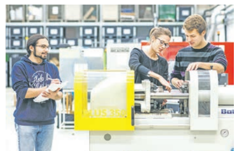
Schülerinnen und Schüler können an der Hochschule Labore erkunden und mehr über Ingenieurstudiengänge erfahren.