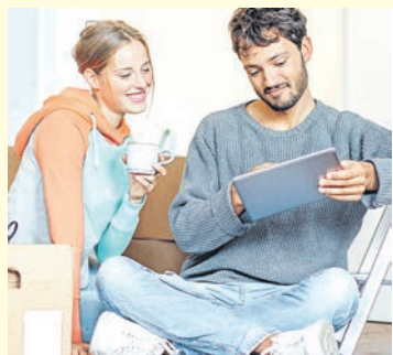
Der Traum vom Eigenheim gehört für viele Paare zur Eheschließung und zur Familienplanung.