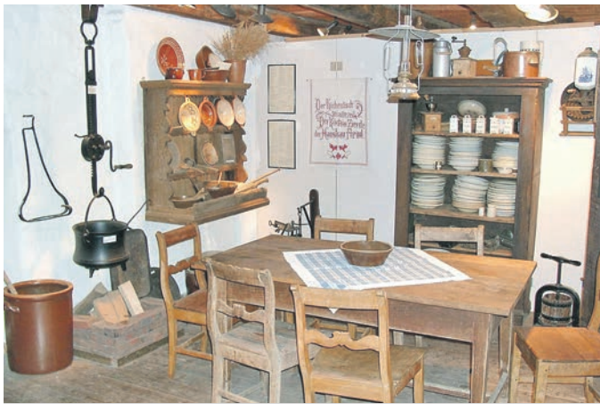
Museum Venner Mühle

Viele Kilometer Wanderwege wurden in Ordnung gehalten und die regelmäßigen Veranstaltungen des Vereins wie der Deutsche Mühltage mit privatem Flohmarkt, der Dorfmarkt zum Erntedankfest und der stimmungsvolle Weihnachtsmarkt haben immer wieder auch überregionale Interessenten angelockt. Unser „Café Pferdestall“ ist ein gern besuchter, sonntäglicher Treffpunkt geworden und im Winterhalbjahr treffen sich die Venner zum „Informativen Kaffeetrinken“ und Klönen über vergangene Zeiten.