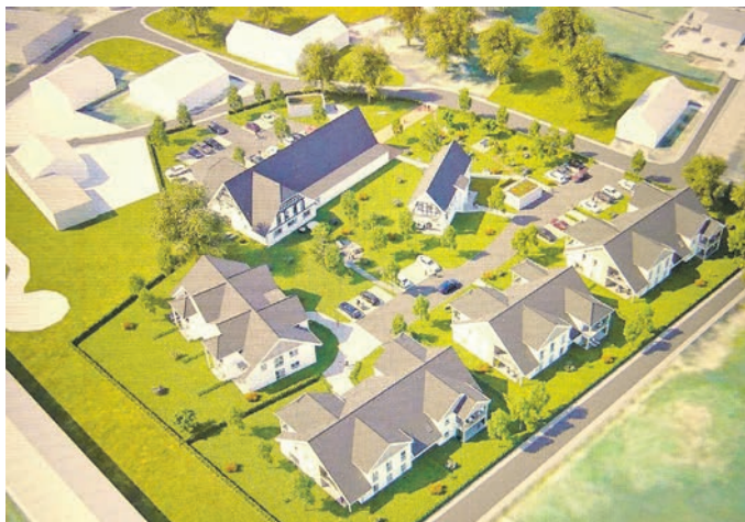
Der Blick von der Süd-Ost-Ecke auf das Bauprojekt, hier bereits die Verbindungsstraße zwischen Hüsender Straße und Lindenstraße

Die drei östlich gelegenen Wohnhäuser werden nur von der Hofffläche erschlossen. Sie halten einen Abstand von 9 m zur künftigen Kreisstraße – der Verbindungsweg zwischen Hüsender Straße und Lindenstraße –; hier könnte als Abschirmung zur offenen Landschaft etwa ein drei Meter breiter Pflanzstreifen entstehen. Unter den drei Wohnhäusern soll eine Tiefgarage entstehen und jeweils Fahrstühle garantieren auch im Obergeschoss barrierefreie Wohnungen.