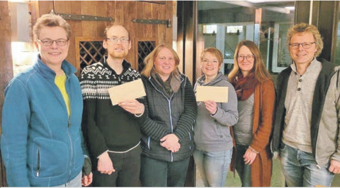
Vertreter der Hunteburger Werbegemeinschaft mit den Vertretern des Kindergarten- und Schulfördervereins.