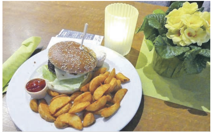
Der Burger, serviert im Restaurant, zum Genießen in fröhlicher Runde.

Wer besonders kräftigen Hunger verspürte, der konnte sich beim Schlemmer-Abend gerne einen zweiten Burger gestalten. Die meisten Gäste werden wohl nach einem hochwertigen Tellergericht gesättigt gewesen sein. Es wird selten geboten, dass die Gäste selbst ihren Burger gestalten können. Insofern erhofft sich die Leitung des Haus Deutsch Krone mit den Schlemmer-Abenden zum Satt-Essen und zum Pauschalpreis von 15,50 EUR, neue Zielgruppen anzusprechen.