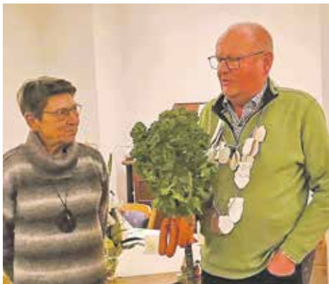
Text und Foto: F. Viere

Der Verein gratulierte dem neuen König und wünschte ihm eine gute Amtszeit!