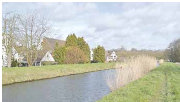
Am Damm zur Siedlung "Am Rott" finden Sondierungen statt.

Burgstraße und Bundesstraße, um dann den MLK zu dükern. Östlich der Wittlager Mühle sorgt ein Wehr aus Spundwänden für Entlastung der Hunte. Wenn diese einen ge- wissen Pegelstand übersteigt, wird das Zuviel an Wasser dort in einen Entlastungsgraben abgeleitet, der östlich der tiefer liegenden Siedlung "Am Rott" in den MLK mündet. Der Entlastungsgraben selbst ist zur Siedlung hin mit einem Damm ein- gefriedet, der die Umgebung zuver- lässig vor Hochwasser schützt. Der UHV 70 lässt nun die Untersuchen- gen durchführen, um das seit rund 50 Jahren bestehende Deichbau- werk auf seine Stabilität zu prüfen. Dazu werden an fünf Standorten Bohrungen vorgenommen, die mit