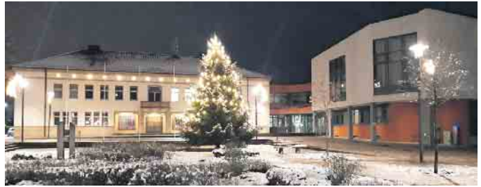
Das Bad Driburger Rathaus ist zwischen den Jahren an zwei Tagen geöffnet.

05253/881800 und das Abwasserwerk unter Tel. 01718146802. Geöffnet ist das Bad Driburger Rathaus zwischen Weihnachten und Neujahr am Montag, den 29. Dezember, und Dienstag, den 30. Dezember 2025. An diesen beiden Tagen sind alle Ämter zu den normalen Dienstzeiten zu erreichen.