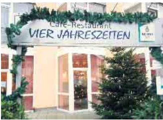
Adventlich geschmücktes Café-Restaurant „Vier Jahreszeiten“.

Am Donnerstag, 18. Dezember, findet im Kino Bad Driburg um 14 Uhr wieder das beliebte Seniorenkino statt. Gezeigt wird der Film „Mit Liebe und Chansons“, der berührend die wahre Geschichte einer Mutter erzählt, die unermüdlich dafür kämpft, dass ihr Sohn trotz eines schweren Handicaps ein selbstbestimmtes Leben führen kann. Der warmherzige französische Film verbindet Gefühl, Hoffnung und kleine musikalische Momente zu einer einfühlsamen Geschichte. Im Anschluss besteht die Möglichkeit zu einer gemeinsamen Kaffeerunde im Café-Restaurant „Vier Jahreszeiten“ des Se-