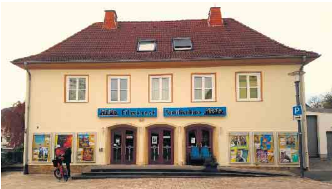
Das Kino Bad Driburg lädt ein.