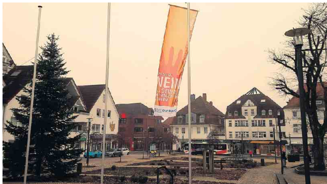
Auf dem Rathausplatz wehte die Fahne mit klarer Botschaft.