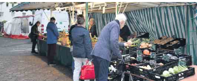
Der Bad Driburger Wochenmarkt zwischen Schulstraße und Freiheit.

che auf einen Feiertag fällt, wird in dieser einen Woche der Termin vorgezogen auf Dienstag, den 23.12. „Alle Kunden, die zu Weihnachten frischen Fisch, Fleisch und Gemüse so-