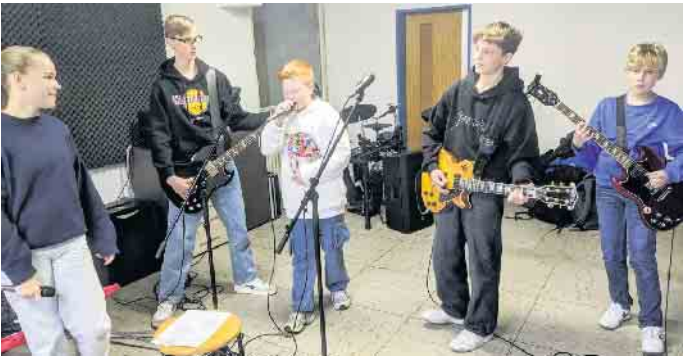
Die Schulband Monkeys On Fire rockt in ihrem Proberaum im Jugendhaus von St. Kaspar.