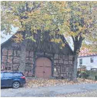
Die beiden Bäume vor dem Weberhaus sind mit Pilzen besiedelt.