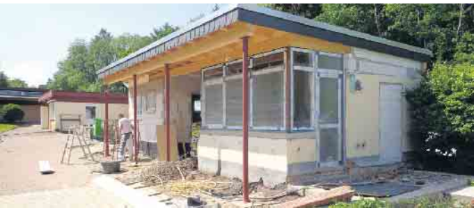
Viel Positives wie der Umbau des Eingangsgebäudes wurde in den vergangenen Jahren realisiert.

ob aktiv oder passiv, ist daher herzlich willkommen. Auch ein eher geringer Jahresbeitrag ist immer ein kleiner Schritt zum Erhalt der Bad Driburger Bäderlandschaft. Bei den Freizeitbädern handelt es sich um wichtige Bausteine in einer lebenswerten, zukunftsorientierten Stadt Bad Driburg für Jung und Alt. Von vielen begeisterten Besucherinnen und Besuchern aus Nah und Fern werden diese Einrichtungen gerne besucht. Der Vorstand freut sich über eine rege Beteiligung und wünscht allen Bewohnern und Gästen der Stadt eine besinnliche und friedvolle Adventszeit.