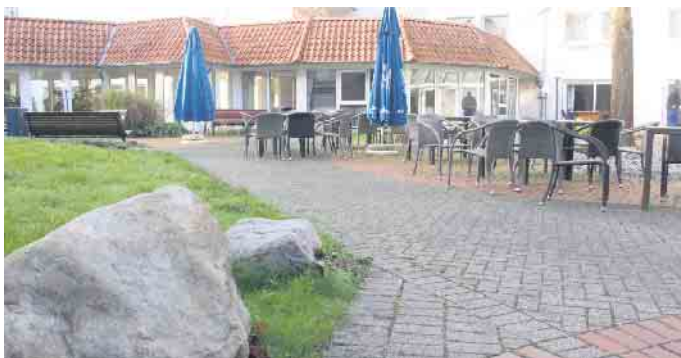
Im großen Innenhof findet am 3. Adventswochenende erstmals ein bunter Weihnachtsmarkt statt.

sagte Braun. In der Zeit zwischen Weihnachten und Neujahr sei das 112-Betten-Haus allerdings restlos ausgebucht. „Wir haben dann gleichzeitig drei größere Gruppen zu Gast“, sagt Braun. Der Weihnachtsmarkt am dritten Adventswochenende ist am Freitag von 15 bis 19 Uhr sowie Samstag und Sonntag von 11 bis 18 Uhr geöffnet. Es gibt adventliche Speisen und Getränke sowie Kunsthandwerk und Dekoratives. Ab Januar soll sonntags in der Zeit von 10 bis 12 Uhr für die Öffentlichkeit ein Familienfrühstück angeboten werden. In der Sommersaison soll der Innenhof als Biergarten das gastronomische Angebot in Bad Driburg ergänzen. Martin Braun: „Das B4 versteht sich nicht nur als Hotel, sondern wir wollen auch gern die Ortsbevölkerung in unser Haus einladen.“