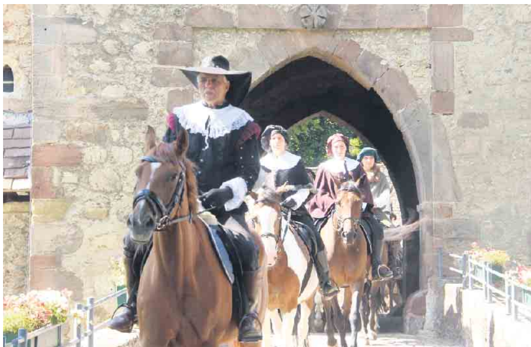
Viele Szenen wurden auf der Burg Dringenberg gedreht.