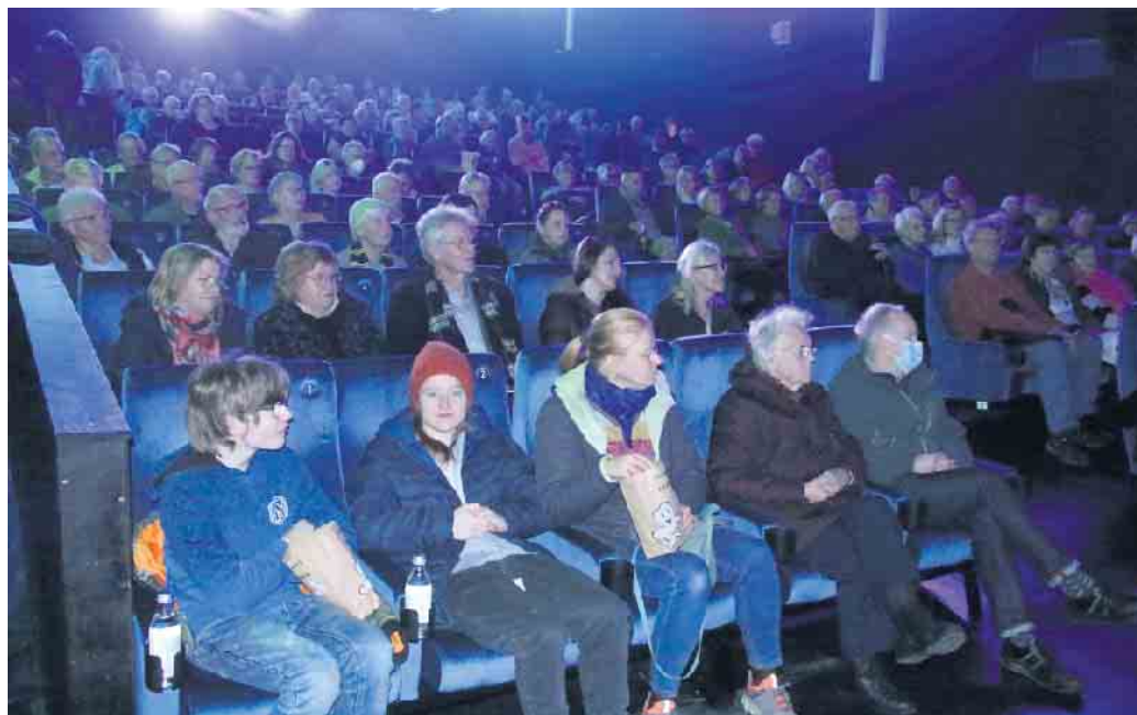
Gleich in zwei Sälen wird die Premiere im ausverkauften Kino gezeigt.

Viele Einstellungen des Films wurden auf der Burg Dringenberg gedreht. So ist der Gewölbekeller der Burg Schauplatz der Karlschanze, wo bis heute der Sachsenschatz vergraben liegen soll. Auch der Wewelsburger Todeschuss wurde nicht auf der Wewelsburg gedreht, sondern ebenfalls auf der Burg Dringenberg. „Das wäre mit den Dreharbeiten an der Wewelsburg viel zu kompliziert geworden, weil wir ja auch mit Pferden dort einreiten müssen, das ließ sich in Dringenberg einfach alles viel besser umsetzen“,