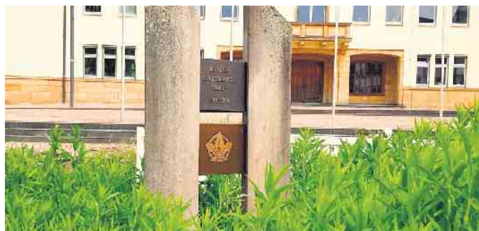
100 Jahre Eggegebirgsverein - der Dreisäulenstein erinnert daran

reicherung des Stadtbildes der Stadt Bad Driburg.“