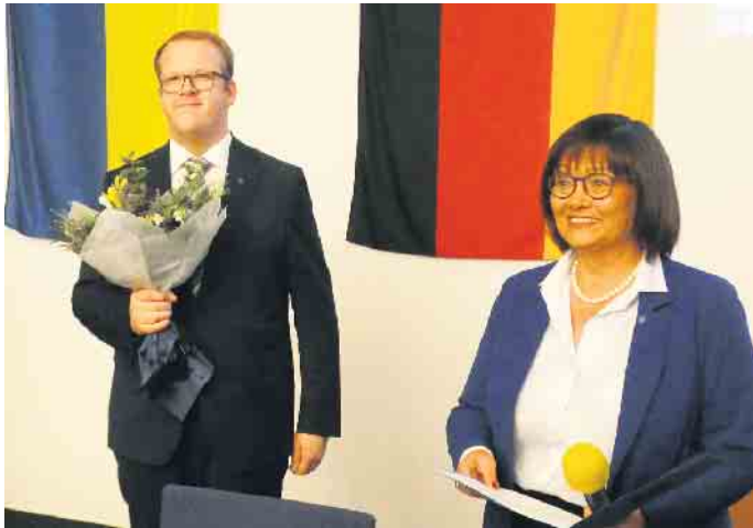
Über 100 Zuschauer verfolgten die konstituierende Sitzung im Ratssaal.

und betonte die Bedeutung von kooperativer, gemeinschaftlicher Arbeit der kommunalpolitischen Akteure zum Wohle der Stadt und der Bürgerschaft. Nach der Vereidigung zeigte sich der neue Bürgermeister bewegt und zugleich entschlossen: „Es ist für mich eine große Ehre, das Vertrauen der Bürgerschaft erhalten zu haben und als Bürgermeister dieser Stadt wirken zu dürfen. Dieses Vertrauen ist mir