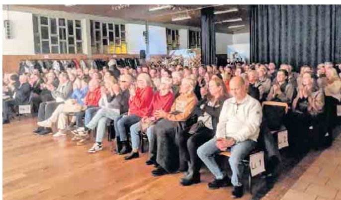
Zur Premiere war die Martinushalle in Reelsen restlos ausverkauft.

Karten im Vorverkauf können montags, dienstags und freitags von 18 bis 20 Uhr am Kartentelefon unter 0176/92646331 reserviert werden. Tickets gibt es darüber hinaus in der Bad Driburger Touristik, Lange Straße 87 und online unter www.heimatverein.reelsen.de .