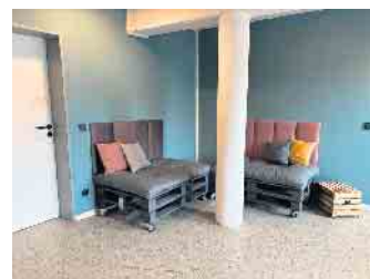
In einem Projekt wurden die Möbel für den Jugendtreff selbst gebaut.

„In den Kindergruppen machen wir viele Bastelangebote und in den Jugendgruppen gibt es einen Schwerpunkt des gemeinsamen Kochens“, erklärt Jugendtreffleiterin Sievers. Zusätzlich unterstützt wird die Kinder- und Jugendarbeit von einem ehrenamtlichen, sechsköpfigen Betreuerteam der Kirchengemeinde. Auch das ist ein weiterer Vorteil der Kooperation mit der Kirchengemeinde, den es bei einem rein städtisch organisierten Angebot so nicht gäbe.