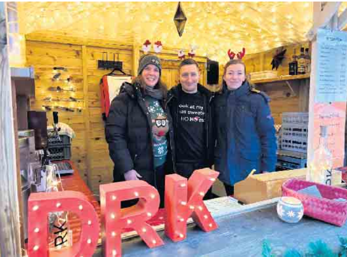
Auf heiße weihnachtliche Getränke dürfen sich die Besucher beim Stand der Ortsgruppe des Roten Kreuzes freuen

Advent, Advent ein Lichtlein brennt und in Bad Driburg findet traditionell an diesem ersten Wochenende in der Weihnachtszeit der Bad Driburger Adventsmarkt statt. Schön dekorierte Buden, aus denen es herrlich nach Bratäpfeln, gebrannten Mandeln und Glühwein duftet, stimmungsvoll angestrahlte Fassaden sowie zauberhafte Weihnachtsmusik unter dem großen Tannenbaum zaubern vom 27. bis 30. November weihnachtliches Flair in Bad Driburgs Innenstadt. Rund 30 Aussteller bieten allerhand Leckereien, Kunsthandwerk und Selbstgemachtes an und laden zum vorweihnachtlichen Bummel und gemütlichen Beisammensein ein.