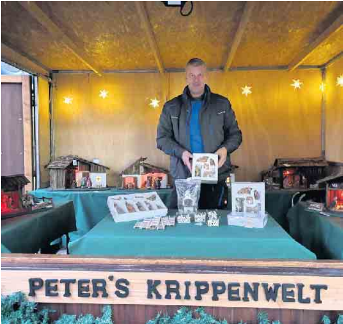
Bei Peter's Krippenwelt gibt es wunderschöne Weihnachtskrippen und Zubehör.