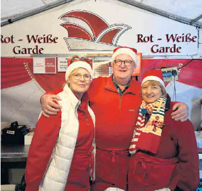
Die Rot-Weiße-Garde lädt wieder zu deftigen Speisen und weihnachtlichen Getränken ein