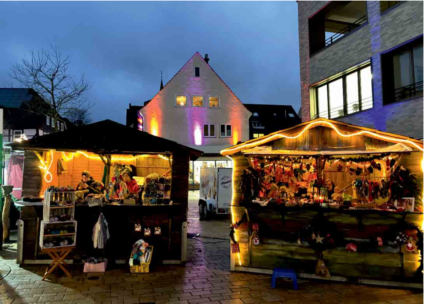
Gemütliche Buden mit Kunsthandwerk und Selbstgemachtem laden zum Bummeln ein

Laternenenumzug am Freitag, um 16.30 Uhr, mit Treffen des Weihnachtsmannes, verkaufsoffener Sonntag von 13 bis 18 Uhr, Verkauf der limitierten Weihnachtsbaumkugeln 2025