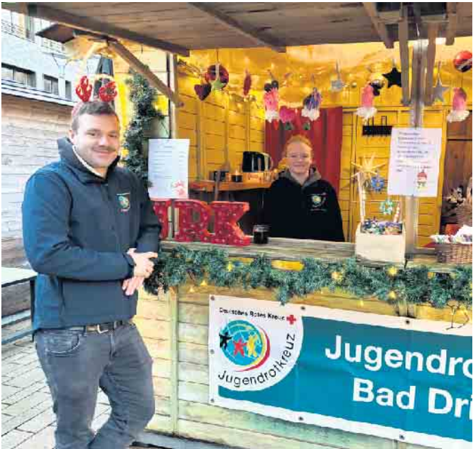
Leckere Waffeln, Kaffee, Tee und Schokolade und weihnachtliche Basteleien bietet das Jugendrotkreuz in diesem Jahr wieder an

Mit der Dämmerung wird Bad Driburgs Innenstadt an diesem Wochenende in ein stimmungsvolles Licht getaucht, aber die Kinderaugen bringt der Weihnachtsmann am Freitag zum Leuchten. Am 28. November startet um 16.30 Uhr der alljährliche Laternenumzug an der Katholischen Kirche St. Peter und Paul