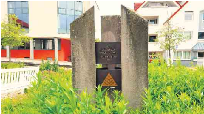
Dreisäulenstein erinnert an Deutschen Wandertag 1981 in Bad Driburg

Im November jährt sich die Aufstellung des Dreisäulensteins auf dem Rathausplatz zum 25. Mal. Das ist ein schöner Anlass, an seine Entstehung und Symbolik zu erinnern. Der Dreisäulenstein wurde am 18. November 2000 feierlich eingeweiht. Anlass war das 100-jährige Bestehen des Eggegebirgsvereins (EGV). Der Gedenkstein erinnert an das Wirken des Vereins sowie an die Deutschen Wandertage der Jahre 1981 und 1998, die in Bad Driburg stattfanden und vom EGV ausgerichtet wurden.