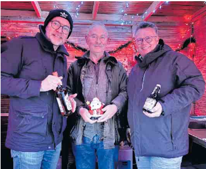
Beliebter Treffpunkt - der Stand der Bürgerschützengilde