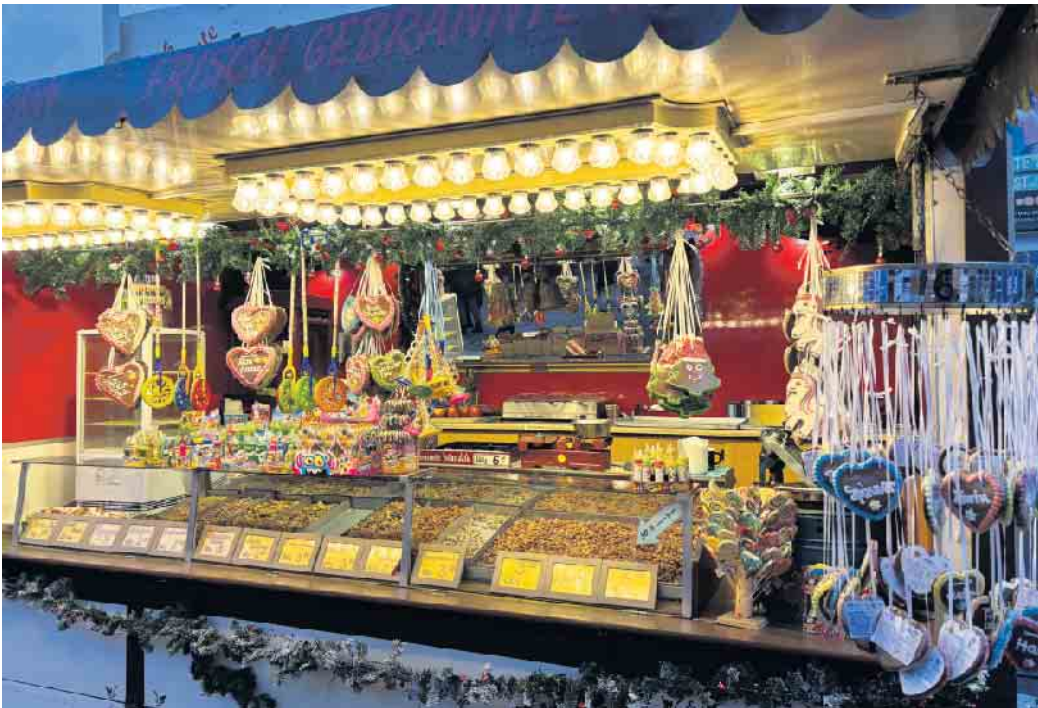
Der Duft nach gebrannten Mandeln gehört zum Bad Driburger Adventsmarkt wie Reibekuchen und Bratwurst.

ist klar: Wer lokal einkauft, stärkt nicht nur die Innenstadt, sondern trägt auch aktiv dazu bei, dass Bad Driburg lebendig, bunt und attraktiv bleibt. Gerade in der oft hektischen Vorweihnachtszeit soll der Adventskalender dazu einladen, bewusst durch die Stadt zu schlendern und dabei immer wieder etwas Neues zu entdecken. Der digitale Adventskalender mit allen Aktionen ist ab sofort auf der Homepage des Werberings abrufbar www.werbering-bad-driburg.de und verrät, was für tolle Aktionen sich hinter jedem Türchen verstecken. Mit dem Bad Driburger Adventskalender möchte der Werbering nicht nur den lokalen Handel stärken, sondern auch ein Zeichen für Zusammenhalt, Kreativität und Lebensfreude setzen. Oder, wie es das Vorstandsteam sagt: „Ein Adventskalender, bei dem nicht nur Türchen aufgehen - sondern auch Ladenlokale, Herzen und Begegnungen.“ Die Werbering-Fachgeschäfte sind dabei und freuen sich auf viele Besucher: 1 / Bad Driburger Touristik 2 / BeSte Stadtwerke 3 / Goeken backen 4 / Beauty and Care 5 / Bad Driburger Naturparkquellen 6 / Landfuxx Cerny 7 / Weinglas 8 / SalzGrotte 9 / City Fitness 10 / Buchhandlung Saabel 11 / Eilebrecht Inneneinrichtung 12 / AXA Franz Streitbürger 13 / Leder Gocke 14 / Bauer Peine 15 / Andreas Holzinger 16 / Teamgeist Werbung 17 / SiG feine Wäsche 18 / Augenoptik Cyrkel 19 / Lotto-Press-Tabak Krüger 20 / Manifattura 21 / City Fitness 22 / AMD Möbel 23 / Augenoptik Cyrkel 24 / Getränke Kriegesmann