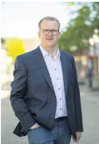
Bürgermeister Tobias Tölle

Zusammen mit der neuen Stadtbücherei, in der es seit der Neueröffnung ein umfangreiches Kreativ-, Spiel- und Vorlese-Angebot gibt sowie auch mit den regelmäßigen Bewegungsangeboten wie dem „Open Sunday“ der Gesamtschule in unserer Großturnhalle und verschiedenen weiteren Indoor-Angeboten, zu denen seit November auch der Wasserpark im Hallenbad zählt, haben wir mittlerweile ein interessantes Freizeitangebot für Kinder und Jugendliche in Bad Driburg auch in der dunklen Jahreszeit. Alle Informationen dazu finden Interessierte auf der Homepage der Stadt unter www.bad-driburg.de/erlebnisangebote