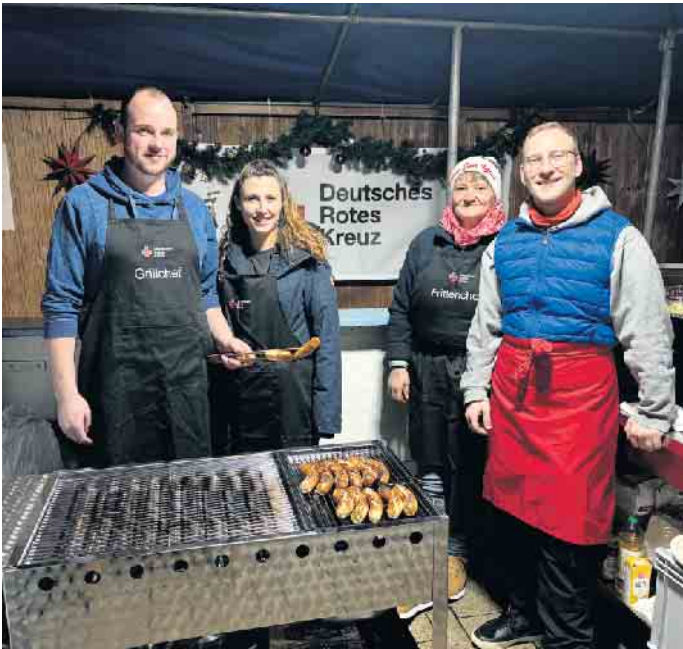
Die Ortsgruppe des Deutschen Roten Kreuzes bietet wie bereits im vergangenen Jahr auf dem Adventsmarkt leckere Bratwurst an