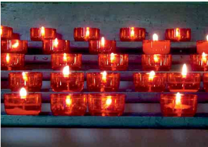
Trauer beim TV „Jahn“ Bad Driburg