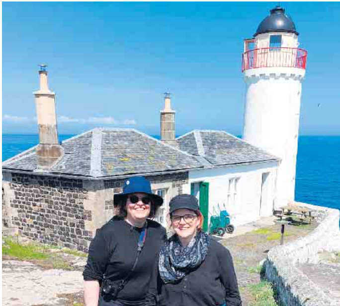
Die Autorinnen am Originalschauplatz in Schottland.