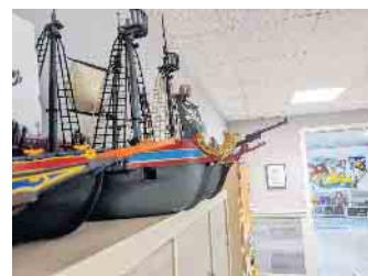
Der Kindertreff in der Alleestraße hat ein großes Spieleangebot. Es wird aber auch viel gebastelt.