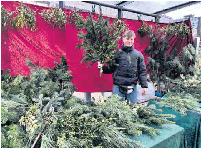
Auch Tannen und Misteln werden zum Kauf angeboten und verbreiten stimmungsvollen Weihnachtsduft

und geht von dort über den Hellweg zum Leonardo-Brunnen und dann über den Adventsmarkt zur großen Tanne. „Hier wartet der Weihnachtsmann auf die Kinder, der leckere Stutenkerle verteilt