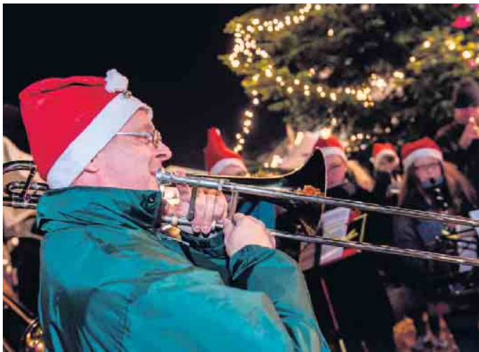
Die Stadtkapelle Bad Driburg sorgt für die passende musikalische Untermalung auf dem Bad Driburger Adventsmarkt.

und gerne auch Wunschzettel in Empfang nimmt“, verrät Andrea Gründer von der Bad Driburger Touristik GmbH. Begleitet wird der Umzug von der Jugendfeuerwehr und der Stadtkapelle Bad