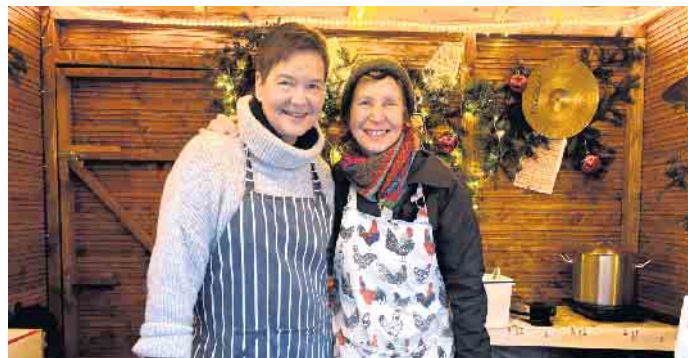
Leckere Waffeln, Glühwein und Kinderpunsch gibt es beim Stand der Stadtkapelle Bad Driburg