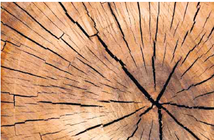
Das Holz wird in 3-5 Meter-Längen zur Verfügung gestellt.

erklärt Keuthen. Verkauft werden überwiegend Buche und Esche. Der Revierleiter bearbeitet gerne alle Anfragen vorzugsweise schriftlich unter E-Mail: frank.keuthen@gemeindeforstamt.de (bitte jeweils mit Angabe der gewünschten Holzmenge und aller Kontaktdaten wie Name, Anschrift und Telefonnummer) oder Tel. 0151 67 97 3380. Der Bestellzeitraum beginnt ab sofort und endet am 31. Dezember 2023. Brennholz Selbstwerber haben die Möglichkeit Kronenholz entlang der Waldwege aufzuarbeiten und können sich ebenfalls gerne melden.