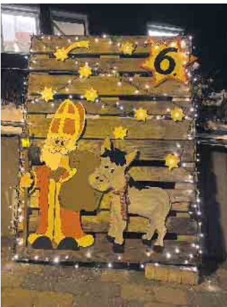
Nikolaustürchen aus dem Jahr 2022.