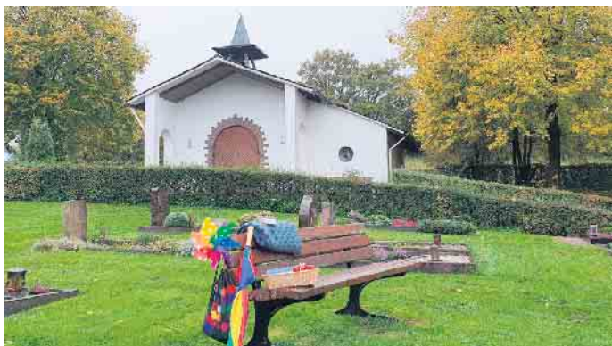
Auf dem Friedhof in Pömbesen. Schon von weitem sind der bunte Rucksack, die Windmühle und der Regenbogen-Regenschirm auf der Bank zu sehen.