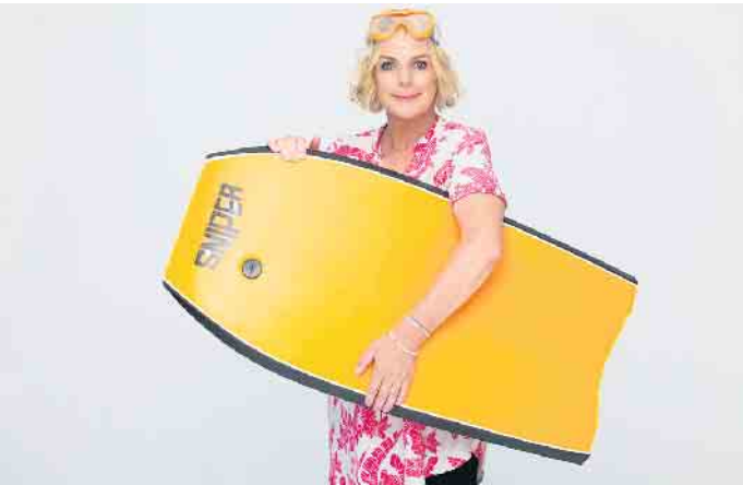
Comedy-Queen Mirja Boes wird im Herbst 2024 bereits zum zweiten Mal in der besonderen Clubatmosphäre zu Gast sein.