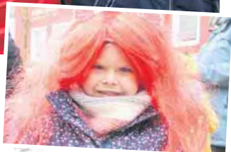
Mit einem fröhlichen Kinderkarneval in der Innenstadt startet die Bad Driburger Karnevalsgesellschaft in die neue Session.