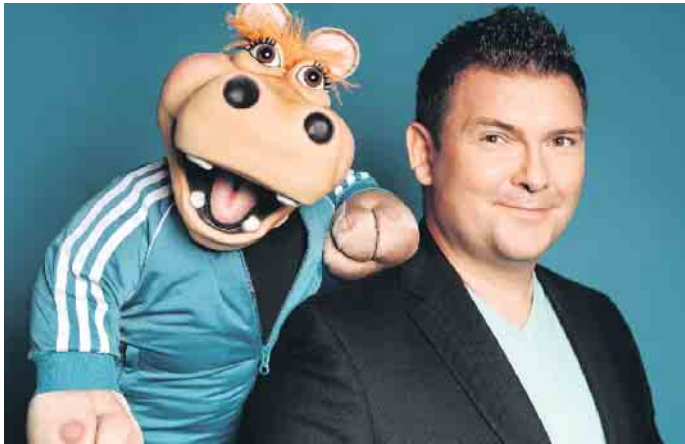
Auch Sebastian Reich und Nilpferd-Dame Amanda sind gespannt auf ihr Publikum in der Badestadt.