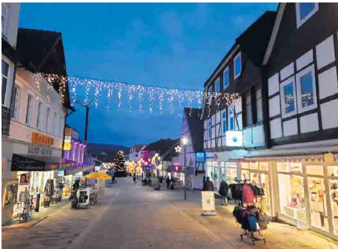
Am verkaufsoffenen Sonntag laden die Geschäfte von 13 bis 18 Uhr zum weihnachtlichen Bummeln ein.

Höhepunkt des Adventsmarktes ist für viele Kinder der alljährliche Laternenumzug. Traditionell treffen sich die Kinder am Freitag um 16.30 Uhr mit ihren leuchtenden Laternen an der Kirche St. Peter und Paul und gehen gemeinsam zum Adventsmarkt, wo der Weihnachtsmann vor der großen Tanne mit einer Überraschung auf sie wartet und ihre Wunschzettel in Empfang