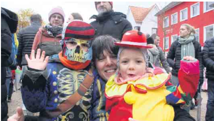
Viele Kinder haben sich zum Karnevalsauftakt fantasievoll kostümiert.