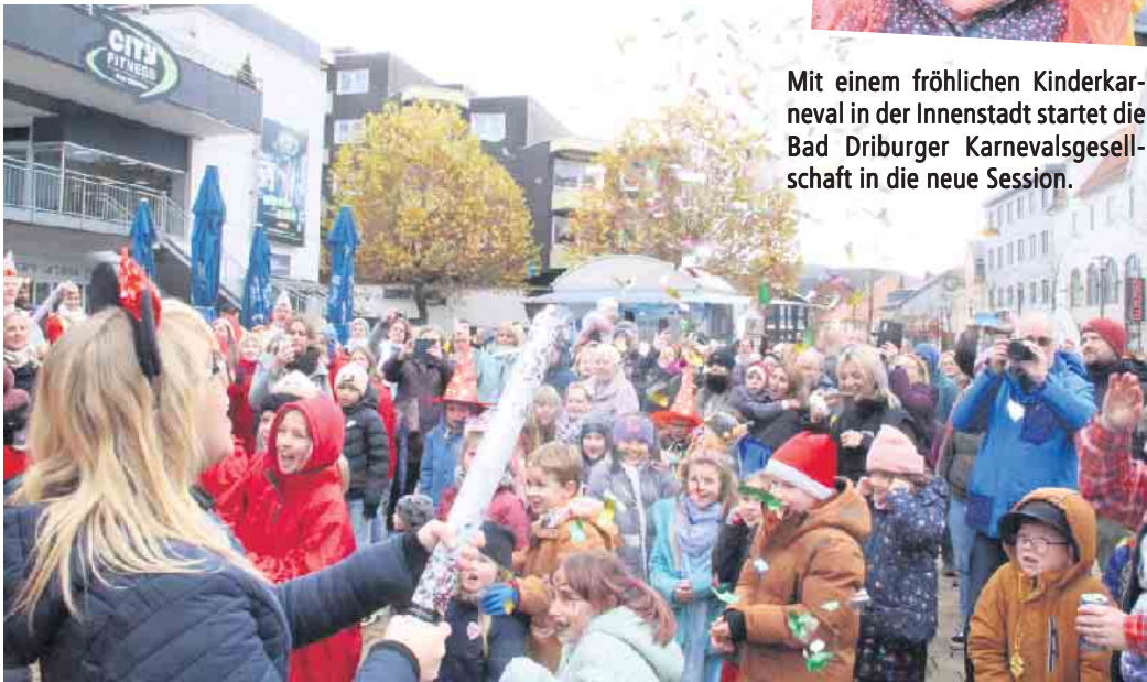
Mit Konfettiregen startet die Bad Driburger Karnevalsgesellschaft in die fünfte Jahreszeit.