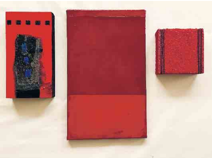
Konstruktive Kunst.

Der Verein für Konstruktive Kunst e.V. stellt ab Samstag, 25. November, wieder aus. Die Ausstellungseröffnung findet an diesem Tag von 14 Uhr bis 16 Uhr am Hellweg 21 in Bad Driburg statt. 15 Jahre nach einer gemeinsamen Ausstellung in der Galerie