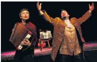
Royal Squeeze Box.

für das leibliche Wohl bestens gesorgt sein. Der Vormittag wird abgerundet durch eine vielfältige Auswahl an Weinen und kulinarischen Spezialitäten, die für eine angenehme, zünftige Atmosphäre sorgen werden. Karten gibt es auf dem Bad Driburger Adventsmarkt am Glühweinstand der Driburger Lions, bei der Touristik GmbH, Lange Straße 140, Telefon (05253) 98940, in der Buchhandlung Saabel, Lange Straße 86, Telefon (05253) 4596. Bei Fragen senden Sie bitte eine E-Mail an ticket@kulturfruehschoppen.de .