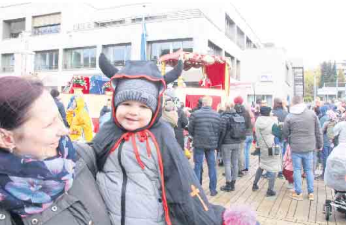
Mit einem fröhlichen Kinderkarneval in der Innenstadt startet die Bad Driburger Karnevalsgesellschaft in die neue Session.