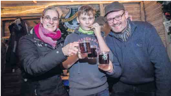
Auch in diesem Jahr mit dabei: Die Stadtkapelle Bad Driburg, die Freitag und Sonntag für musikalische Unterhaltung sorgt