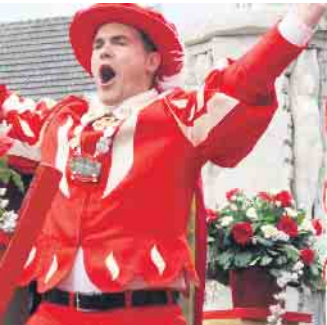
Der Hoppeditz steigt aus seine Kiste. Jetzt kann es losgehen.