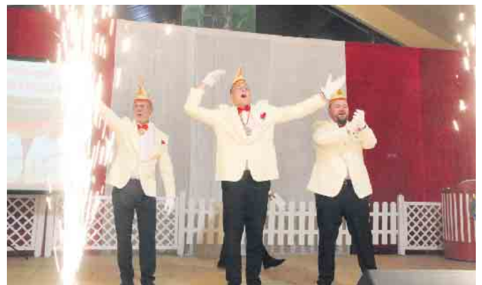
Pyrofontänen und Jubel für das Bad Driburger Dreigestirn.