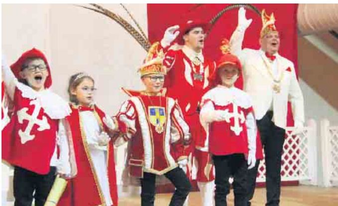
Die Bad Driburger Karnevalsgesellschaft Rot-Weiße Garde startet in die neue Session.