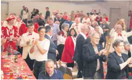
Tolle Stimmung in der Bad Driburger Schützenhalle zum Sessionsbeginn der Karnevalsgesellschaft Rot-Weiße Garde, Bad Driburg.

Ein Dreigestirn steht stattdessen an der Spitze der Karnevalsgesellschaft Rot-Weiße Garde