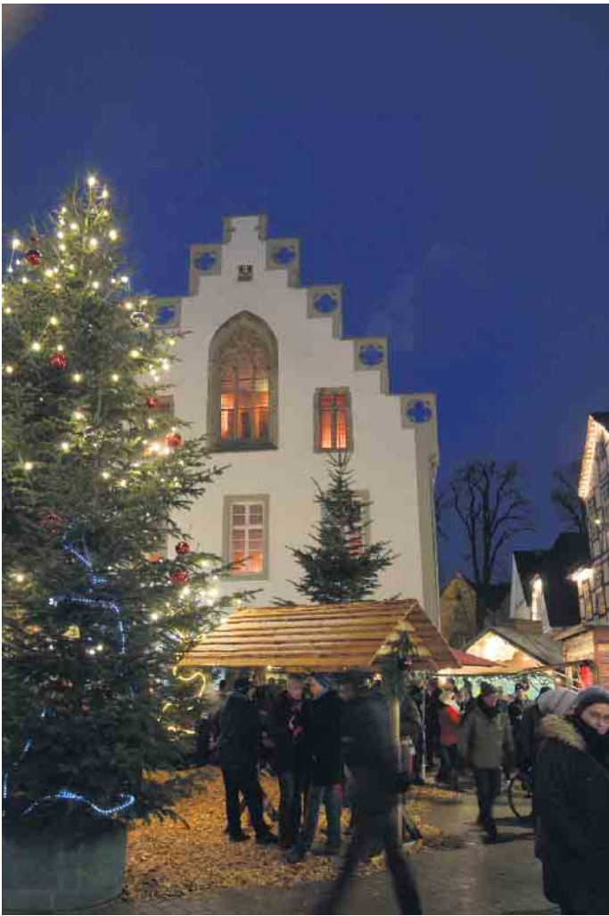
Die gemütlichen Verkaufshütten laden zum Bummeln und Verweilen ein