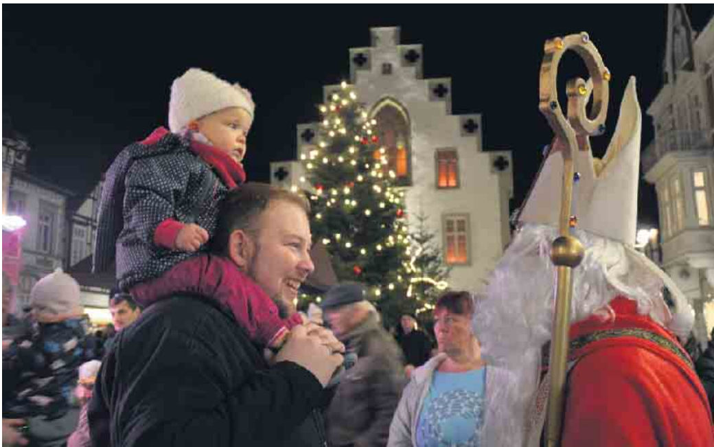
Am Donnerstag stehen die Kinder im Mittelpunkt, der Nikolaus verteilt Stutenkerle