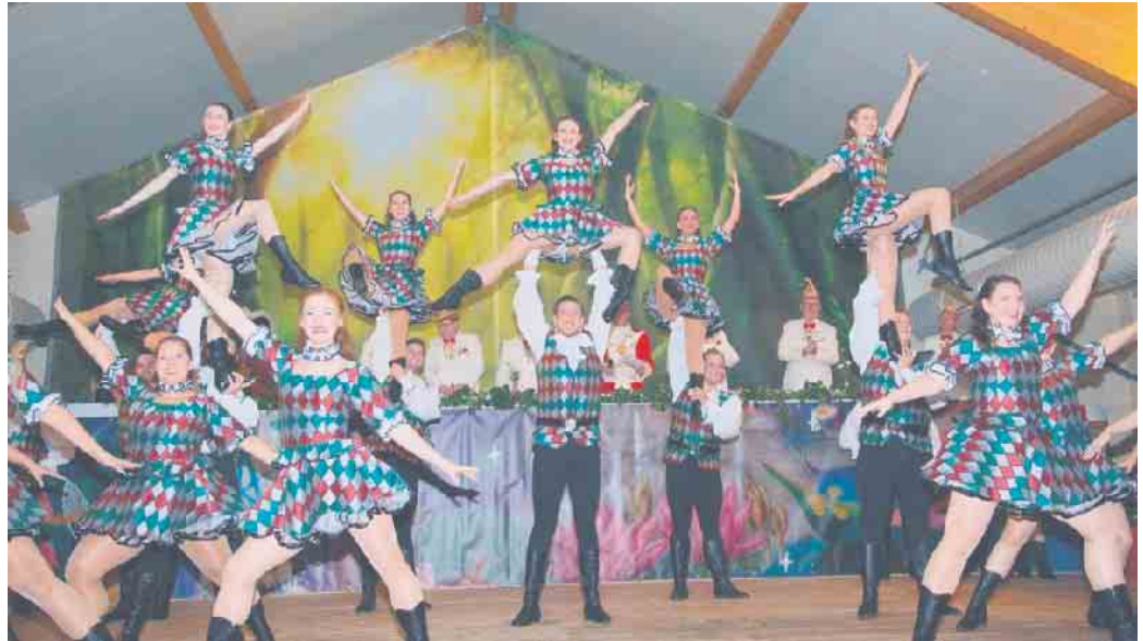
Die Kölischen Harlequins der Karnevalsgesellschaft Alt-Köllen von 1883 e.V. beeindruckten mit ihrem akrobatischen Talent.

Die aktuelle Karnevalszeitung „Narrenfreiheit“ liegt ab sofort unter anderem in den Rewe-Märkten Lars Markus, Vereinigte Volksbank, Volksbank Höxter, Sparkasse Höxter sowie der Bad Driburger Touristik GmbH zur Abholung bereit.