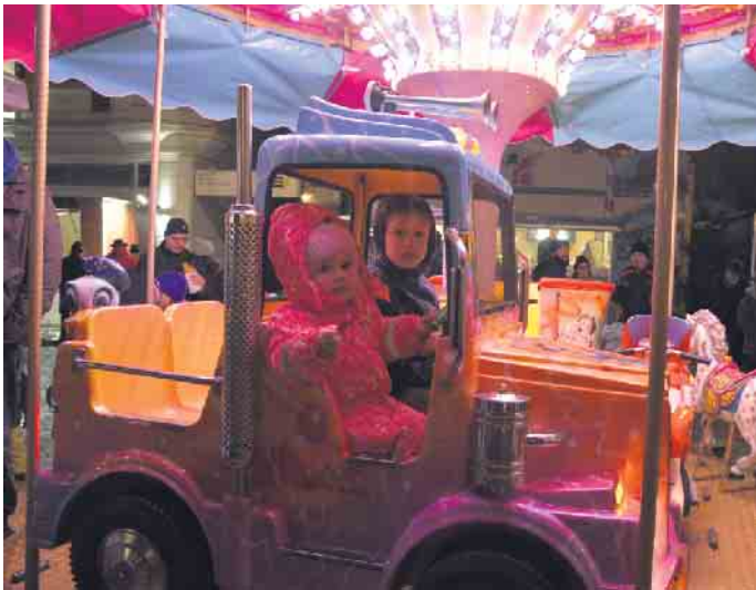
Zur Freude der kleinen Besucher bietet der Nikolausmarkt auch ein Kinderkarussell