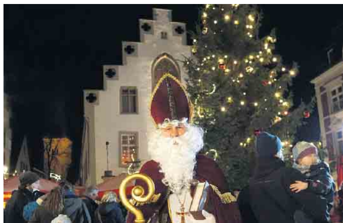
Der Nikolaus eröffnet den Brakeler Nikolausmarkt wieder traditionell am Donnerstag, 1. Dezember