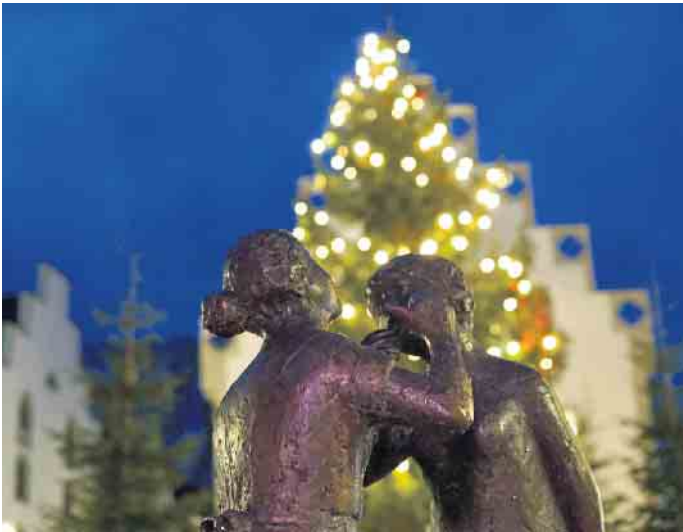
Der heimelige Nikolausmarkt findet auf dem Brakeler Marktplatz statt

wieder auf die Gewinner. Für die Stärkung, nicht nur der Sportler, ist natürlich vorgesorgt. So kann zwischen den Spielen die ein oder andere Piz- za, Bratwurst oder Reibekuchen