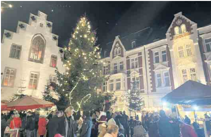
Viele große und kleine Besucher waren zu Gast beim Nikolausmarkt im vergangenen Jahr