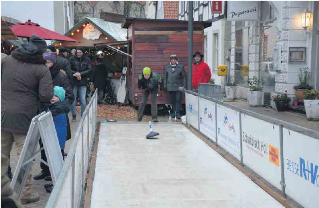
Der sportliche Vergleich steht beim traditionellen Eisstockschießen im Vordergrund

Geöffnet ist der Nikolausmarkt täglich ab 15 Uhr. Der Sonntag, 4. Dezember, ist zudem von 13 bis 18 Uhr verkaufsoffen.