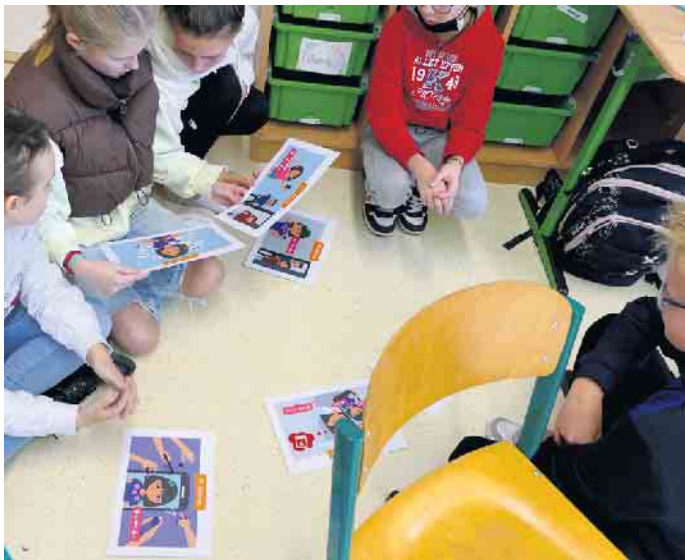
Auf Basis einer Bildergeschichte zu sozialen Medien wurde die Frage „Ab wann ist man süchtig?“ anschaulich diskutiert.

Die Schülerinnen und Schüler sollen dadurch in die Lage ver- setzt werden, mögliche Gefah- ren auf diesem Gebiet zu er- kennen, ihr eigenes Handeln, wenn nötig, dementsprechend zu überdenken und den posi- tiven Sinn von elterlichen Regeln wie zum Beispiel Bildschirmzei- ten zu erkennen.