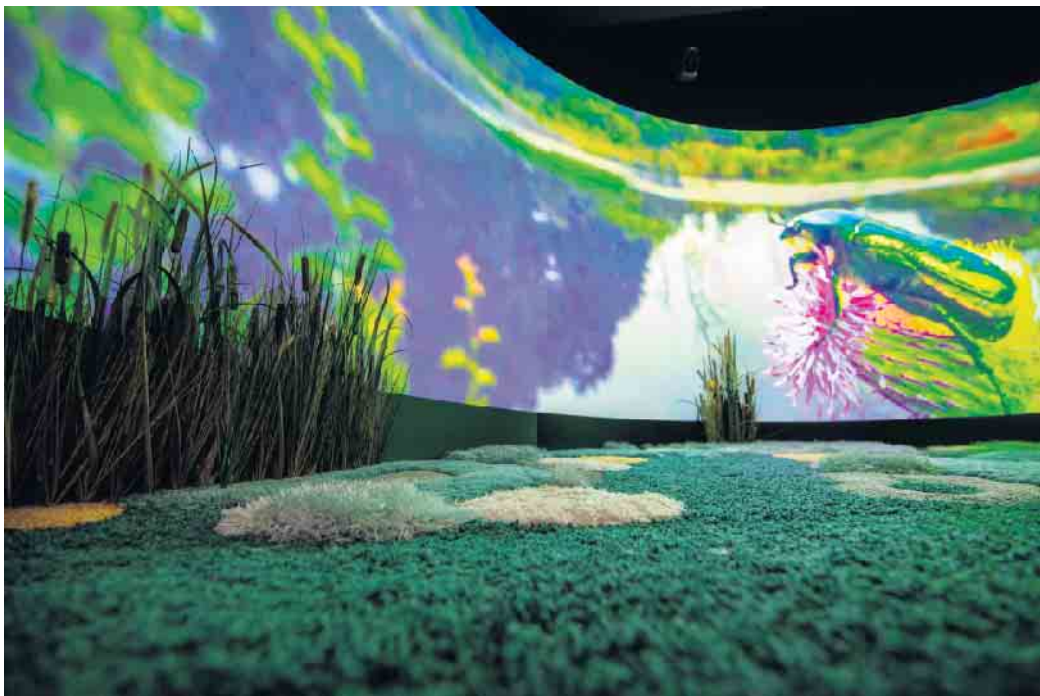
Der Kurzfilm „Sommer im Moor“ zeigt atemberaubende Bilder vom heimischen Naturschutzgebiet „Saatzer Moor“

Naturmoor-Wärmflasche. Die Moorerlebniswelt ist fast täglich geöffnet, und zwar Montag bis Freitag von 10 bis 17 Uhr sowie Samstag und Sonntag von 11 bis 17 Uhr. Nur an einigen Fest- und Feiertagen ist sie geschlossen. Diese Sonderöffnungszeiten werden auf der Homepage www.moorerlebniswelt.de veröffentlicht. Letzter Einlass ist jeweils um 16 Uhr. Am 2. Weihnachtsfeiertag freut sich die neue Erlebnisausstellung ebenfalls auf Besucher. Am 24. und 25. Dezember sowie am 31. Dezember und 1. Januar bleibt sie hingegen geschlossen. Der Eintritt ist frei.