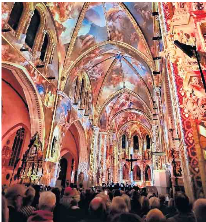
Luminiscene im Dom zu Münster. Spektakuläre Lichtszenen verzaubern die Besucher.

Weitere Informationen unter www.probarrierefrei.de oder telefonisch unter 015112483764.