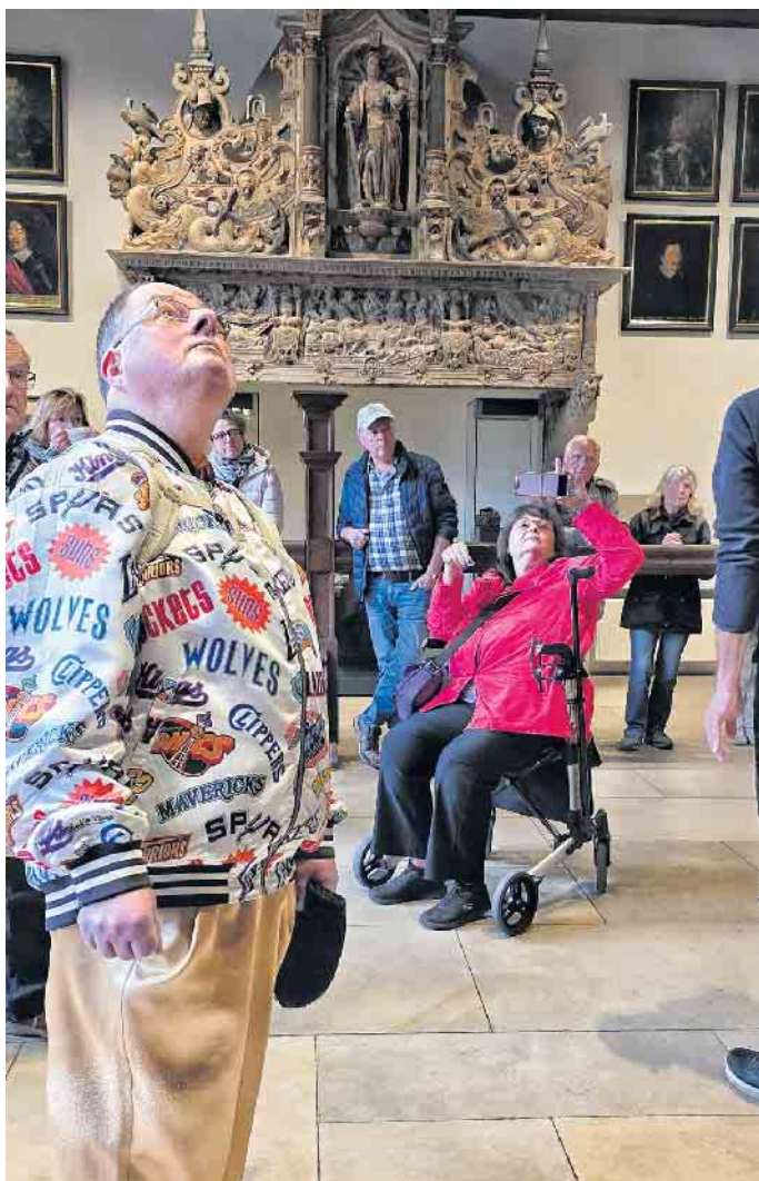
Der Besuch im Friedenssaal war ein Muss

Die Führung durch das historische Rathaus mit dem beeindruckenden Friedenssaal war ein Höhepunkt. Hier erfuhren alle mehr über die bewegte Geschichte Münsters und das „goldene Huhn“ als Symbol des Friedens. Am Abend begeisterte die Lichtshow „Luminiscene“ im Dom: Eine eindrucksvolle Inszenierung zur Geschichte des Domes und der Stadt. Der lange Applaus sprach für sich. Beim anschließenden Ausklang im Marktcafé wurde der