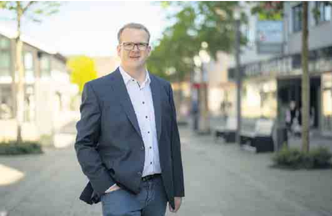
Bürgermeister Tobias Tölle