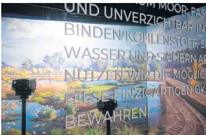
Die Bedeutung der Moore für unser Ökosystem erfahren die Besucher der Moorerlebniswelt im Raum „Moor lebt Wasser“.