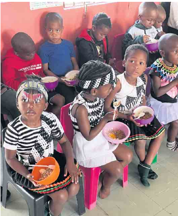
Auch für den Kindergarten in Vulingqondo finanziert Yebo das Mittagessen

zu unterstützen. Freiwillige backen, stricken, basteln oder nähen eifrig und fertigen schönes und leckeres für die kommende Adventszeit. Bastelarbeiten aus Südafrika stehen ebenfalls bereit. Zusätzlich wird von den Grundschülern noch ein Flohmarkt veranstaltet. Die Kinder bieten eigenes Spielzeug zum Verkauf an um zum Erlös des Basars beizutragen. Auch für das leibliche Wohl wird gesorgt. Von Kaffee und selbstgebackenem Kuchen im Schulgebäude bis zu Getränken und