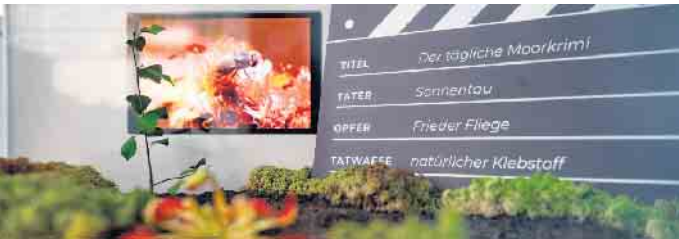
Den täglichen Moorkrimi können Besucher im Moorlabor beobachten.

Ein toller neuer Ort zum Staunen in Bad Driburg feiert seinen ersten Geburtstag