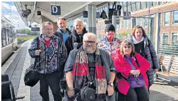
Ankunft in Münster

Die Anreise nach Münster verlief reibungslos, und bereits beim Einchecken im Hotel wurden die Teilnehmenden herzlich empfangen, sogar mit einem heißen Getränk zur Begrüßung. Das Hotel erwies sich als freundlich und serviceorientiert, auch wenn die Zimmer etwas eng waren.