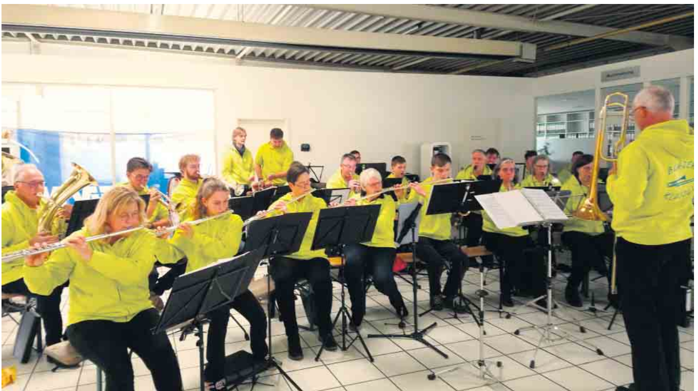
Musiker umrahmten die Bucherbörse mit stimmungsvollen Klängen.