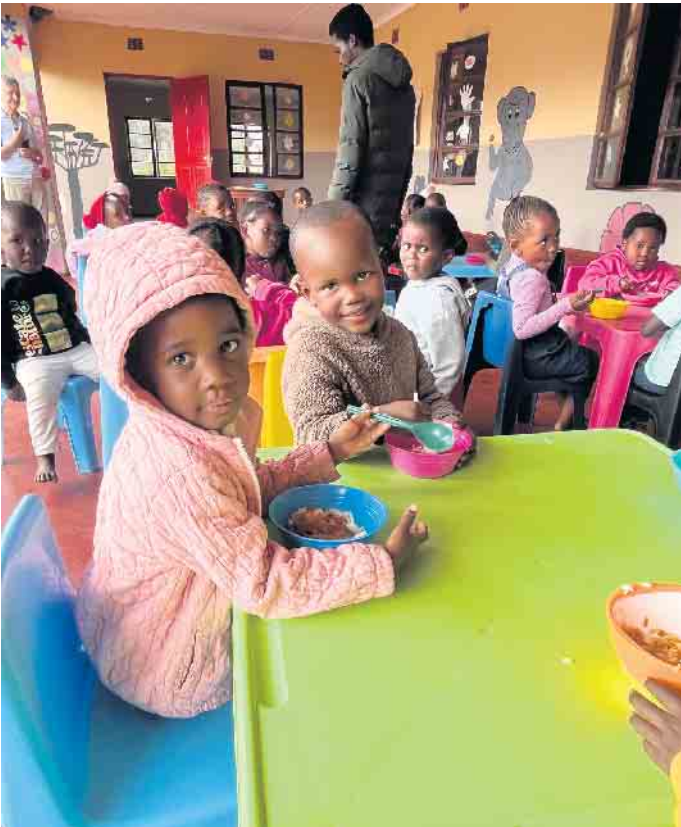
Im Kindergarten von Dumayo. Das Mittagessen ist oft die einzige tägliche warme Mahlzeit für die Kinder.

Der Adventsbasar öffnet wieder seine Tore in der Dringenberger Grundschule am Sonntag, 23. November, von 14 bis 17 Uhr. Der Erlös geht an die Yebo Zululand Initiativen zur Finanzierung der Mahlzeiten in zwei Kindergärten in KwaZulu-Natal in Südafrika - für die Kinder oftmals die einzige warme Mahlzeit des Tages. Wieder tragen viele Engagierte zum Gelingen des Basars bei. Auch in diesem Jahr findet zu dieser Veranstaltung wieder ein Lichterlauf der Schulkinder statt um über die gesammelten Sponsorengelder