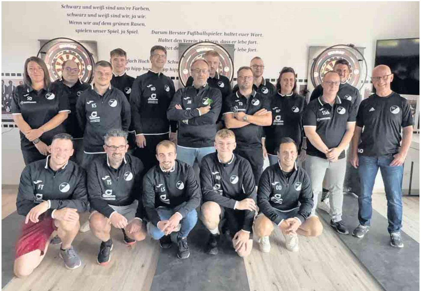
Die Mannschaft der Dartsabteilung des SV13 Herste

Was mit einem spontanen Weihnachtsturnier begann, hat sich in nur einem Jahr zu einer festen Größe im Vereinsleben entwickelt: Die Dartsabteilung des SV13 Herste zählt inzwischen rund 35 Aktive und bietet zweimal wöchentlich Trainingsabende im Vereinsheim an. Die moderne Ausstattung mit drei Dartanlagen entstand durch ehrenamtliches Engagement und Unterstützung lokaler Sponsoren. Seit der offiziellen Aufnahme in den Verein wächst nicht nur die Begeisterung, sondern auch der sportliche Ehrgeiz. Der SV13 Herste meldete gleich zwei Teams für die C-Liga West 1 der Nordhessischen Dartliga. Die Erste etablierte sich schnell in der Spitzengruppe, während die Zweite mit viel Einsatz und Lernbereitschaft erste Erfolge feierte.