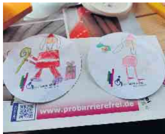
Während der Weihnachtsfeier im vergangenen Jahr