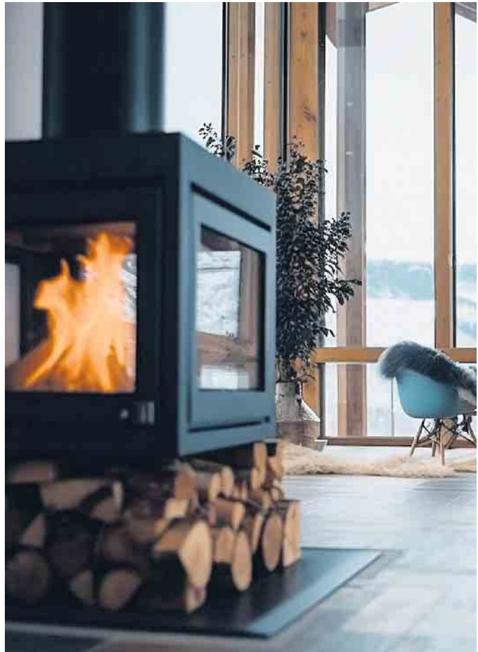
Ein Online-Seminar vermittelt „Richtiges Heizen mit Holz“.