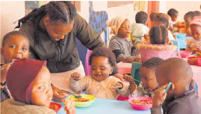
Kinder freuen sich über eine warme Mahlzeit.

und stellen Schmackhaftes und Praktisches her. Freiwillige backen, stricken, basteln oder nähen eifrig oder fertigen schmuckvolle Adventskränze und -gestecke an. Produkte aus Südafrika stehen ebenfalls bereit. Auch für das leibliche Wohl wird gesorgt. Es gibt für jeden etwas: Kaffee und selbstgebackenen Kuchen im Schulgebäude und Glühwein, Kaltgetränke und Gegrilltes auf dem Schulhof. Im Unterricht lernen die Kinder zusätzlich Wissenswertes über das Leben in Südafrika und warum es wichtig ist, Kinder zu unterstützen, die in Armut aufwachsen müssen.