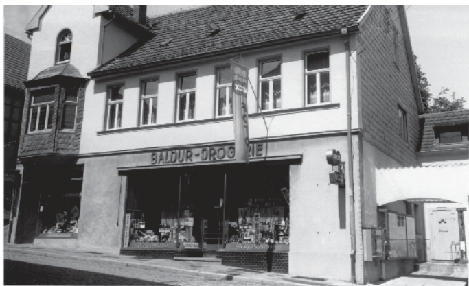
Die Baldur Drogerie Hagemann 1960 am jetzigen Standort in der Langen Straße 93.

bevolle Überraschungen bei der Jubiläumsaktion Anlässlich des 100 jährigen Bestehens findet von Montag, den 10. bis zum 18. November 2025 ein Jubiläumsverkauf statt, um den treuen Kunden für ihre Loyalität zu danken. Vor Ort erwartet die Besucher sorgfältig ausgewählte „dufte“ Angebote, liebevolle Überraschungen für Sie zusammengestellt, ein herzliches Hagemann Team und 20% Rabatt.