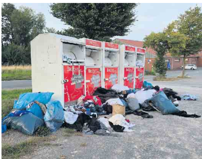
So sieht es am Altkleidercontainer am Siedlerplatz aus. Ein Teufelskreis für die Natur und eine Goldgrube für Fast-Fashion-Versender Shein.

Was können wir dagegen tun? Nicht billig kaufen, sondern nach-