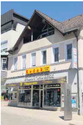
Ein Fachgeschäft im Wandel der Zeit - die heutige Baldur Drogerie Hagemann