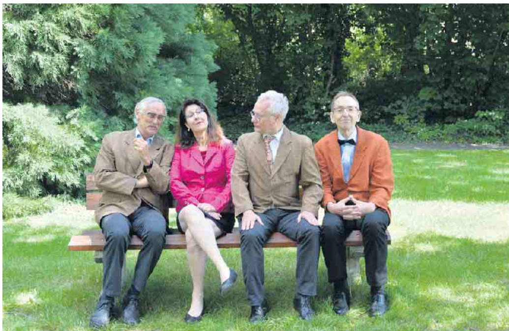
Das Lehrer-Kabarett „die daktiker“.

Unvergessenes (etwa der PISA-Schock), wie Verdrängtes (etwa Chancengerechtigkeit), Aktuelles (etwa Digitalisierung), wie Zukünftiges (etwa Inklusion)