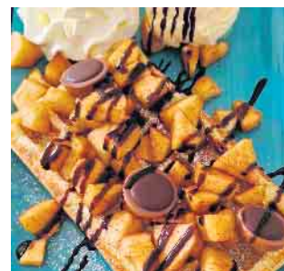
Besonders beliebt sind ihre Tageswaffeln.

Geöffnet ist das Café Handgemachtes montags bis samstags von 14.00 bis 18.00 Uhr und am Sonntag sogar von 11.00 bis 18.00 Uhr. Dienstag ist Ruhetag.