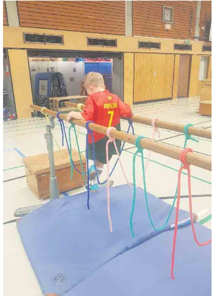
Open sunday: Hier können die Kinder vielseitige Bewegungserfahrungen sammeln.