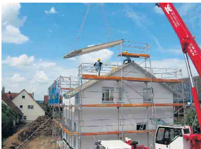
Künftig sollen die Gemeinden befristet bis 2030 unter Umständen auf Bebauungspläne verzichten dürfen