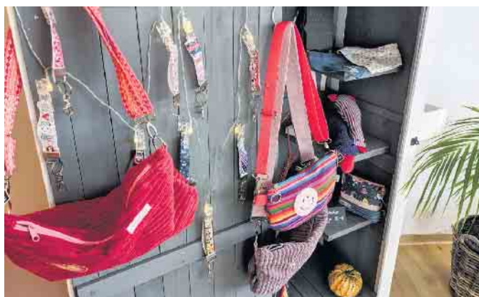
Überall im Raum finden sich ihre handgenähten Werke.