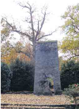
Das Ehrenmal Bad Driburg.

ten Markt“ (Lange Straße), um von dort gemeinsam zum Ehrenmal zu gehen. Alle Mitbürgerinnen und Mitbürger sind herzlich eingeladen!