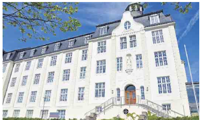
Am ersten Adventssonntag lädt das Gymnasium St. Xaver alle Interessierten herzlich zu einem „Tag der offenen Tür“ ein

che. Anschließend findet sowohl um 11.30 Uhr als auch um 14.30 Uhr eine Informationsveranstaltung in der Aula statt. Darüber hinaus demonstrieren Schüler und Lehrer in den jeweiligen Fachräumen, was das Gymnasium St. Xaver ausmacht. Für das leibliche Wohl wird im Elterncafé und in der Mensa ebenfalls gesorgt sein. So freut sich die Schulgemeinschaft des Gymnasiums St. Xaver schon jetzt, neugierigen kleinen und großen Gästen ihre Schule präsentieren zu dürfen. Herzliche Einladung dazu!