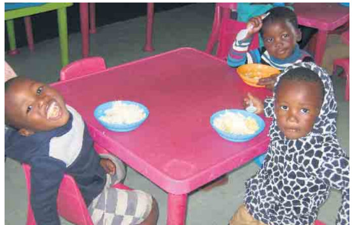
Kinder freuen sich über eine warme Mahlzeit.

kränze und -gestecke oder stellen hausgemachte Liköre her. Auch für das leibliche Wohl wird gesorgt. Es gibt für jeden etwas: Kaffee und Kuchen im Schulgebäude oder Kaltgetränke und Schmackhaftes vom Grill auf dem Schulhof. Im Rahmen des 20-jährigen Jubiläums können sich alle Besucherinnen und Besucher über die Arbeit des Vereins früher und heute informieren. Gründungsmitglieder und Aktive berichten über Vergangenes und Aktuelles aus dem Leben des Vereins. Südafrikanische Arbeiten, Ausstellungsstücke, Videos und Plakate vermitteln einen Einblick in das Leben in Südafrika. Die Kinder, Eltern, Helferinnen und Helfer und wir vom Verein freuen uns gemeinsam mit vielen Besucherinnen und Besuchern auf einen schönen Nachmittag in der Dringenberger Grundschule.