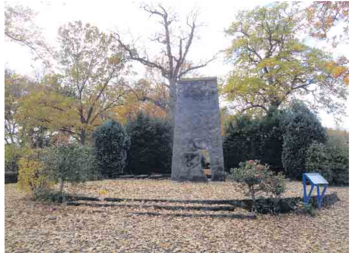
Das Ehrenmal in Bad Driburg

treter der Stadt und der Organisationen zum Gedenken Kränze niederlegen. Für den entsprechenden musikalischen Rahmen der Veranstaltung sorgt die Stadtkapelle Bad Driburg. Die Teilnehmer der Veranstaltung treffen sich um 11.30 Uhr am „Alten Markt“ (Lange Straße), um von dort gemeinsam zum Ehrenmal zu gehen. Alle Mitbürgerinnen und Mitbürger sind herzlich eingeladen.