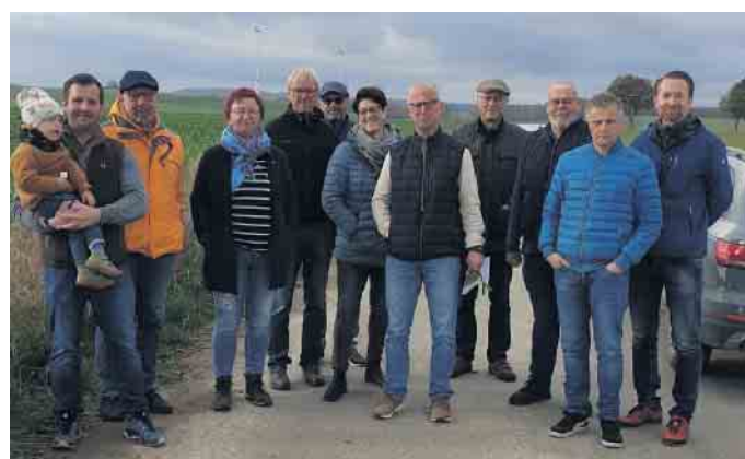
zwischen Dringenberg und Gehrden.

Nochmals Oeynhaus: „Die CDU-Fraktion ist sich der Verantwortung für eine erfolgreiche Energiewende auf kommunaler Ebene sehr bewusst. Dabei sollten die erforderlichen Eingriffe zum Schutze der Natur und der betroffenen Mitbürger nicht gänzlich außer Acht gelassen werden. Die CDU-Fraktion wird sich