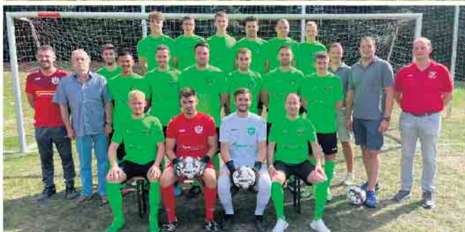
1. Mannschaft des SV Alhausen/Pömbesen mit den neuen Trikots und den Sponsoren der Firma Fliesen Brockhagen und Malerbetrieb Farbwechsel