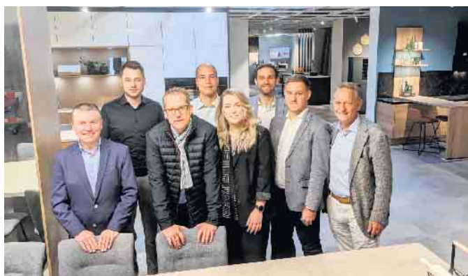
Das Team um die Geschäftsleitung freut sich auf die Neueröffnung am 4. November.

Für zehn Millionen Euro ist die ehemalige Möbelstadt zu einem der modernsten Möbelhäuser in ganz Deutschland umgebaut worden. Eröffnung ist am 4. November.