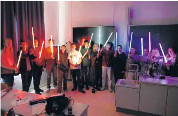
Auf die Spuren der Laserphysik begaben sich die Teilnehmer des diesjährigen MINT-EC-Camps am Gymnasium St. Xaver.