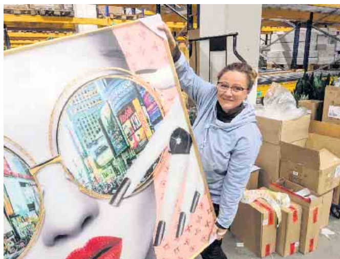
Noch ist viel zu tun: Das große Warenangebot wird ausgepackt und platziert.

Musterring, Hartmann, Decker oder Venjakob. In dem Bereich werden auch die Polstermöbel ausgestellt. Im Schlafbereich mit 2.000 Quadratmetern Fläche sind Polster- und Boxspringbetten, Schlafzimmerschränke und ein Matratzenstudio zu sehen. Angeboten wird auch eine Schlafberatung. Der Bereich Büro- und Gartenmöbel ist 300 Quadratmeter groß und soll auch durch die schnelle Verfügbarkeit der Waren überzeugen. In der neuen Gartenmöbelausstellung werden auf 500 Quadratmetern Sitz- und Lounge-möbel gezeigt. Sie sind ebenfalls sofort zum Mitnehmen oder aber können binnen der nächsten 24 Stunden nach Hause geliefert werden.