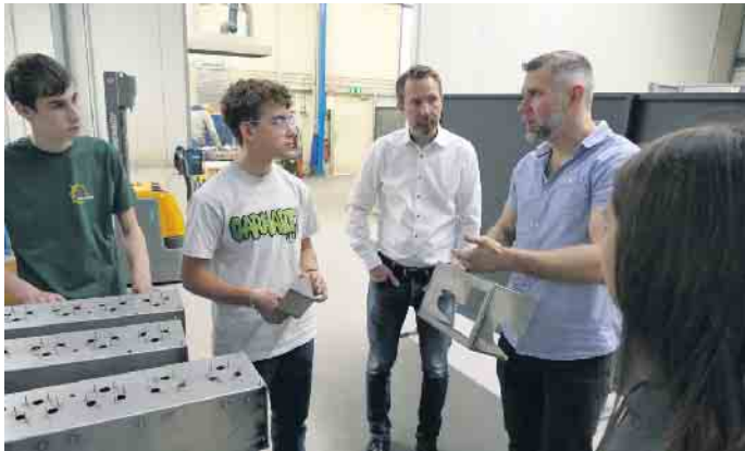
Wissenswertes erfuhren die Teilnehmer auch beim Besuch der Unternehmen Wieneke Lasergravur GmbH und Wieneke Anlagenbau und Verfahrenstechnik GmbH.