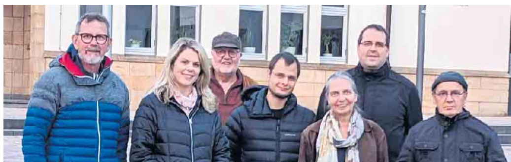
Die GRÜNE Fraktion im Rat Bad Driburg

Ende: Aus der Arbeit der Parteien Bündnis90 / Die Grünen