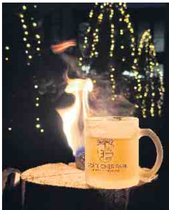
Angesagt: Neben dem klassischen Glühwein liegt heißer Aperol im Trend.

Für den kleinen und großen Hunger gibt es in der Oscars Bar, im „Caspars Restaurant“ und im Pferdestall auch ein Speisenangebot. Die Glühweinhütte ist bis zum 28. Januar 2025 im Platanenhof des Gräflichen Park Health & Balance Resort von donnerstags bis sonntags sowie an den Feiertagen geöffnet. Öffnungszeiten Glühweinhütte: Donnerstag bis Samstag: 16.30 bis 20.30 Uhr Sonntag: 14.30 bis 19 Uhr Feiertag (24. bis 26. Dezember): 14 bis 18 Uhr 31. Dezember und 1. Januar 2025: 14 bis 18 Uhr Bei schlechter Wetterlage oder großem Andrang können die Öffnungszeiten entsprechend verkürzt oder verlängert werden. Weitere Informationen unter www.graeflicher-park.de .