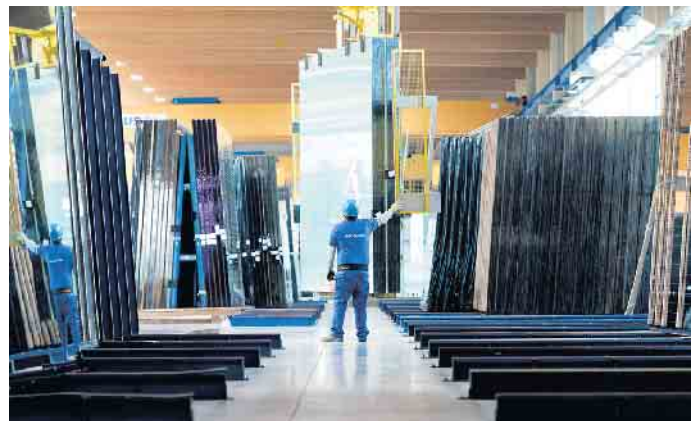
Der natürliche Werkstoff Holz, computergestütztes Handwerk sowie serien- und maßgefertigte Produkte, von denen die gesamte Wirtschaft profitiert - dies erwartet die Auszubildenden in der Holzpackmittelindustrie.