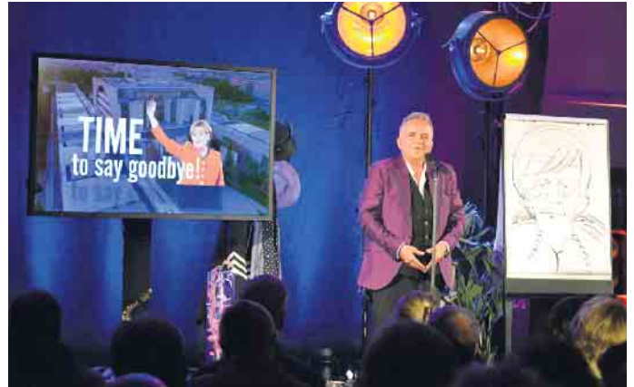
Ode an Angie: Mit Karikatur und Kanzlerinnen-Raute verabschiedete Jörg Knör Altbundeskanzlerin Angela Merkel in den wohlverdienten Ruhestand.