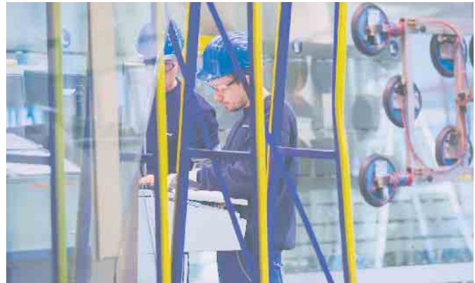
In der Holzpackmittelindustrie werden alltägliche Produkte, aber auch besonders große, schwere und empfindliche Güter sicher verpackt.

„Darüber hinaus können alle Teilnehmer den Staplerschein machen. Damit kann man in unserer Branche flexibel und in vielen Bereichen arbeiten“, erklärt der Packmittelexperte abschließend. „Neben technischen Schulungsinhalten wird auf die Vermittlung der eigenen Qualitätsstandards und Richtlinien geachtet sowie der Umgang mit dem Branchen-Softwarepaket PALLET-Express zur 3D-Konstruktion und statischen Berechnung von Paletten erlernt. In dem Lehrgang erfahren angehende Holzmechaniker alles, was sie als erfolgreiche Verpacker in der HPE-Branche später brauchen.“