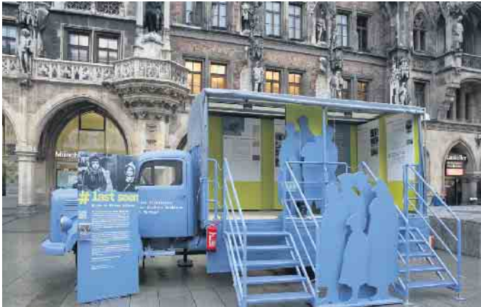
Ausstellungseröffnung in München am 20. Januar 2022 auf dem Marienplatz.

Ausstellung #Last Seen vom 11. bis 23. November in Bad Driburg und Neuenheerse