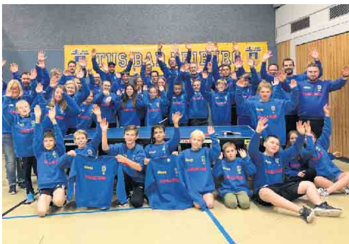
TuS Bad Driburg - Tischtennisabteilung

Modehaus Maas und Table Roc konnte für alle aktiven Mitglieder ein neuer TuS-Pulli angeschafft werden.