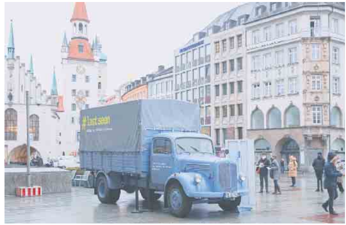
Der historische LKW in München am 20. Januar 2022 auf dem Marienplatz.

Öffnungszeiten #Last Seen: 11. bis 20. Nov. in Bad Driburg Fußgängerzone und 21. bis 23. Nov. in Neuenheerse Parkplatz St. Kaspar täglich von 9 bis 18 Uhr Der Eintritt ist frei.