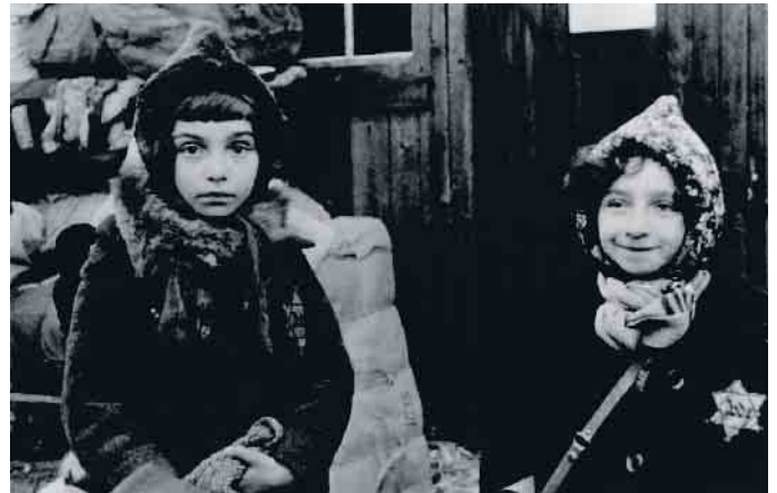
Spurensuche: Diese beiden noch unbekanntes Mädchen wurden am 20. November 1941 aus dem Lager Milbertshofen bei München nach Kaunas (Kowno) im besetzten Litauen deportiert und dort ermordet.

Vernichtungslager Bezug. Am 11. November um 15 Uhr wird die Ausstellung in der Fußgängerzone mit einem Rahmenprogramm eröffnet. Bis zum 20. November besteht täglich von 9 bis 18 Uhr die Möglichkeit eines Besuches. Vor Ort kümmert sich die Projektgruppe „denk-mal Bad Driburg“ um die