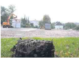
Auf der Achse zwischen Eggeland-Bestandsgebäude und der Vitalklinik soll das neue Appartementhaus der Lebenshilfe entstehen.