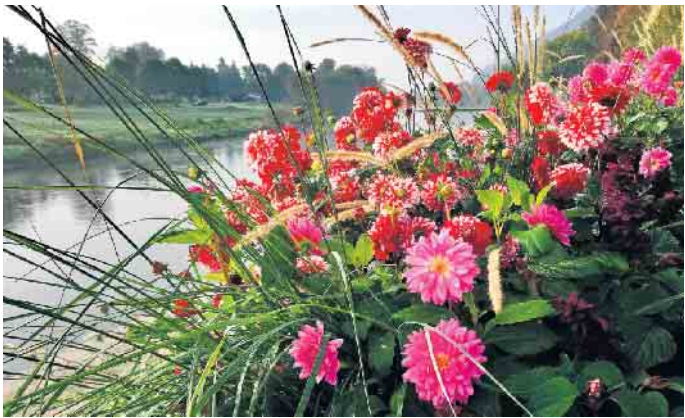
Herbstimpressionen aus Höxter