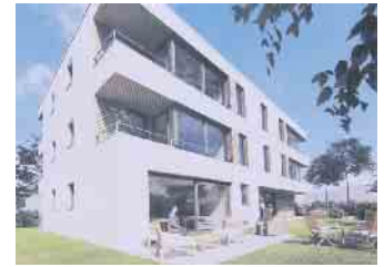
So soll das neue Haus der Lebenshilfe aussehen.

das Gebäude erhalten und einer neuen Nutzung zugeführt werden. Da ist der Wunsch der Stadt. Aber auch ein Rückbau soll möglich sein. Der Denkmalschutz wäre dann aufzuheben. Das stadt-bildprägende Gebäude von 1879 steht seit 15 Jahren leer. Eigene Pläne der Stadt zum Umbau zu einem Bürger- und Kulturzentrum sind am Geld gescheitert.