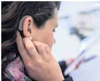
Hörbeeinträchtigungen können das Arbeitsleben erschweren - doch dafür gibt es Lösungen.

ihnen gut qualifiziert und oft hoch motiviert sind“, berichtet er. Während des Bewerbungsprozesses sollte direkt offen und ehrlich angesprochen werden, was der jeweilige Mensch braucht. Und auch wenn eine Jobbeschreibung nicht zu 100 Prozent passt, kann sich eine Bewerbung trotzdem lohnen. „Wir sind davon überzeugt, dass ein diverses Team am leistungsfähigsten ist“, so Melzer. „Wenn Menschen mit unterschiedlichen Hintergründen und Perspektiven zusammenarbeiten, ist das doch meistens sehr fruchtbar.“ (djd)