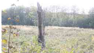
Auf einer Kalamitätsfläche im Waldgebiet Modexen sorgt die Vereinige Volksbank mit einem Mitgliederwald für die Wiederaufforstung.