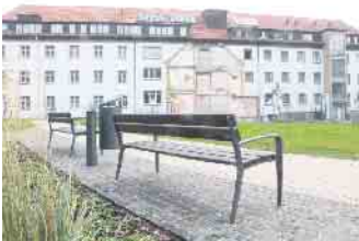
Das historische Bestandsgebäude der Eggelandklinik von 1879.