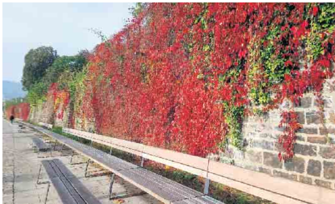
Die längste Bank in NRW an der Weserpromenade