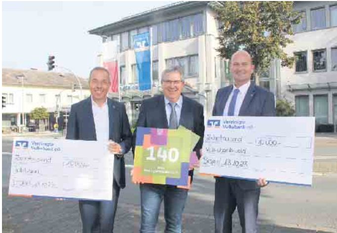
Anlässlich ihres 140-jährigen Bestehens spendet die Vereinigte Volksbank insgesamt 20.000 Euro für den Inklusionssport und die Walderneuerung.

chael Graf. Besonders stolz ist die Vereinigte Volksbank darauf, diesen Bericht auf der Grundlage des internationalen GRI-Standards (Global Reporting Initiative) erstellt zu haben. „Das ist der weltweit strengste Bilanzierungsstandard und damit sind wir unter den 737 Volksbanken bundesweit führend“, betont Bankvorstand Birger Kriwet. Die Vereinigte Volksbank ist das letzte selbstständige Kreditinstitut im Kreis Höxter. Die Volksbank hat 36.000 Mitglieder und verwaltet rund 63.000 Konten bei einer Bilanzsumme von 1,6 Milliarden Euro. „Unser Ziel ist, Nach-