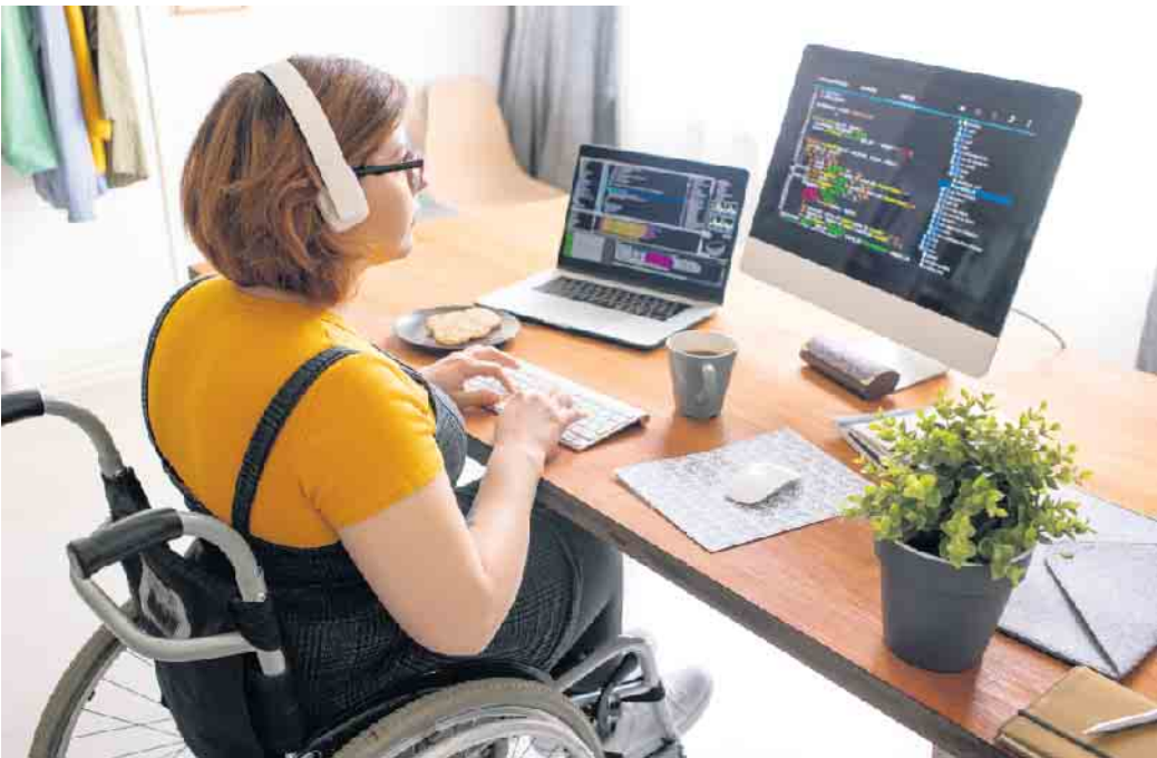
Menschen mit Behinderung können im Job genauso glücklich werden wie Nicht-Behinderte auch.

Menschen mit Behinderung als gern gesehene Job-Bewerber