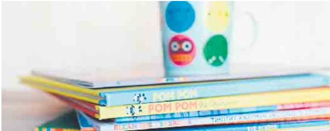
Vorleseaktionen für Kinder in der Stadtbücherei.

Freundeskreis der Stadtbücherei Bad Driburg stellt Programm zusammen