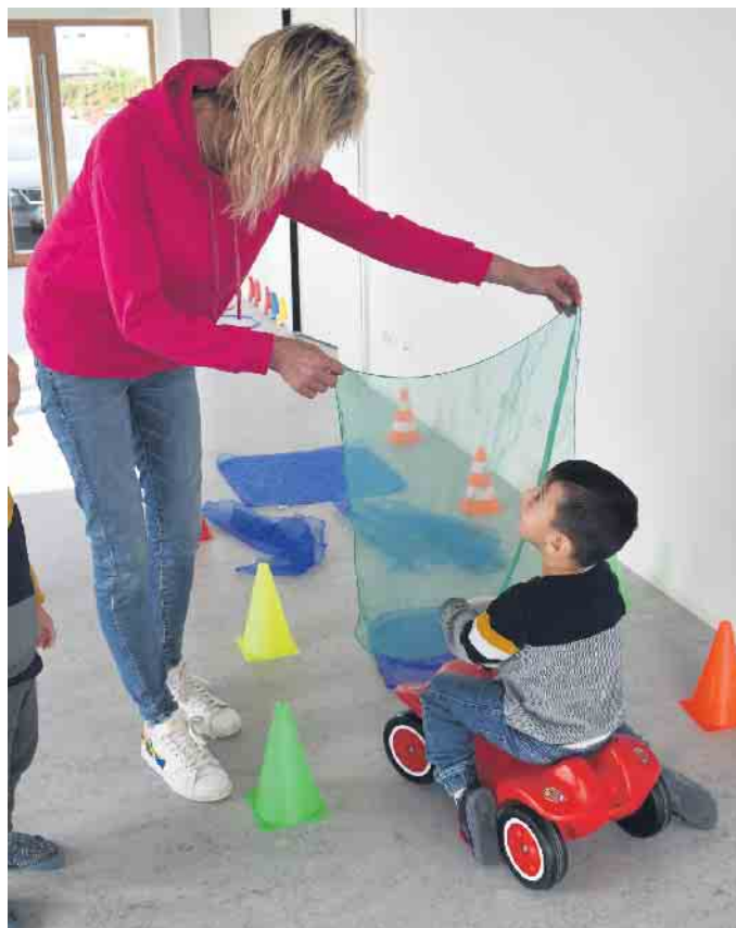
Janyar fährt durch die imaginäre Bobbycar-Waschstraße.

und Erzieher spüren deutlich, dass die Kitakinder zwischendurch Gelegenheit brauchen, um sich auszutoben und sich körperlich zu messen.