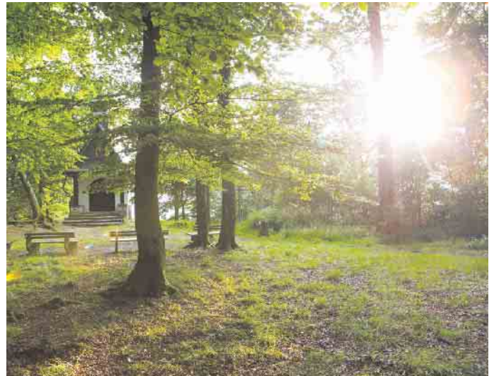
Bestattungswälder befinden sich teilweise auch in Forsten, die als nachhaltig zertifiziert sind.