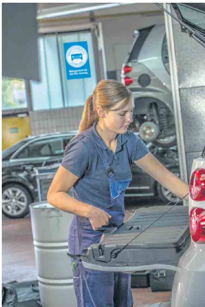
Berufe in der Kfz-Branche leisten einen wichtigen Beitrag zur Mobilität der Gesellschaft.

geprüften Automobil-Verkäufer oder -Serviceberater sowie weitere Kfz-spezifische Qualifizierungen. Darüber hinaus steht auch der Weg zu Führungspositionen oder zur Selbstständigkeit offen. Der klassische Meister etwa kann zum Werkstattmanager oder Betriebsleiter aufsteigen, einen Betrieb übernehmen oder selbst einen gründen. Auch akademische Abschlüsse bis zum Bachelor oder Master of Business Administration in technischen und kaufmännischen Studiengängen liegen in Reichweite. (djd)