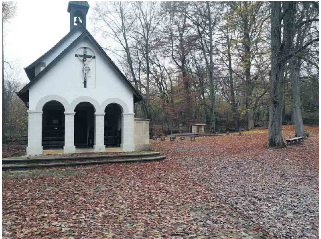
Neuenheerser Schützen reinigen Kluskapelle

Über eine zahlreiche Beteiligung der Mitglieder sowie interessierter Mitbürger würde sich der Vorstand freuen.