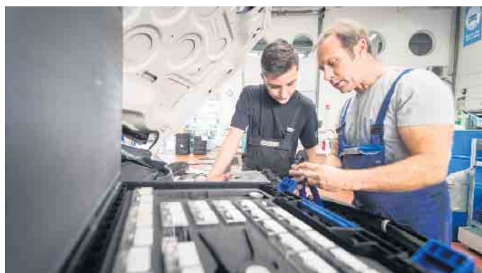
Eine Ausbildung im Kfz-Gewerbe eröffnet vielfältige Berufsbilder und Karriereoptionen.

Die Branche bietet eine Vielzahl von Einstiegs- und Aufstiegsmöglichkeiten. Wer etwas mit Autos, motorisierten Zweirädern oder Lkws machen möchte, kann klassisch über den dualen Bildungsweg aus betrieblicher Ausbildung und Berufsschule in technische und kaufmännische Laufbahnen einsteigen. Unter www.wasmitautos.com finden Interessierte Informationen und Tipps rund um Ausbildungen und berufliche Entwicklungsmöglichkeiten sowie zur Suche von Ausbildungsbetrieben nach Postleitzahl und Ort. Die Website erklärt zudem, worauf es in den typischen Berufsbildern Kfz-Mechatroniker,