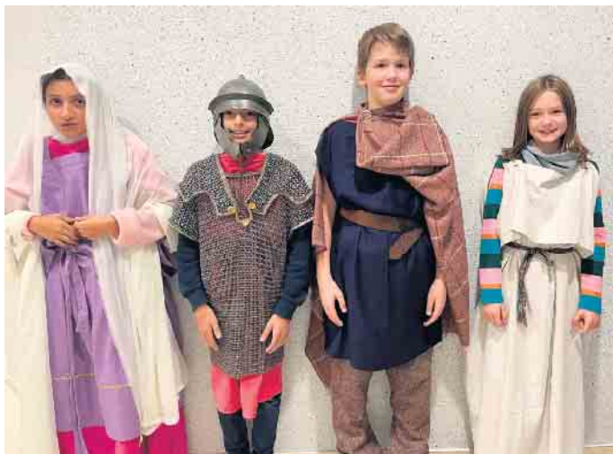
Kurzum wurden aus den Sechstklässlerinnen und -klässlern alte Römer oder Germanen.

läutert, aber auch das alltägliche Leben der Römer und Germanen thematisiert. Was beispielsweise eine „Tunika“ oder eine „Fibel“ ist, konnten die Sechstklässlerinnen und -klässler am eigenen Leib erfahren, indem sie kurzerhand mit originalgetreuen Kleidungsstücken ausgestattet wurden und wahlweise in die Rolle eines Germanen oder eines Römers schlüpften. Unter anderem standen beispielsweise ein 10kg schweres römisches Kettenhemd oder ein römischer Legionärshelm