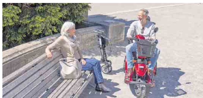
Seniorenmobile - eine gute Option, die Selbstständigkeit zu erhalten und die eigene Mobilität wieder zu erhöhen.

gut wie am Timmendorfer Strand, in Berlin ebenso wie am Bodensee und nicht nur im Urlaub, sondern auch bei Kuraufenthalten oder dem Besuch bei Freunden oder Verwandten. So steht erholsamen Urlauben und geselligen Unternehmungen nichts mehr im Wege. (djd)