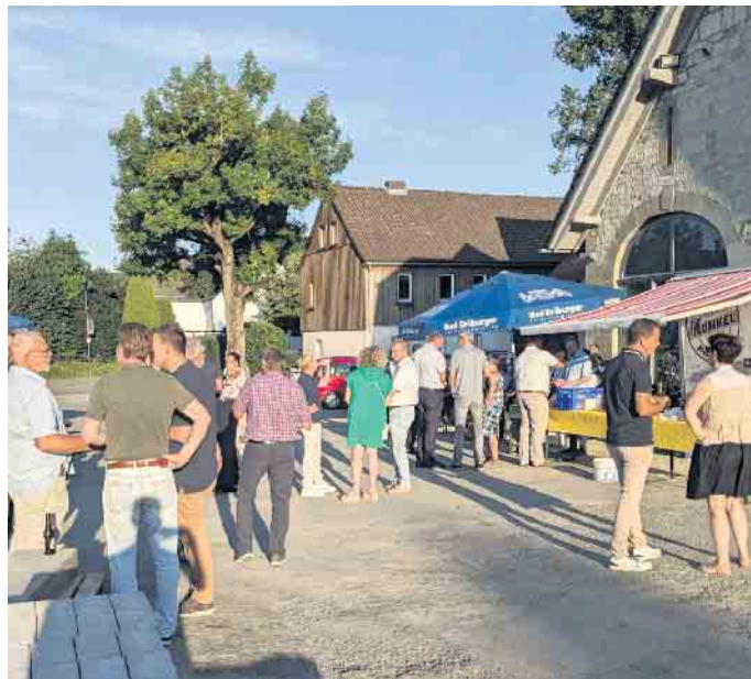
Sommerliche Atmosphäre sorgte für ein stimmungsvolles Fest.