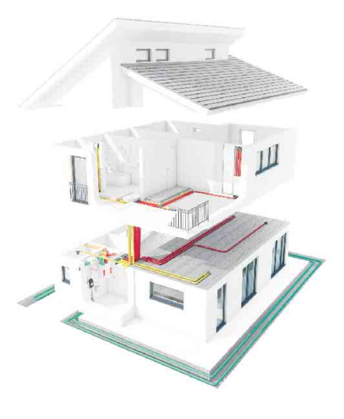
Im ganzen Haus frische, vorgewärmte Luft, ohne die Fenster manuell öffnen zu müssen: Energieeffiziente Haustechnik schont das Klima und die Haushaltskasse.

Zusätzlich arbeitet eine moderne Lüftungsanlage mit Wärmerückgewinnung äußerst stromsparend. Die Wohnungslüftung sorgt zudem für eine bessere Effizienz-Bewertung des Gebäudes und hebt den Wiederverkaufswert. Gerade in Neubauten oder bei der energetischen Sanierung, wenn die Gebäudehülle fast luftdicht ist, spielt die Lüftungstechnik ihre Vorteile aus. (djd)