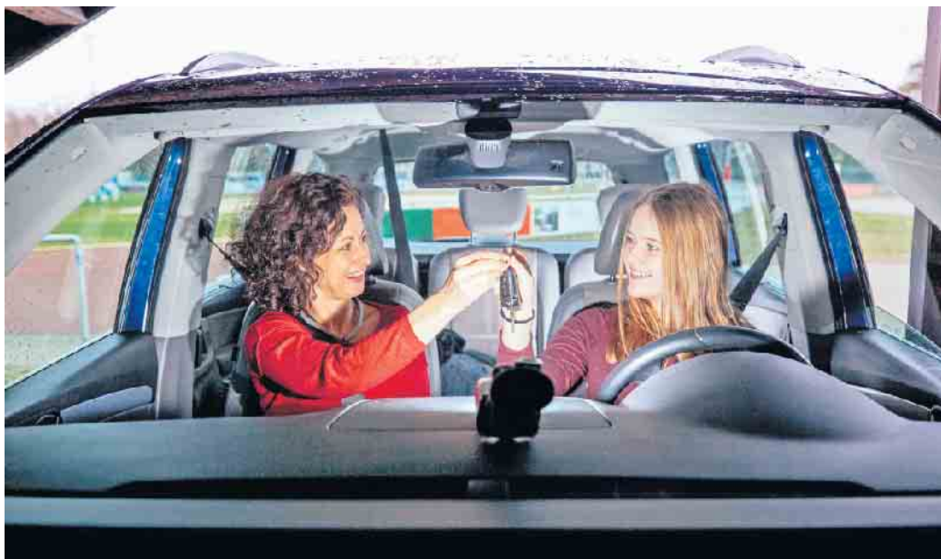
Beim BF17 sammeln Fahranfängerinnen und -anfänger begleitet und unterstützt hilfreiche Erfahrungen im Straßenverkehr.

Das Begleitete Fahren ab 17 lohnt sich für Jugendliche