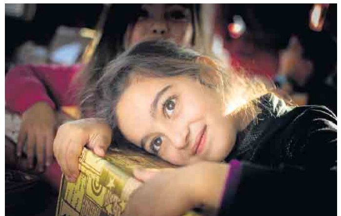
Ein Päckchen mit netten Kleinigkeiten bringt große Freude in Kinderherzen.

helfen Sie Ihrem Päckchen noch auf den Weg zum Ziel. Die Annahmestelle in der Umgebung: BlumenHörning im Center am Speicherturm, Anto-Spielerstr. 33, 32839 Steinheim Ringfoto Beckmann, Schwalenbergerstr. 6, 32816 Schieder - Schwalenberg St. Nikolaus Apotheke, Marktstr. 6, 33039 Nieheim Brunnen Apotheke, Langestr. 119,