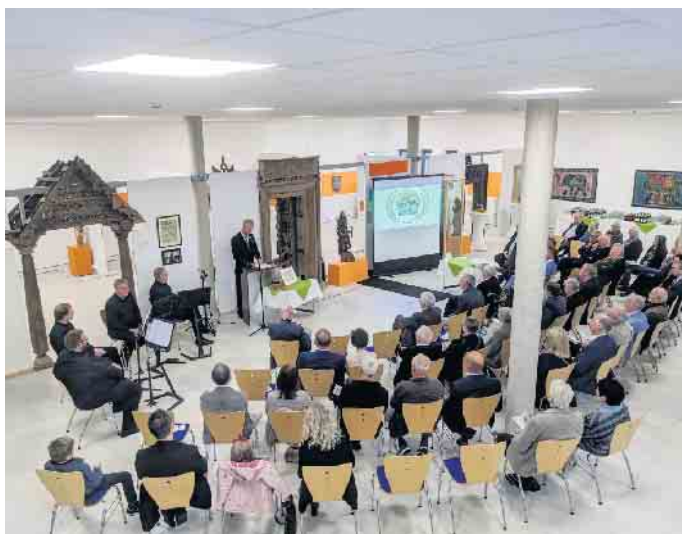
Der Festakt fand im Foyer der großen Ausstellungshalle statt.