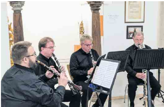
Das Klarinettenquartett Collegium Clarino begleitet den Festakt musikalisch.