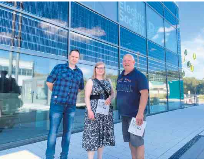
Mitglieder des Ortsvereins vor dem Infogebäude des „All Electric Society Park“

Gemeinden integrieren lassen würden. Elektromobilität, regenerative Energien und moderne Infrastrukturen bieten zahlreiche Möglichkeiten dem Klimawandel aktiv entgegenzutreten, aber auch die Innenstädte und Gebäude effektiver zu nutzen und wohnlicher zu machen. Besonders überzeugten die Gebäudebegrünungen, wegen der immer häufiger zu erwartenden heißen Sommermonate, eine angenehme Umgebung schaffen können. Diese kleine, aber hochinteressante Exkursion wurde mit einem Besuch im Eiscafé dem Hochsommer entsprechend abgeschlossen. Nadine Nolte