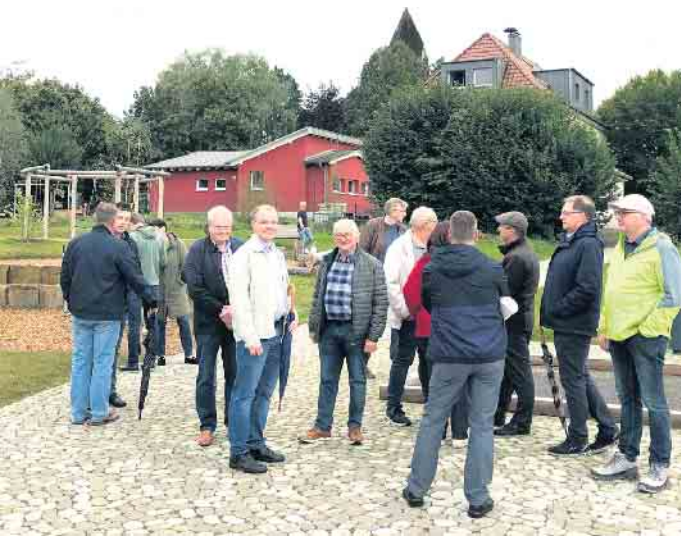
CDU vor Ort in Reelsen, hier am neuen Dorfplatz.

Am Samstag, den 07.09.2024 trafen sich einige Mitglieder des SPD-Ortsvereins Bad Driburg in Blomberg am „All Electric Society Park“ der PHOENIX CONTACT Deutschland GmbH. Der Park bietet einen umfassenden Einblick über alle Bereiche der alternativen Energien und deren Anwendung in unserem Alltag. Die Besucher*innen verschafften sich einen Eindruck über die Möglichkeiten der Integration regenerativer Energiegewinnung in Gebäude und allgemein die Infrastruktur moderner Gebäude. Einige der Konzepte regten zur Diskussion an, ob sich derartige Konzepte nicht auch in Stadt und