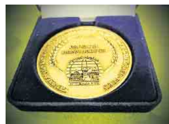
Die Medaille des „Generalhonorarkonsul Manfred O. und Helga Schröder-Preises“.