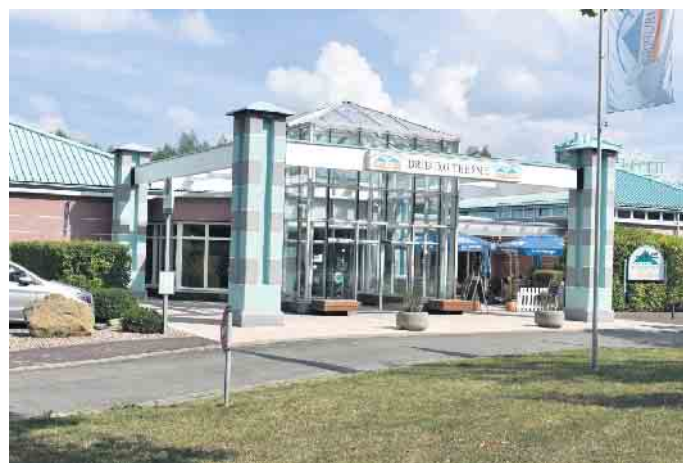
Die Driburg Therme lockt jährlich 100 000 Besucher.

Energiekonzept mit neuem Blockheizkraftwerk. Zusätzlich hat man seit Jahresanfang 2022 auf Ökostrombezug umgestellt. Ein großer Vorteil des Thermen-Heilwassers ist, dass es schon mit einer Temperatur von 25 Grad aus der Erde kommt, sodass zur „Thermen-Wassertemperatur“ von 32 Grad nur 7 Grad zugeheizt werden müssen.