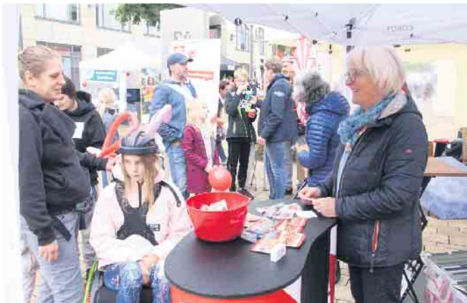
An den Ständen der Wohlfahrtsorganisationen kommen Menschen miteinander ins Gespräch

Mit dem Kreisfamilienfest in Bad Driburger ist der Kreis Höxter in die interkulturelle Woche gestartet