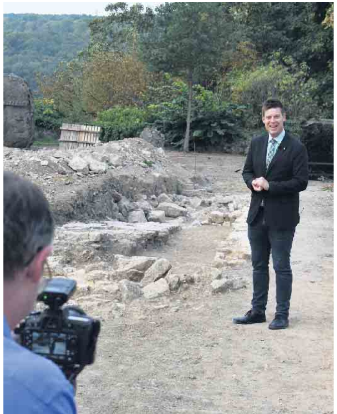
Videodreh an der Burg Dringenberg.

einhalb-minütige Videos zu den Themen Abenteuerspielplatz am Katzohlbach und Dorfplatz Dringenberg entstanden. Interessierte finden diese auf der Homepage der Stadt unter: https://www.bad-driburg.de/de/aktuelles/video-news.php . Von besonderer Tragweite und Wichtigkeit sind folgende Projekte in diesem Jahr: der Gesundheits- und Aktivpark auf dem Eggelandareal, die Umgestaltung der Brunnenstraße, Dorfplätze und die Erstellung des neuen Abenteuerspielplatzes am Katzohlbach sowie die Kita Georg-Nave-Straße.