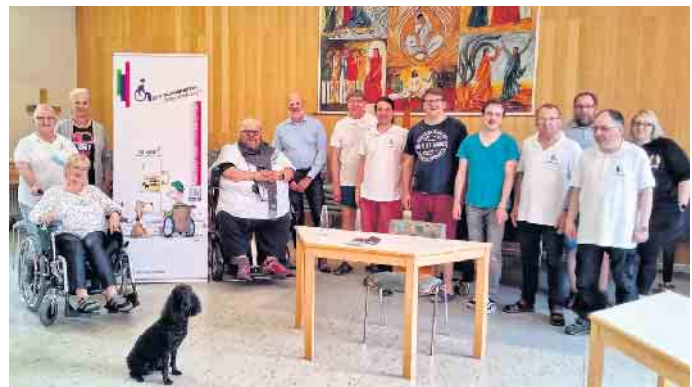
Foto: Mitglieder der Selbsthilfegruppe pro barrierefrei-bad driburg e.V.