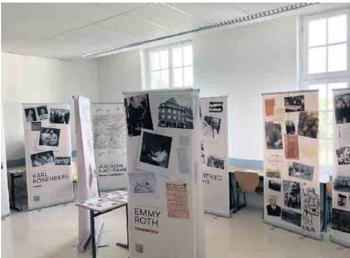
Die Bilder auf den Roll-Ups ermöglichen einen Zugang zum Thema, bevor man sich anhand der Biografiekarten intensiver mit Einzelschicksalen beschäftigen kann.

Ausstellung werden - auch wenn der Fokus auf der Zeit vor 1933 liegt - die Schicksale nach 1933 ebenfalls aufgegriffen und in Form von Bildern auf Roll-Ups sowie Biografiekarten vermittelt. Das Konzept folgt dem Gedanken, dass die Schülerinnen und Schüler sich die vorgestellten Persönlichkeiten selbstständig erschließen können. In den zwei Wochen nutzten am St. Xaver Lehrende mehrerer Fächer die Ausstellung, um mit ihren Schülerinnen und Schülern die Vielfalt jüdischen Lebens genauer zu erkunden. Sowohl Lehrende als auch Lernende erkannten dabei den enormen Mehrwert dieser Ausstellung, ermöglicht der biografiegeleitete Ansatz doch einen sehr intensiven Zugang zu individuellen Schicksalen und macht somit die Folgen des Holocaust für die Pluralität jüdischen Lebens erfahrbar. Gerade in der heutigen Zeit, in der Antisemitismus leider nach wie vor ein präsent und