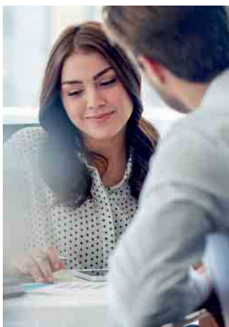
Bankkauffrau beziehungsweise Bankkaufmann zählen zu den wichtigsten Ausbildungsberufen in Deutschland.