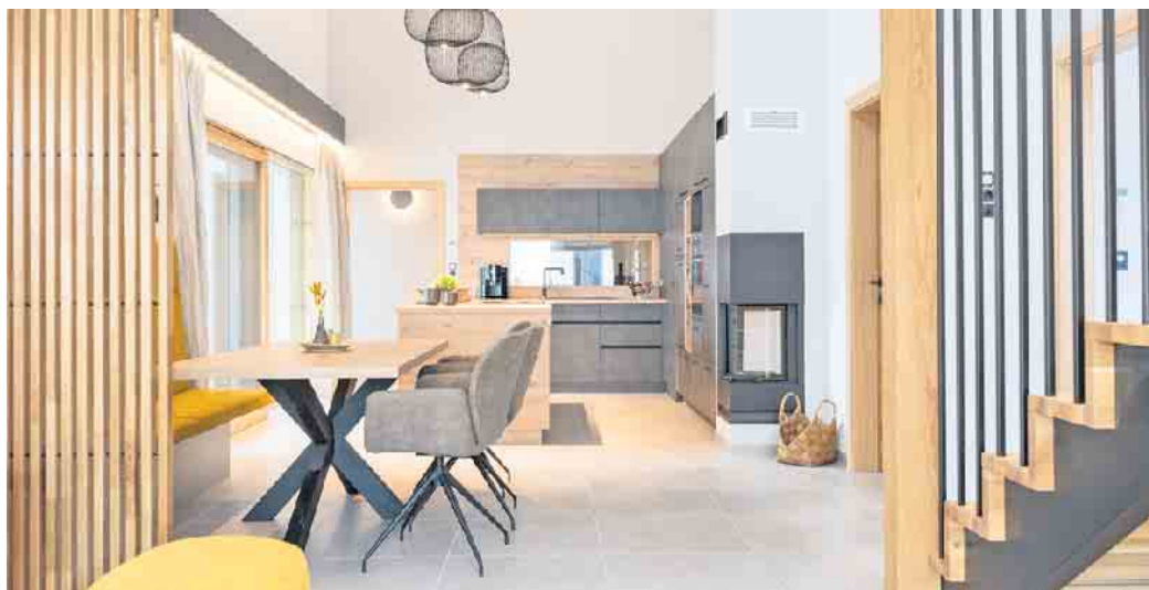
Unterschiedlich zonierte Bereiche und kurze Wege zwischen Küche, Essen und Wohnen unterstützen einen reibungslosen Familienalltag.

Bad Honnef. Der Grundriss eines Hauses ist die Basis für Wohlbefinden und ein harmonisches Zusammenleben. Eine kluge Planung bestimmt, wie gut das neue Zuhause den Alltag und die Gewohnheiten seiner Bewohner unterstützt. Dazu zählen Aspekte wie die Anzahl und die Größe der Zimmer, die Lichtverhältnisse, die Bewegungsfreiheit und Zukunftstauglichkeit. Wer vorausschauend plant, schafft ein Eigenheim, das heute und in Zukunft funktioniert. Der moderne Holz-Fertigbau bietet ideale Voraussetzungen und unterstützt Baufamilien mit individueller Planung, professioneller Beratung und flexiblen Lösungen. Größere Räume sind nicht immer bessere Räume. Entscheidend ist, wie gut man die Flächen nutzen kann. „Ein durchdachter Grundriss erleichtert den Alltag - etwa durch kurze Wege, klare Funkti-