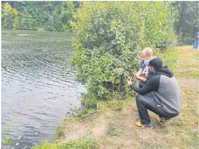
Angelabenteuer am Nethestausee für die Kleinsten.

Für die Jungen und Mädchen stand natürlich fest, dass sie definitiv einen Fisch fangen würden. Dementsprechend aufgeregt verteilten sich alle zügig mit ihren professionellen Leih-Angeln am Wasser, um unter Anleitung von höchst gedulden Mitgliedern des Angelsportvereins Neuenheerse e.V. die Grundtechniken zu erlernen. Und tatsächlich gelang es den Betreuern in kürzester Zeit den Kleinen beizubringen, wie man die Kunstköder mit der Angelrute möglichst weit auf den See befördert, um sie dann mit Hilfe der Angelrolle möglichst ruhig und verlockend wieder einzukurbeln. Dabei wackelte