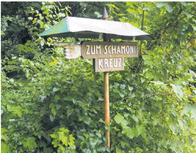
An der linken Seite des Wegs zur Telegrafensteinstation und zum Bilsterberg weist das Schild auf den Standort des Schamoni Kreuzes hin.

moni Kreuz am Sonntag, 28. September, um voraussichtlich 12:30 Uhr. Der genaue Termin wird noch bekanntgegeben. Die Festrede hält Domvikar Hans-Jürgen Rade aus Paderborn, die Segnung