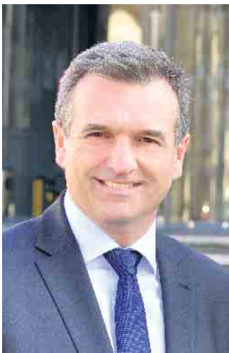
Ihr Burkhard Deppe Bürgermeister

Der erste Spatenstich ist in dieser Woche erfolgt, sodass die Baumaßnahme noch in diesem Jahr abgeschlossen werden kann. Sie wird rund 115.000 Euro kosten. Finanziert wird der Dorfplatz mit Hilfe von Fördermitteln aus dem Dorferneuerungsprogramm 2022.