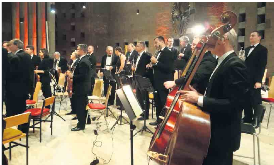
Das Bohemia Sinfonieorchester Prag ist am 5. Oktober bereits zum siebten Mal in unserer Badestadt zu Gast.