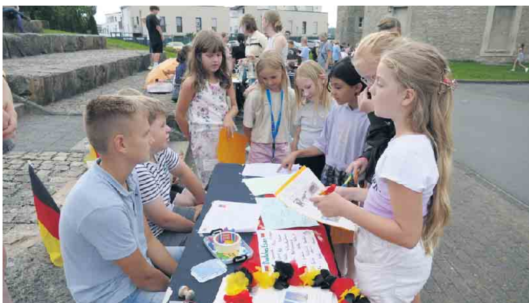
An ansprechend gestalteten Ständen konnten verschiedene Länder Europas spielerisch kennengelernt werden.