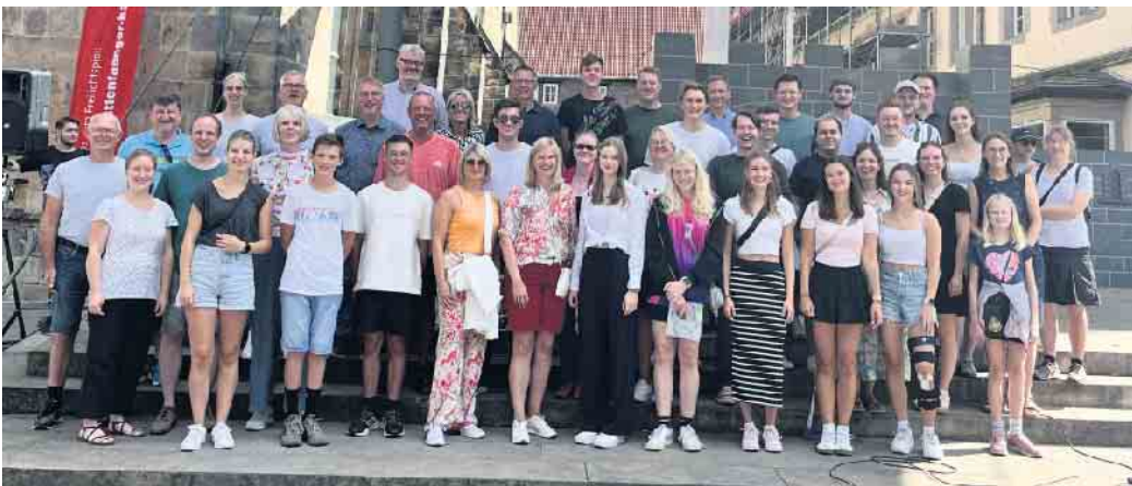
Die Reisegruppe der Stadtkapelle nach dem Freilichtspiel in Hameln.

Die Stadtkapelle Bad Driburg hat am Wochenende vom 7. und 8. September einen abwechslungsreichen Ausflug an die Weser organisiert, um sich für eine erfolgreiche Saison zu belohnen. Nur zwei Wochen nach dem Schützenfest in Bergheim, welches traditionell den Abschluss der Schützenfestsaison für die Stadtkapelle markiert, begaben sich 46 Teilnehmende Musiker*innen und Freund*innen der Kapelle auf eine Reise nach Bodenwerder und Hameln. Der Samstag startete direkt mit einer sportlichen Herausforderung auf der Sommerrodelbahn in Bodenwerder. Bei herrlichem Wetter testeten einige Mitglieder der Kapelle zudem die dort neu angelegte Adventure-Golf-Anlage. Anschließend ging es weiter nach Hameln, wo die Teilnehmer*innen