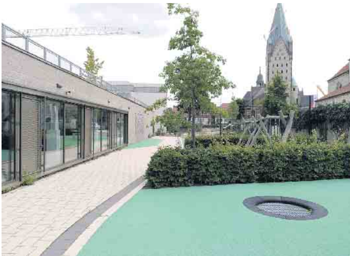
Clever gemacht: Spielgeräte und Pausenfläche auf dem Dach der Turnhalle.