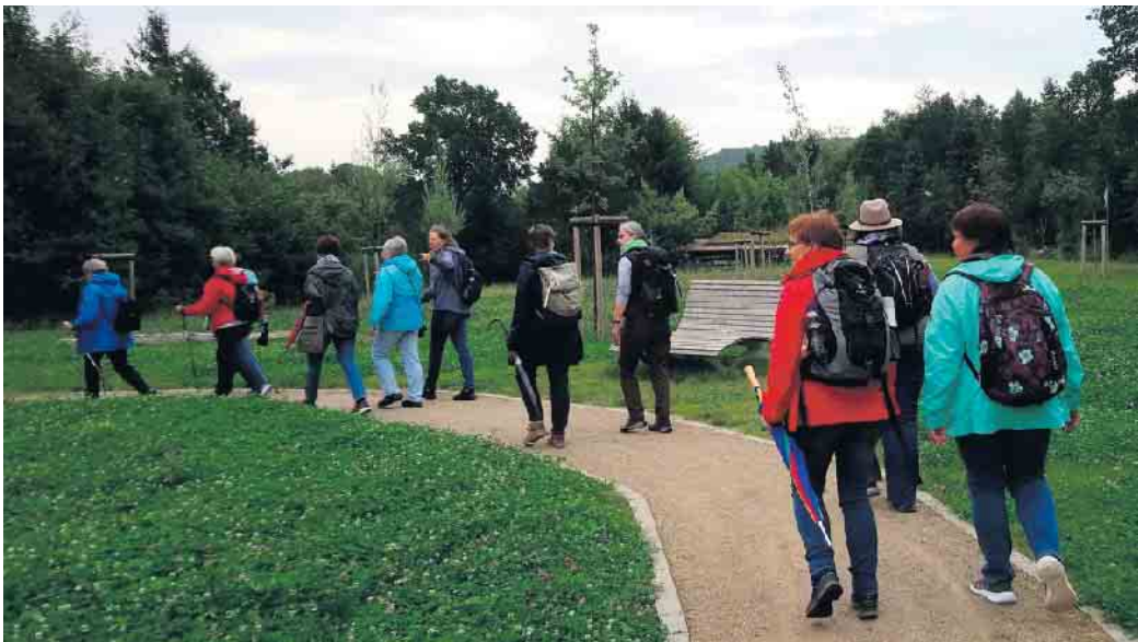
Die Wanderung ging entlang den Katzohlbach-Auen.