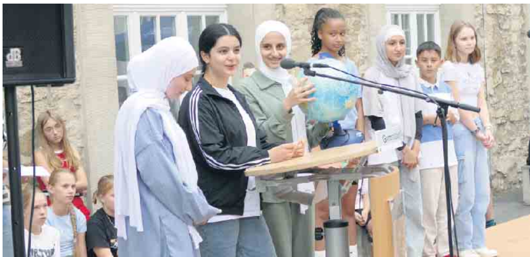
Schülerinnen und Schüler begrüßten die Gäste in verschiedenen Sprachen.