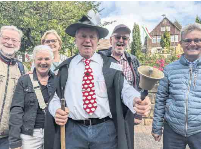
Der Ausrufer kündigt mit lautem Geläut den nächsten Programmpunkt an.

Tausende Besucher lassen sich vor historischer Kulisse mit einem großen Regionalmarkt in alte Zeiten entführen