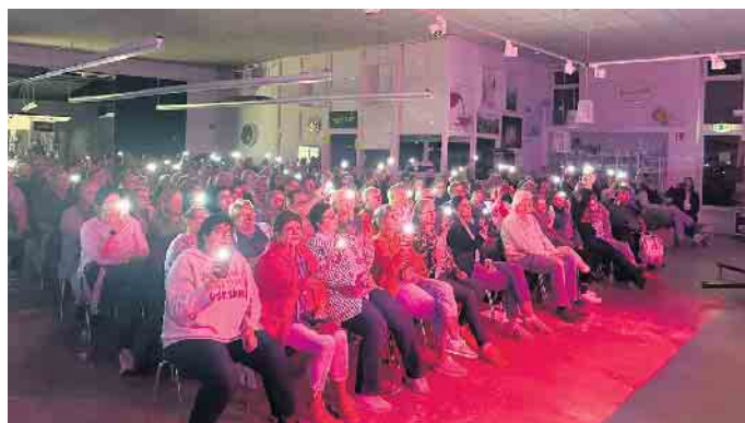
Tolle Stimmung bei Manifattura on Stage in Bad Driburg.