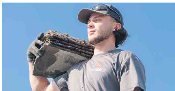
Dachdecker können anpacken, sind viel draußen, am Boden, in luftiger Höhe und abends sieht man, was man tagsüber geschafft hat.

Als Einstieg in die Dachdecker-Ausbildung wird ein Schülerpraktikum empfohlen. Viele Dachdeckerbetriebe bieten Schnuppertage an, informieren auf Azubimesen über den Beruf oder nehmen am Girls' Day teil. Denn der Beruf ist durchaus auch für Frauen geeignet, das zeigt auch der Anstieg bei den weiblichen Azubis: Plus 30 % im Vergleich zum Vorjahr. Gute Voraussetzungen sind neben handwerklichem Geschick ein mathematisches Grundverständnis und Teamfähigkeit. Wer zudem noch gern draußen arbeitet und dazu beitragen will, dass unser Klima besser wird, ist im Dachdeckerhandwerk genau richtig! (akz-o)