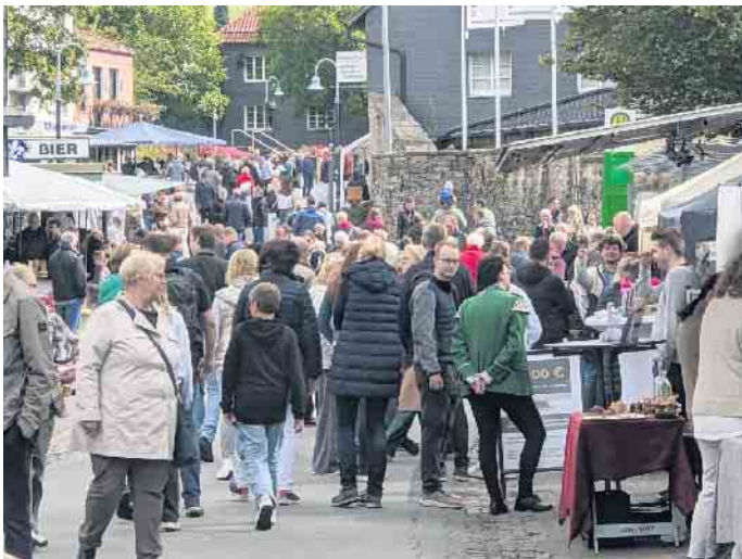
Tausende Besucher lassen sich beim Stiftsmarkt in Neuenheerse in alte Zeiten entführen.