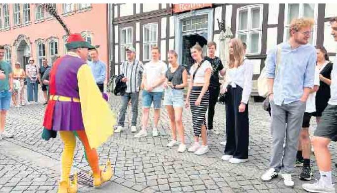
Die Mitglieder der Stadtkapelle lassen sich vom Rattenfänger die Stadt zeigen.

die Gruppe außerdem das Freilichtspiel zur berühmten Rattenfänger-Sage. Nach dem gemeinsamen Mittagessen ging es dann, begleitet von Musik und guter Laune, mit dem Bus zurück nach Bad Driburg. Dieser Ausflug bot den Musiker*innen nicht nur eine wohlverdiente Erholung, sondern auch neue Motivation für das anstehende Jubiläumsjahr 2025.