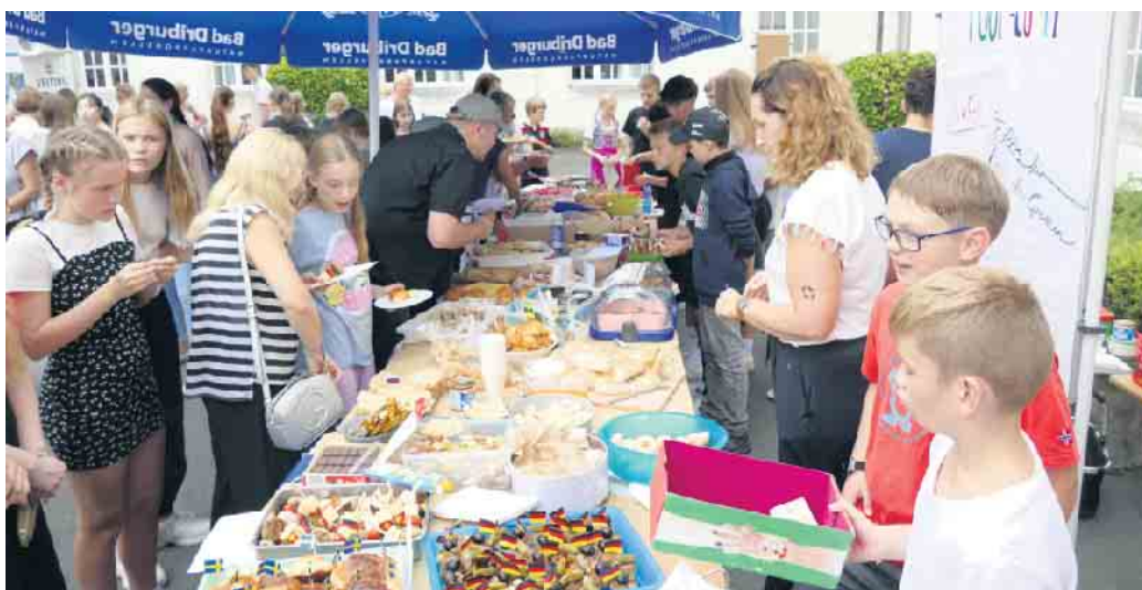
Das internationale Buffet sorgte bei allen Gästen für viel Freude.

Ein Zeichen für die Gemeinschaft und die Offenheit und gegen einen Geist der Ausgrenzung und der Angst zu setzen, darum ging es der Schulgemeinde des Gymnasium St. Xaver bei ihrem „Fest der Kulturen“.