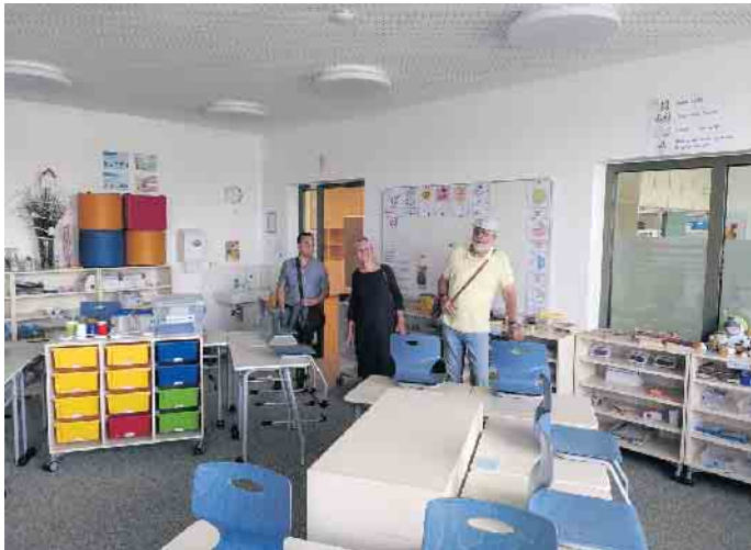
Die GRÜNEN Bad Driburg in der Grundschule St. Michael, Paderborn

Eine Schule ist ein kompliziertes Zusammenspiel von Kindern, Eltern, Lehrenden und dem Verwaltungsbereich dieser Schule. Dieses Zusammenspiel so gut wie möglich baulich zu unterstützen, das ist die Aufgabe der Kommunen. Daher haben sich die GRÜNEN im Rat in den Sommerferien eine als vorbildlich empfohlene Schule angeschaut. Wir GRÜNE wünschen uns daher für die neue Schule unter der