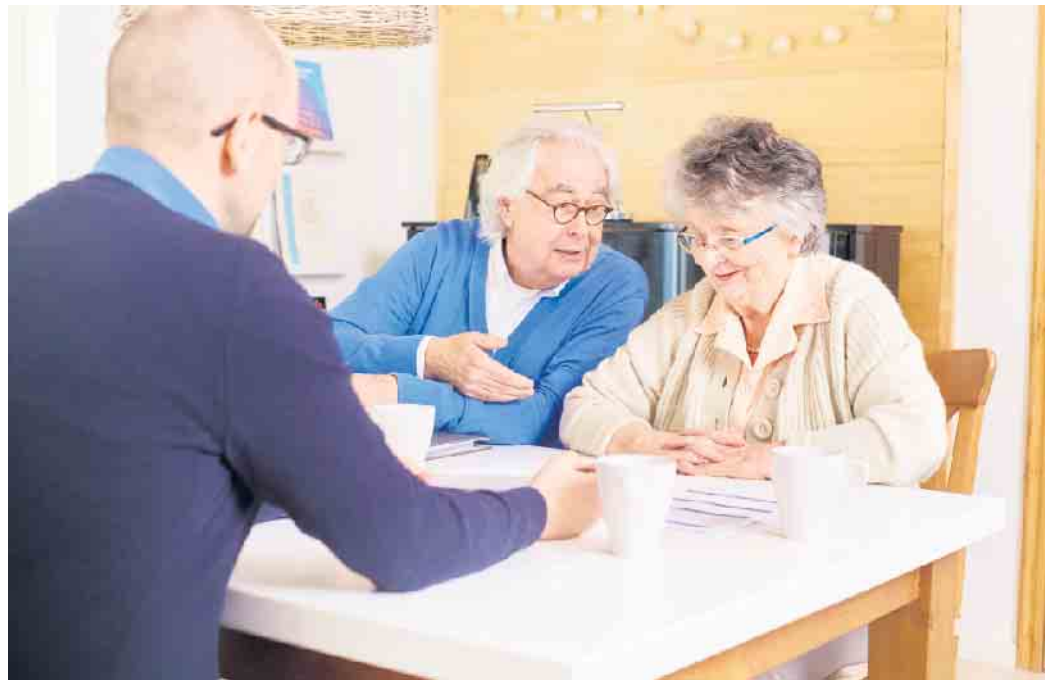
Mehr Pflegegeld, höhere Zuschüsse fürs Heim: Anfang 2024 wurden viele Pflegeleistungen erhöht.

Ebenfalls um fünf Prozent gestiegen ist die Pflegesachleistung – also die Summe, die man monatlich für einen Pflegedienst ausgeben kann. Hier gibt es jetzt 761 Euro bei Pflegegrad 2, 1.432 Euro bei Pflegegrad 3, 1.778 Euro bei Pflegegrad 4 und 2.200 Euro bei Pflegegrad 5. „Aber nicht nur