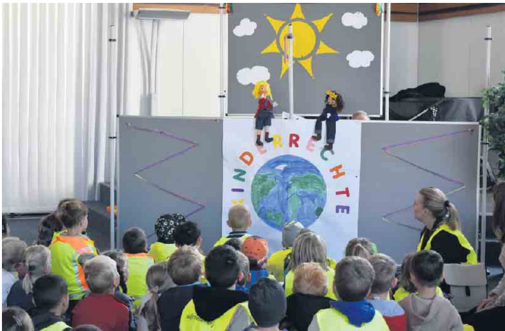
Es gab ein Puppen-Theater anlässlich des Weltkindertages.