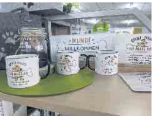
Gute Beratung ist für Landmarktbetreiberin Brigitte Cerny Ehrensache.

Bad Driburg. Keine Angst vor der kalten Jahreszeit. Im Herbst entscheidet sich, ob der Garten im nächsten Frühling eine gute Figur macht. Wer jetzt Samen sammelt und Kaltkeimer sät, wird mit einem blühenden Frühlingsgarten belohnt. Wenn der Garten im nächsten Frühjahr wieder wunderbar blühen soll, dann nichts wie ran an die Heckenschere, denn das Zauberwort für gut gedeihende Bäume und Sträucher lautet Rückschnitt. Der clevere Schnitt führt dazu, dass Pflanzen sich verjüngen können und für die nächste Saison kräftiger werden. Dazu passt die aktuelle Herbstaktion. „Anlässlich unseres 15-jährigen Bestehens gibt es 20 Prozent Preisnachlass auf jedes Bonafleur-Gartengerät“, sagt Inhaberin Brigitte Cerny. 2009 hat die Bad Driburgerin den Landmarkt Cerny am Konrad-Adenauer-Ring 2a gegründet. „Anfangs waren es 300 Quadratmeter, heute präsentieren wir unser Sortiment auf über 700 Quadratmetern“, erzählt Brigitte