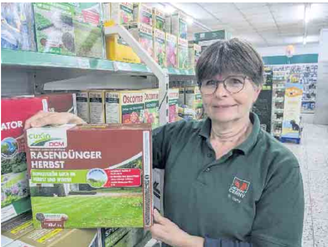
Wer den Newsletter vom Landmarkt Cerny abonniert hat, verpasst kein Angebot und erhält wertvolle Tipps.