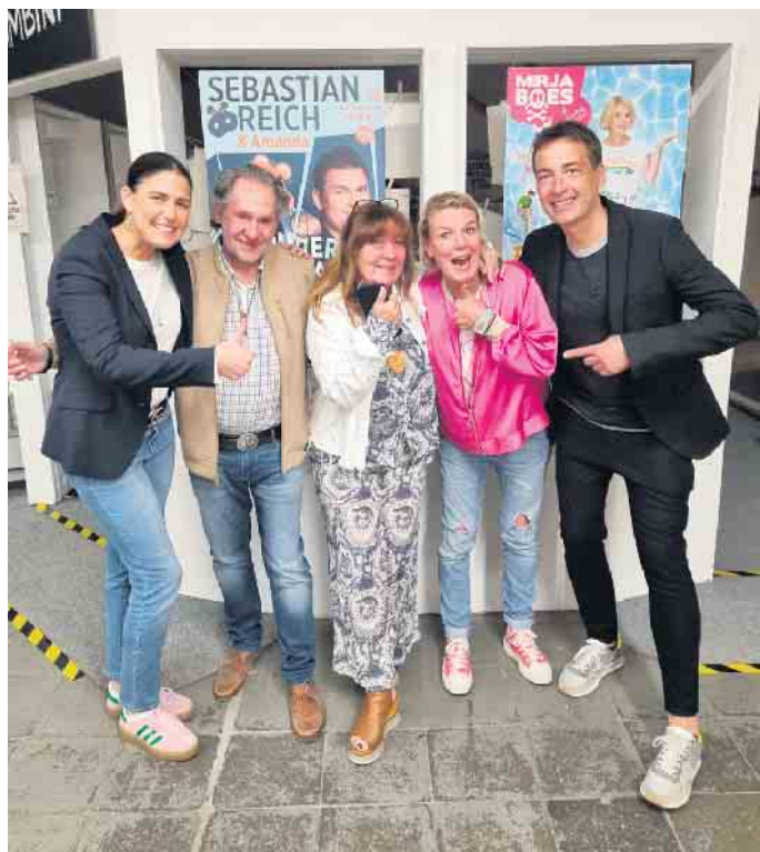
Das Veranstalterteam mit Comedy-Star Mirja Boes.