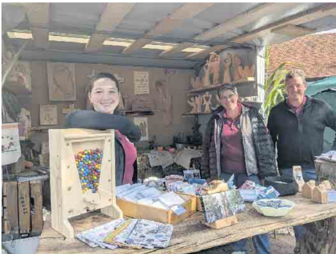
Neuenheerse feiert mit dem Stiftsmarkt seine besondere Ortsgeschichte.

Allerdings war die Einführung einer neuen Stiftsleitung ein seltenes Ereignis, das alle zehn bis 30 Jahre einmal vorkam. 868 hat die heilige Walburga das Stift Heerse gegründet. Es stieg im späten Mittelalter zu einer der wichtigsten Eliteschulen des