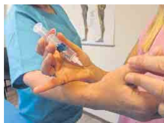
Auch die Eigenbluttherapie gehört zum erweiterten Portfolio.