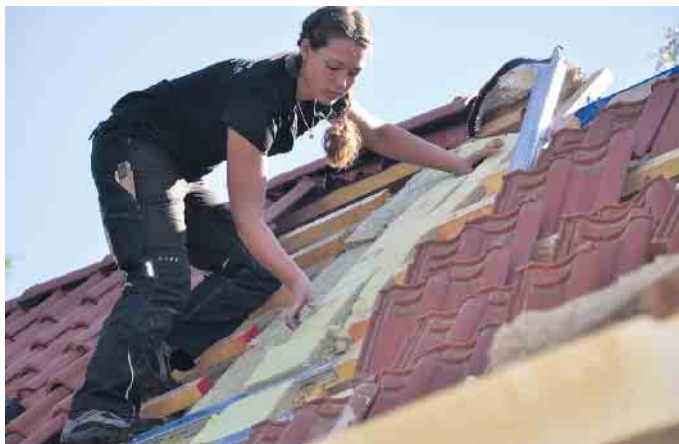
Dachdeckerinnen sind auf dem Vormarsch: schweres Tragen ist out, das übernehmen Lastenaufzüge.

Das Dachdeckerhandwerk ist modern und innovativ. Mit Drohnen werden Dächer inspiziert, Lastenaufzüge lassen schweres Tragen der Vergangenheit angehören und Apps speziell fürs Handwerk erleichtern die Büroarbeit. So verbindet das Dachdeckerhandwerk handwerkliches und gestalterisches Geschick mit aktivem Umweltschutz und neuen Technologien: Schieferhammer und iPad. Dächer von heute sind Schutz- aber auch Nutzdach: Sie schützen vor Regen und Wind, liefern Energie und als begrüntes Dach leisten sie einen Beitrag zur Artenvielfalt, kühlen im Sommer und vermindern die Feinstaubbelastung in der