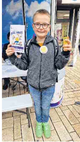
...Ein Stiftset gab es dazu.

der „Internationalen Wochen gegen Rassismus“ wählen und dann einen Button machen lassen. Besonders war dabei jedoch, dass verschiedene Varianten zur Auswahl standen. Neben der Standardvariante mit Nadel, die kostenlos abgegeben wurde, gab es noch Button mit Magnet oder Krokodilklemme. Auch ein Handspiegel, ein Kühlschrankmagnet oder ein Aufsteller wurden angeboten. Diese gab es gegen eine freiwillige Spende. Dazu erhielten alle Kinder, die einen Button selbst gestaltet hatten, ein Stiftset und ein Ausmalbuch mit Karikaturen von Phil Hubbe, das sich explizit mit dem Thema Barrieren auseinandersetzt. Das wichtigste war jedoch, dass