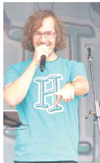
Kinderliedermacher „herrH“ begeisterte seine Mini-Fans mit einem Konzert und anschließender Autogrammstunde am Samstagnachmittag.