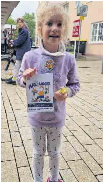
Ein Malbuch für ein Button...