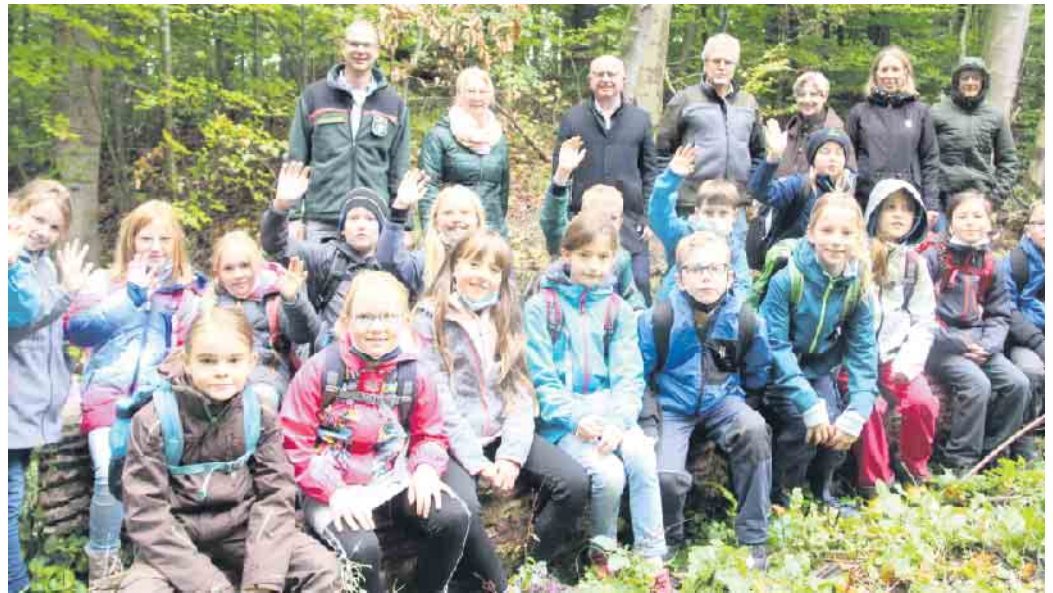
Die Waldjugendspiele sind heute wichtiger denn je.

Am Montag waren die Waldjugendspiele in den Städten Brakel und Nieheim gestartet. Am Dienstag erkundeten die Viertklässler aus den Bad Driburger Grundschulen auf 14 Lernstationen im Rietholz zwischen Kühlsen und Dringenberg den Wald und auch