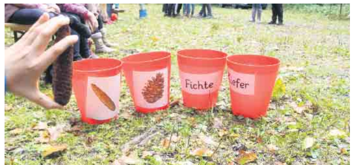
Hier müssen die richtigen Zapfen in den richtigen Eimer geworfen werden.