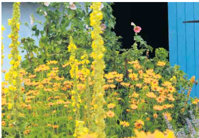
Zurück zum naturnahen Vorgarten.

Die Stadt Bad Driburg sieht sich als Klimaschutzaktive Kommune und setzt seit 2018 ausgewählte Maßnahmen aus dem Integrierten Klimaschutzkonzept um.