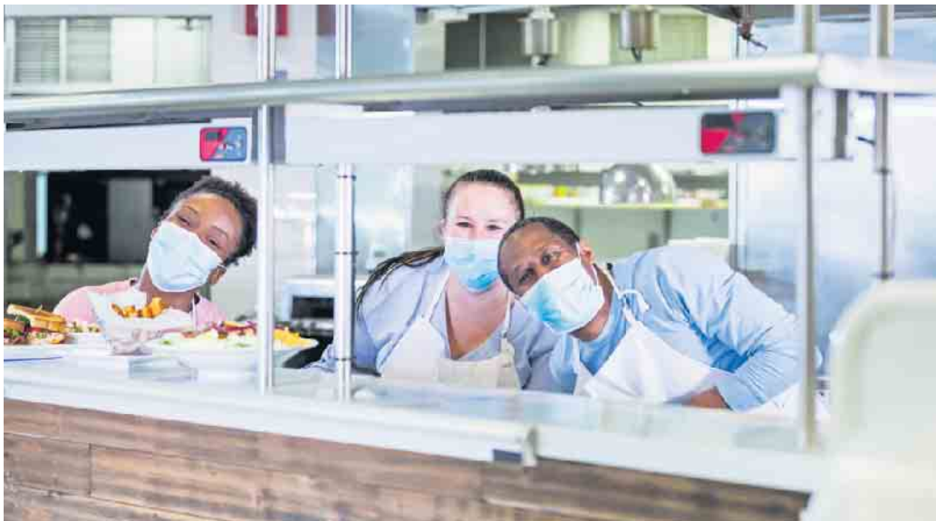
In der Systemgastronomie in Deutschland arbeiten Menschen aus rund 120 Nationen.

Die Systemgastronomie setzt in der Ausbildung auf interkulturelle Kompetenz