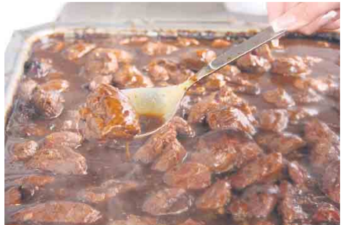
Hier schmoren die Schweinebäckchen, die es nur auf dem Stiftsmarkt Neuenheerse gibt.