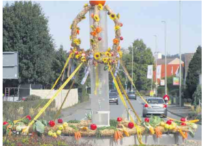
Erntedank im Kreisverkehr

Herbst auf den Feldern oder auch noch in dem einen oder anderen Siedlergarten heranreifen. Vielleicht lässt sich mancher Gartenbesitzer davon anregen, auch einmal ein Beet anzulegen, auf dem der selbst eigenes Gemüse anbauen kann. Das ist gar nicht so schwierig, wie manch einer meint. Neben dem neuen Selbstwertgefühl kann man sicher sein, dass die Ernte aus dem eigenen Garten garantiert Bio ist. Das ist gerade in der jetzigen Zeit, in der alles teurer wird, mal eine Überlegung wert. Oder nicht? HK