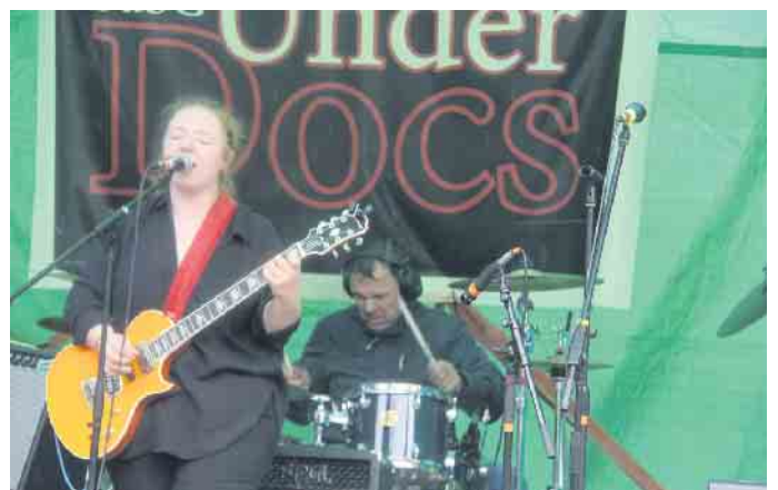
Der Stiftsmarkt bietet auch jungen Rockbands ein Forum.