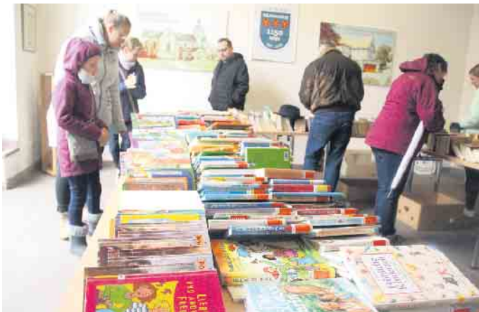
Der Bücherflohmarkt in der Dechanei erfreut sich großer Beliebtheit.