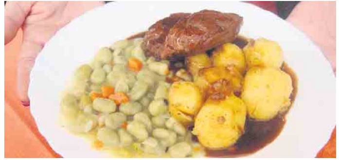
Schweinebäckchen mit dicken Bohnen und Kartoffeln sind eine historische Delikatesse aus Stiftszeiten.

Für viele Besucher, ein Hauptgrund, beim Stiftsmarkt dabei zu sein. „Ich hab auch schon mal zuhause selber Schweinebäckchen gemacht, aber das ist mir dann doch zu viel Aufwand und ich glaube, das ist wie Erbsensuppe, die schmeckt auch nur, wenn sie in großen Mengen zubereitet wird“, sagt eine Besucherin. Die nächsten Schweinebäckchen gibt es dann voraussichtlich am 3. Septemberssonntag im Jahr 2024.