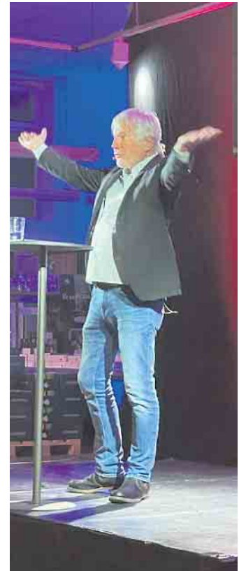
In der ganz besonderen Atmosphäre der Manifattura begeisterte Kabarettist Jürgen Becker das Bad Driburger Publikum.

Weiter geht „Manifattura on Stage“ am Sonntag, 23. Oktober, mit Jörg Knör, der um 20 Uhr mit seinem neuen Programm „Comeback des Lebens“ in der Badestadt zu Gast sein wird. Restkar-