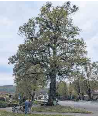
Linde am Konrad-Adenauer-Ring