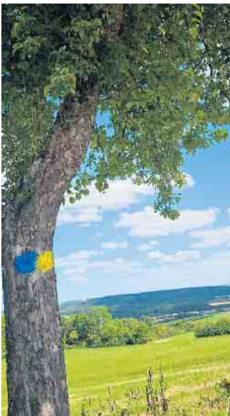
Hier darf gepflückt werden!

Im letzten Sozialausschuss wurde der GRÜNE Antrag auf Aufstellung von Spendern für Binden und Tampons in Öffentlichen Einrichtungen diskutiert.