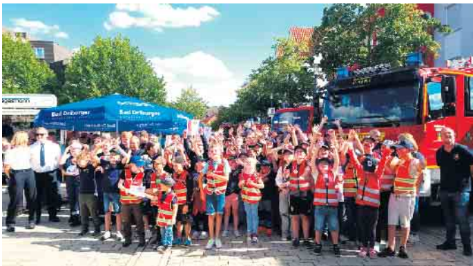
Kinder- und Jugendgruppen versammeln sich zum Gruppenbild

Mit bestem Wetter und großem Besucherandrang feierte die Kinderfeuerwehr Bad Driburg am Samstag, 6. September, ihr fünfjähriges Bestehen - eingebettet in einen bunten Blaulichttag in der Innenstadt.