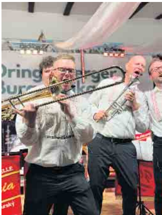
Mit voller Leidenschaft begeisterte die Blaskapelle Gloria das Publikum.