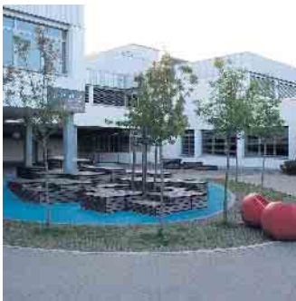
An der Gesamtschule bleiben Hygieneartikel kostenlos verfügbar.

Versorgung für Schülerinnen wird dauerhaft gesichert