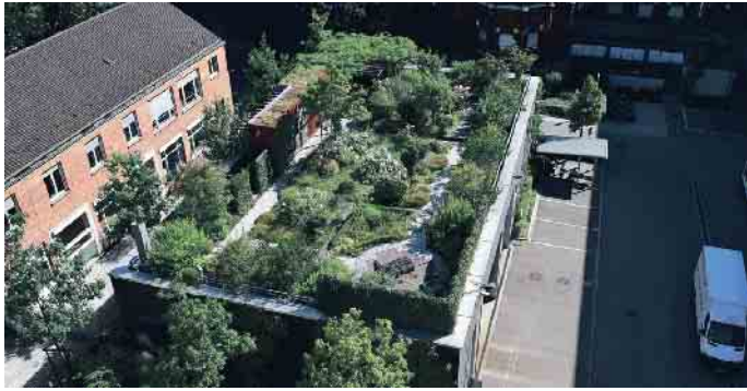
Auch Gärten sind auf Dächern möglich, es wird dann von einer intensiven Dachbegrünung gesprochen.

Dachdecker*in wird, entscheidet sich für einen Beruf mit Zukunft - und mit Verantwortung für eine klimafeste Gesellschaft. Wer mehr über eine Ausbildung im Dachdeckerhandwerk erfahren möchte, wird zum Beispiel hier fündig: www.dachdeckerdeinberuf.de (akz-o)