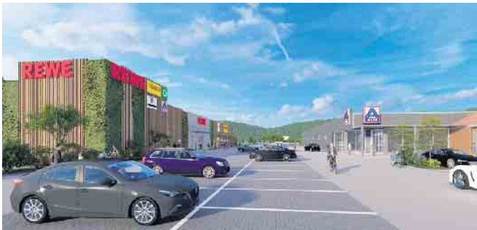
Visualisierung der Planungen am Siedlerplatz. Copyright: CLP GmbH

handels und des Textilhändlers bleiben dagegen unverändert. Der Discounter auf der Nordseite wird ebenfalls erweitert, die Verkaufsfläche wächst hier vom 800 m 2 auf 1.200 m 2 , der bisherige Backshop bleibt bestehen. Das Mietverhältnis mit dem Fitnessstudio soll bestehen bleiben. Mit dem positiven Votum des Bauausschusses können nun die Bauantragsunterlagen vorbereitet werden, um schnellstmöglich in die Umsetzung zu gehen. „Im Idealfall kann bereits im kommenden Jahr mit den Umbau- und Erweiterungsarbeiten begonnen werden“, erläuterte der Architekt Ian Crompton in der Sitzung des Bauausschusses. „Die bauleitplanerischen Weichen für die Neustrukturierung des Standortes sind gestellt und wir freuen uns auf eine konstruktive Zusammenarbeit mit dem Investor, um den Einzelhandel am Siedlerplatz zeitgemäß und attraktiv aufzustellen“, blickt Baudezernent Florian Greger dem Projekt positiv gestimmt entgegen.