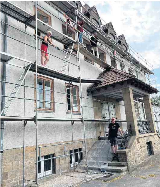
Ein Teil der Helfer/innen bei der fordernden Arbeit an der Nordseite des Altbaus.

amtlicher Arbeit wurde in einer geselligen Runde der erneute erfolgreiche Arbeitseinsatz an und für St. Walburga gebührend gefeiert.