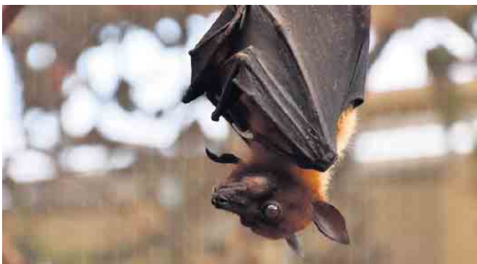
In der Stadtbücherei wird Wissenswertes zum Thema Fledermäuse vermittelt.

Kostenloses Kinder-Kreativ-Angebot der Stadtbücherei Bad Driburg