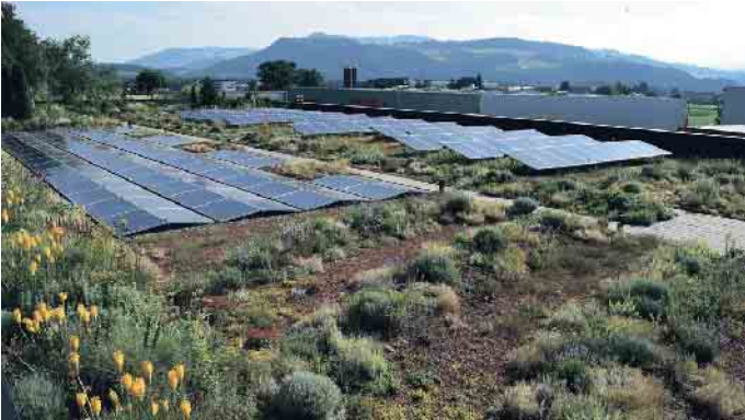
Die perfekte Kombi: Photovoltaik und Gründach.

Das Dachdeckerhandwerk ist bestens aufgestellt, wenn es um den Umgang mit den Folgen des Klimawandels geht. Das zeigt jetzt auch der Abschlussbericht des Bundesinstituts für Berufsbildung (BIBB), der die Rolle der beruflichen Bildung bei der Klimaanpassung untersucht. Unter den zahlreichen Ausbildungsberufen wird das Dachdeckerhandwerk besonders hervorgehoben - als einer von drei Berufen, die schon heute entscheidend zur Klimaanpassung beitragen.