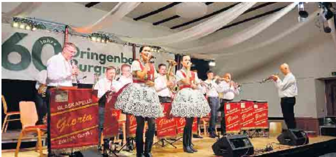
Die Blaskapelle Gloria mit ihren bezaubernden Gesangssolistinnen.

Die Dringenberger Burgmusikanten feierten am 23. und 24. August ihr 60. Jubiläum mit einem Wochenende der musikalischen Extraklasse. Am Samstag, 23. August, begrüßten die Burgmusikanten die tschechische Profi-Blaskapelle „Gloria“ in der Zehntscheune. Wer dachte, dass „Gloria“ nur böhmisch-mährische Blasmusik in ihrem Repertoire habe, wurde an diesem Abend eines Besseren belehrt. Mit ihren virtuosen Klängen konnte das Orchester die Zuschauer schnell begeistern und spätestens zum Abschluss riss es diese von ihren Plätzen und sie forderten lautstark nicht nur eine Zugabe. Der Sonntag begann mit feierlichem Festakt im Rahmen eines Geburtstagsfrühschoppens. Auch dieser stand ganz im Zeichen der Musik: Die befreundeten Musikvereine Spielmannszug und Fanfarenzug Dringenberg, sowie die Schönburger