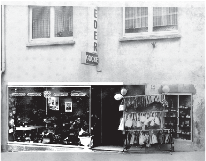
So sah das HansaHaus mit dem Lederwarengeschäft vor 50 Jahren aus.