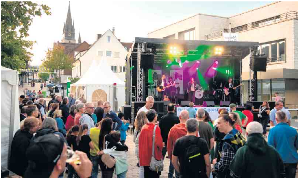
Ein tolles Musikprogramm an beiden Tagen sorgt für gute Laune