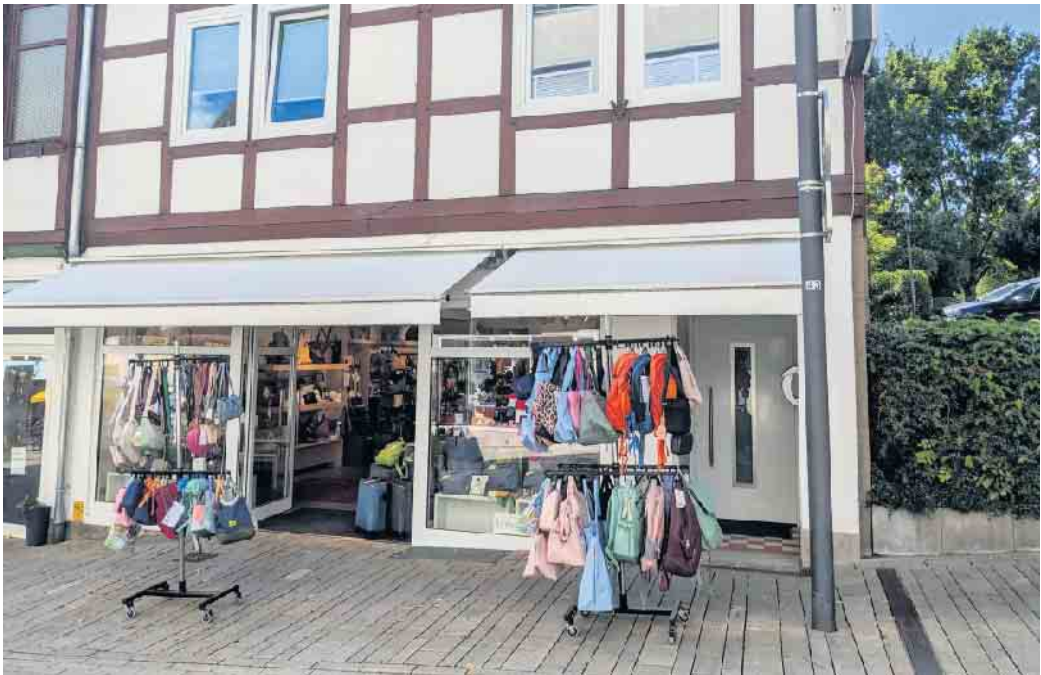
So präsentiert sich das historische Gebäude mit dem Ladengeschäft Leder Gocke seit der Kernsanierung.