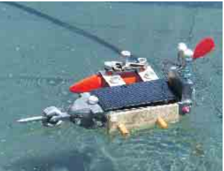
Von Schülern selbstgebaute Solarboote gehen am Samstag beim SOLAR.Cup ins Rennen.

Tag der Wissenschaft am Samstag, 20. September