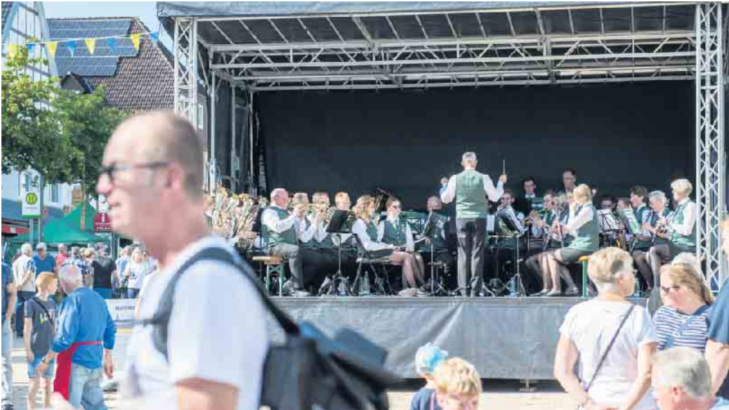
Traditionell spielt die Stadtkapelle Bad Driburg am Sonntag ihre beliebtesten Hits.

Am Sonntag steht das Thema Bewegung im Mittelpunkt des Stadtfestes. „Benny’s Danceschool“ startet um 10:30 Uhr mit einem Wake up zum Mittantzen. Bereits bei „Live in Bad Driburg“ sorgte er mit seinen Moves, seinem Können, der guten Laune und seinen Tanzgruppen für Begeisterung. Unterstützung bekommt er beim Glasstadtfest von „Dancing IN-TEG“. Seit drei Jahren wird bei der Firma INTEG inklusiv, kreativ und mit ganz viel Herz getanzt und gemeinsam bringen beide Gruppen in diesem Jahr Bewegung, Lebensfreude und jede Menge Rhythmus auf die Bühne des Glasstadtfestes. Um 11 Uhr erfolgt die diesjährige Preisverleihung des Projekts Stadtradeln. Glasstadtfest-Besucher können auch in den Sport des Bogenschießens unter fachlicher Anleitung reinschnuppern. Natürlich ist auch der Glasstadtmarkt geöffnet und wird am Sonntag durch einen Stand der Landfrauen bereichert, die wieder „Schönes im