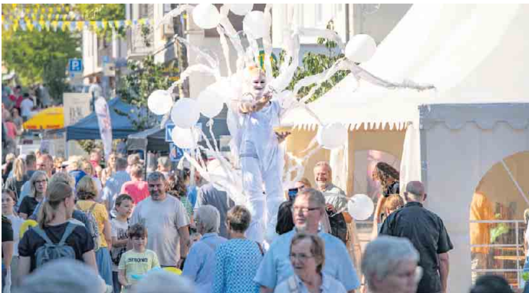
Ein buntes Glasstadtfest erwartet die Besucher am 20. und 21. September in Bad Driburg.

Stadtkapelle Bad Driburg ihre beliebtesten Hits und von 15:30 bis 18 Uhr sorgt das eingespielte DJ-Duo Marcus & Markus aus Höxter für gute Stimmung. Dabei reicht ihr Repertoire von stimmungsvollen Partyklassikern bis zu aktuellen Charts - die passende Unterhaltung für den gemütlichen Einkaufsbummel in den ab 13 Uhr geöffneten Werbering-Fachgeschäften. Von 14 bis 17 Uhr haben die Kinder die Möglichkeit, sich beim Kinderschminken wunderschöne Motive auf Gesicht oder Arme malen zu lassen und Familien können sich von 14 bis 18 Uhr auf gemütliche Planwagenfahrten durch die Oberstadt freuen. Abfahrt ist an der Ecke Lange Straße/ Schulstraße.