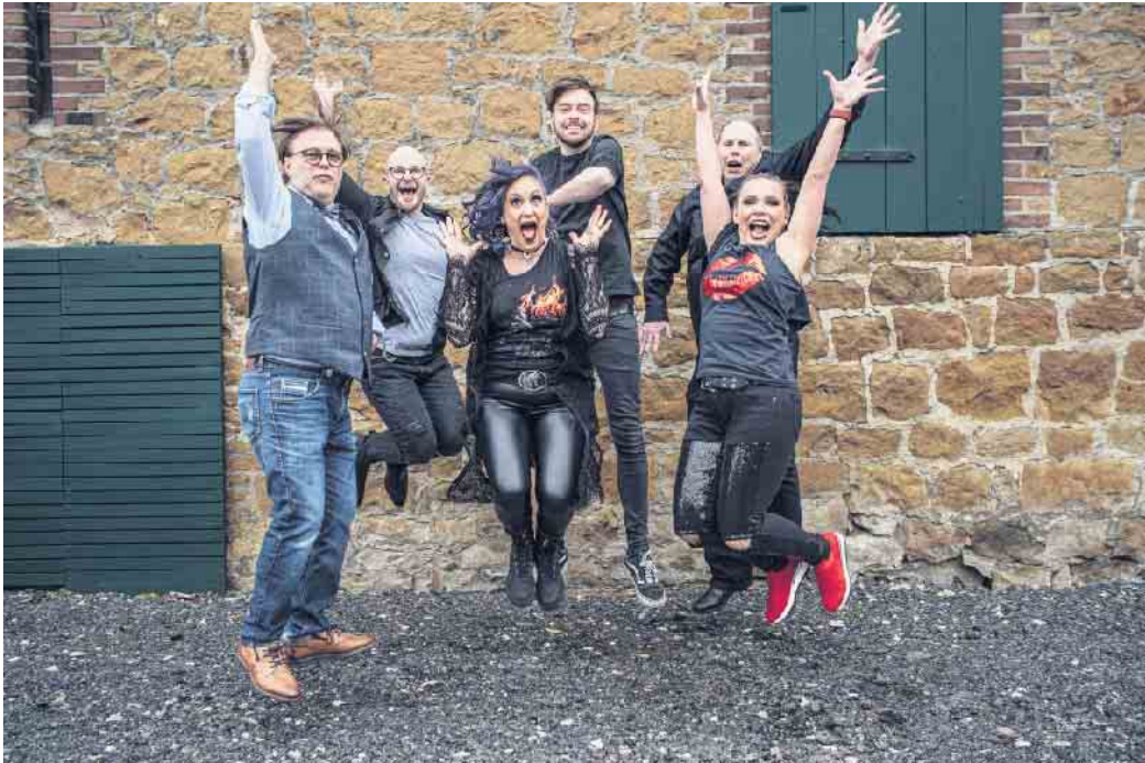
Am Samstag bringt die preisgekrönte Band PATCHWORK Noise Rhythmus und gute Laune auf das Glasstadtfest.

ist Naturwissenschaft und Technik zum Mitfeiern“ ergänzt Michael Arens voller Vorfreude. Die Siegerehrung wird zwischen 15 und 16 Uhr durchgeführt. Der Verein Natur und Technik e.V. wurde mit dem Ziel gegründet, die Begeisterung für die MINT-Fächer im Kreis Höxter zu fördern. Denn MINT, also Mathematik, Informatik, Naturwissenschaften und Technik, gehören in nahezu allen gewerblichen und kaufmännischen Berufen zum wesentlichen Rüstzeug. Auch das Forschermobil ComNatura ist am Samstag vor Ort und bietet den Kindern vielfältige Möglichkeiten zu Experimentieren und so praxisnah Zusammenhänge rund um naturwissenschaftliche und technische Phänomene zu entdecken. Von der IAA nach Bad Driburg - auf der Bewegten Meile am Hellweg gibt es einen spannenden Blick in die Gegenwart und Zukunft der Mobilität. Anhand eines