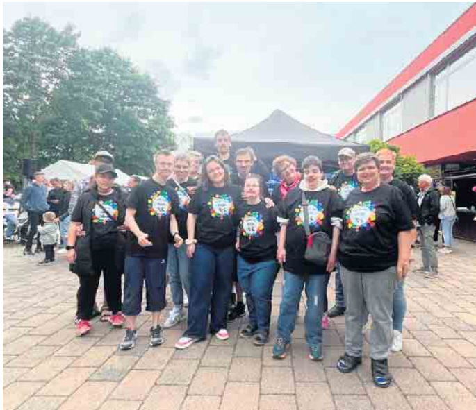
Dancing INTEG - bringt Bewegung, Lebensfreude und jede Menge Rhythmus auf die Bühne!.