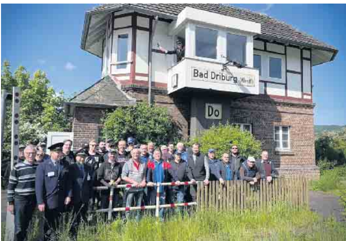
Das Stellwerk mit „Vatertagsgästen“ von der 2. Kompanie der Bad Driburger Bürgerschützengilde.

Die Bad Driburger Eisenbahnfreunde laden zur Besichtigung des historischen Stellwerks Do an der Brakeler Straße am Tag des offenen Denkmals am 14. September ganz herzlich ein. Nach der Stilllegung der beiden Stellwerke in Bad Driburg haben die Eisenbahnfreunde mit Unterstützung der Stadt das Stellwerksgebäude Do erhalten und renovieren können. Auch die bereits verloren geglaubte Technik konnte zu großen Teilen wiederbeschafft werden. Stellwerke sind immer noch bedeutende Bausteine der Eisenbahntechnik. Sie stellen sicher, dass sich in einem bestimmten Gleisabschnitt jeweils nur ein Zug