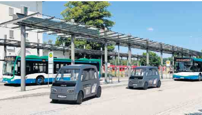
„Mobile Zukunft mit NeMo: Automatisiertes Fahren“ lautet das Motto der Bewegten Meile am Hellweg.

Für jeden etwas - ein Tag der Wissenschaft mit Solarboot-Rennen und einer Bewegten Meile, ein bunter Glasstadtmarkt mit Unterhaltungsprogramm sowie ein verkaufsoffener Sonntag