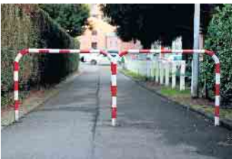
Solche Hindernisse werden derzeit auf ihre Notwendigkeit geprüft. Gegebenenfalls ist für Ersatz zu sorgen.

Beseitigung von Hindernissen erfordert auch Ersatzmaßnahmen