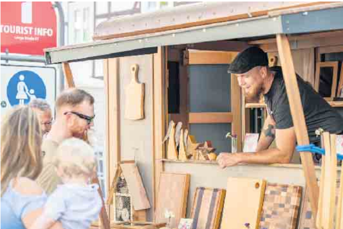
Über 30 Aussteller auf dem Glasstadtmart bieten ihre meist selbstge-fertigten Produkte an.

seum zu bewundern. Diesen wird es auch als Motiv auf einer Sonderedition auf Gläsern zum Glas-stadtfest geben.