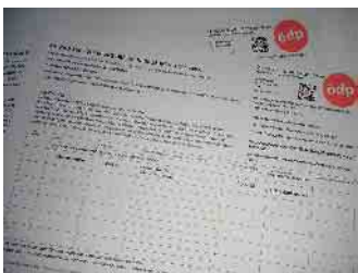
genehmigte Formulare für die Unterschriftensammlung

den, den Weg des Volksbegehrens rechtlich zu prüfen und - da dies möglich ist - nun auch tatsächlich zu beschreiten. Was wir hiermit tun.“ Ein vollständiges Verbot privater Feuerwerke sei rechtlich in NRW nicht durchsetzbar, betont Geibel. „Wir erkennen den gesellschaftlichen Wert gemeinschaftlicher Feiern durchaus an. Deshalb schlagen wir vor, dass es auch künftig für Feiernde Möglichkeiten geben soll, in einem klar abgegrenzten zeitlichen Rahmen und an von den Kommunen definierten Orten privates Feuerwerk zu zünden - jedoch ausschließlich unter strengen Regeln. Damit schaffen wir Rechtssicherheit, schützen die Allgemeinheit und geben gleichzeitig allen, die an Silvester nicht verzichten wollen, einen klar geregelten Raum.“ Die ÖDP verweist dabei auch auf die gravierenden Folgen, die jedes Jahr durch privates Feuerwerk entstehen: neben zahlreichen Brand- und Verletzungsfällen auch die enorme Belastung für Rettungskräfte und Polizei, die Feinstaubspitzen in den Städten, Lärm