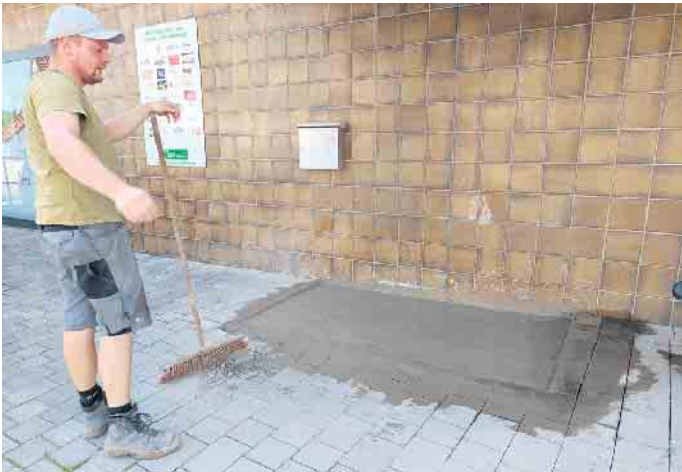
Das Team vom Mietpark Pereira hat uns das Fundament für den Automaten kostenlos erstellt.

sonderen Angebot, für den Kauf von zwei Säcke. Die Kartoffeln kann man sich aber auch direkt auf der Zunge zergehen lassen, denn die frisch zubereiteten Kartoffelspezialitäten können direkt vor Ort verzehrt oder mitgenommen werden. Es wird gebeten, einen Behälter mitzubringen. Einen weiteren kulinarischen Höhepunkt im Herbst bieten die herzhaften Spezialitäten der bayerischen Küche. So können sich die Kunden und Kundinnen am 4. Oktober, von 10 bis 13 Uhr, auf deftige Schweinshaxe und Leberkäse freuen - beides wird vor Ort angeboten und eignet sich bestens für eine gemütliche Mahlzeit im kleinen Kreis oder zum Mitnehmen nach Hause. Bei den Schweinshaxen bitten wir um Vorbestellung. Die Liste liegt im Dorfladen aus. Passend dazu gibt es am 24. Oktober, um 19 Uhr, eine Weinprobe im Historischen Rathaus mit dem Weingut Bungert und Mauer aus Ockenheim. Restkarten sind noch im Dorfladen erhältlich. Mit diesen Aktionen möchte der Dorfladen einmal mehr zeigen, dass er nicht nur Einkaufsmöglichkeiten bietet, sondern auch ein Treffpunkt für Genuss und Gemeinschaft ist. Ganz Dringenberg darf sich also auf ein Stück Herbstfreude vor der eigenen Haustür freuen. Und noch einmal alle Akti-