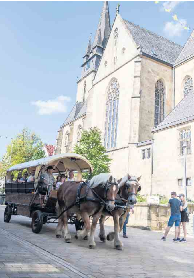
Auch die beliebten Planwagenfahrten werden am Sonntag wieder angeboten.