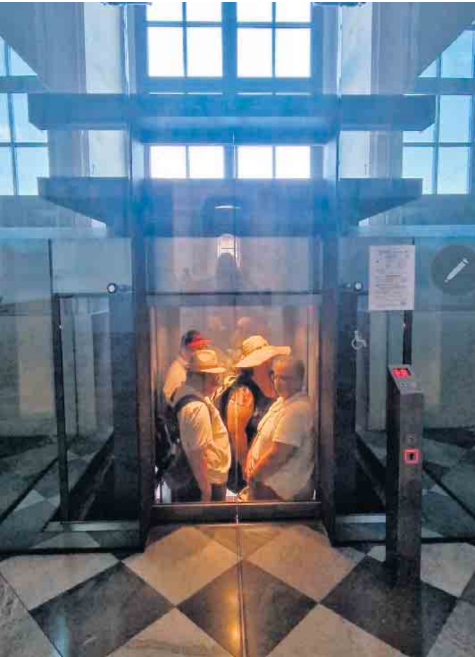
Mit einem Aufzug in die geschichtsträchtige Hofkirche

Hofkirche - Historisches Grünes Gewölbe - Pizzeria Aposto