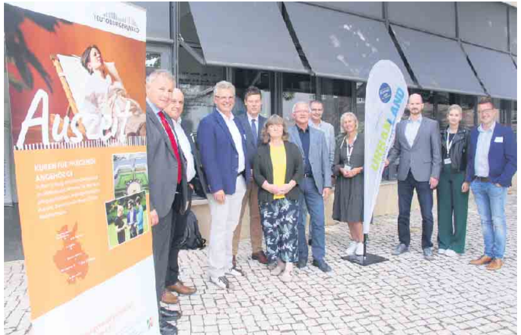
Die erste Fachtagung zum Thema Reha für pflegende Angehörige ist sehr erfolgreich verlaufen.

In Deutschland gibt es etwa vier Millionen pflegende Angehörige aller Alterstufen. Viele davon sind berufstätig. Die Vereinbarkeit von Pflege, Familie und Arbeit stellen eine hohe Belastung dar, die zu psychischer Überbelastung und körperlicher Erkrankung führen kann. Um die Gesundheit pflegender Angehörige zu fördern, haben sich derzeit vier Reha-Kliniken in OWL auf die Stärkung pflegender Angehöriger spezialisiert. Neben der Klinik Berlin in Bad Driburg werden solche Auszeiten auch im MZG in Bad Lippspringe, der Berolina Klinik in Bad Oeynhausen und der Rose Klinik in Horn-Bad Meinberg angeboten. Dabei soll es aber nicht bleiben. „Wir stellen uns vor, dass es bis 2024 in OWL sechs bis acht Klini-