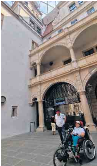
Unser IC 2 fährt in Dresden Hbf ein.

Der Einstieg ging dank Malteser und Bahnpersonal gut, jedoch gab es Verzögerungen während der Fahrt nach Hannover, sodass der Umstieg knapp war. Dank der Hilfe des dortigen Bahnpersonals klappte dieser aber zügig. Da das Rollstuhl-abteil in der S5 zu klein war, musste auf das Fahrradabteil ausgewichen werden. Die dort sitzenden Reisenden ohne Fahrrad mussten deswegen dann auch ihre Plätze räumen, was nicht jeden erfreute. Mit Verzögerungen fuhren die Reisenden dann nach Altenbeken. Dort funktionierte der Aufzug und auch die Heimfahrt mit den Autos und dem vereinseigenen Anhänger klappte problemlos. Besuchen Sie uns doch! An jedem 1. und 3. Freitag um 18 Uhr im Gemeindehaus der Evangelischen Kirche.