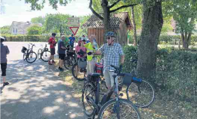
Trinkpause unter einer Schatten spendenden Baumkrone kurz vor Engar. Noch 11 km bis Warburg

Am Samstag, 13. August, haben sich 14 Teilnehmer auf dem Rathausplatz Bad Driburg zur sportlichen Radtour des Heimatvereins Bad Driburg eingefunden. Neben zwölf E-Bikes kamen auch ein Rennrad und ein Mountainbike ohne Hilfsantrieb zum Einsatz. Bei schönstem Sommerwetter - laut Vorhersage sollte eine Temperatur von 30 Grad erreicht werden - startete die Gruppe um 9.30 Uhr auf die von Hubert Kappenberg ausgearbeitete und geführte Radtour. Sie führte in die südliche Region des Kreises Höxter vorbei an der Antoniusklus nach Neuenheerse, über Willebadessen und Scherfede bis an die Diemelhalle in Rimbeck. Dort legte die Truppe