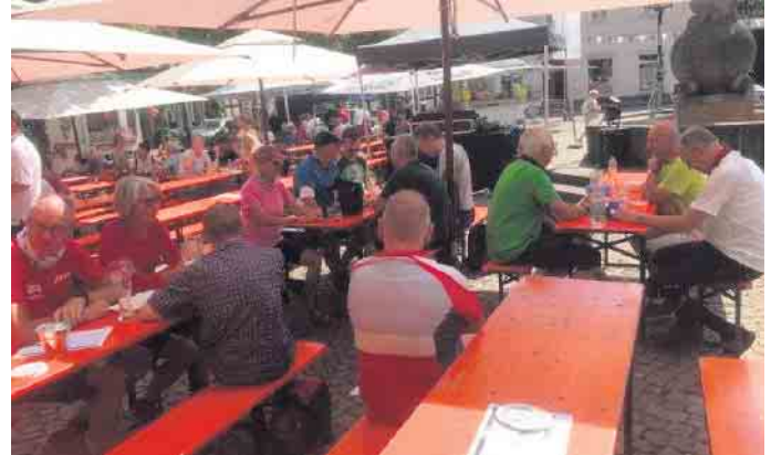
Auf dem Warburger Altstadtmarktplatz stärkten sich die Radler am vielfältigen Gastronomie-Angebot

bei steigender Temperatur die erste größere Pause ein, um sich mit kühlen Getränken zu erfrischen. Dann ging es weiter nach Warburg, wo die Warburger das Kälkenfest am Altstadtmarkt feierten. Der Marktplatz verfügte über ausreichend schattige Sitzmöglichkeiten und Gastronomie-Angebote, so dass sich die Radler zur Mittagspause hier mit leckeren Speisen und Getränken versorgen konnten. Nach gehöriger Ruhezeit war es um 13 Uhr Zeit zum Aufbruch. Die nächsten Orte am Tourenverlauf lauteten Peckelsheim, Niesen und Gehren, bevor das Weidenpalais-Cafe in Rheder zur letzten Pause angefahren wurde. Hier sorgten Kaffee,