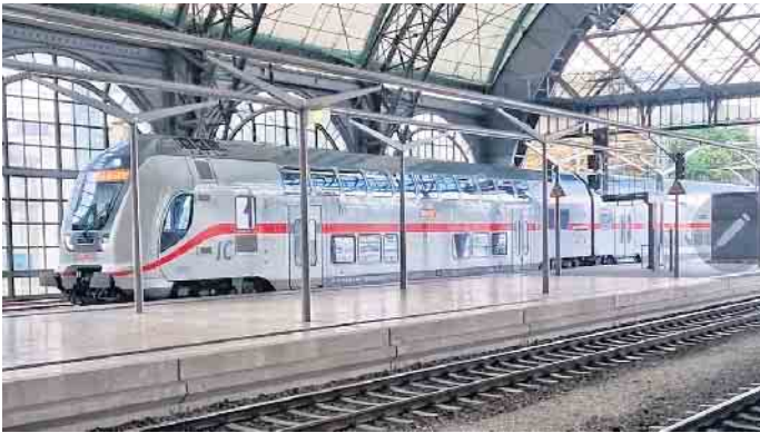
Auf dem Weg zum Historischen Grünen Gewölbe

Abwärts machte der Aufzug jedoch Probleme. Nun ging es zum Zwinger, der jedoch wie jeden Montag geschlossen war. Außerdem war dort bedauerlicherweise eine Baustelle. Am Historischen Grünen Gewölbe hingegen wurde eine Ausnahme mit Zeitkarten gemacht, da die Gruppe sonst zu groß gewesen wäre. Nach Abgabe von Handgepäck ging es durch eine Sicherheitsschleuse