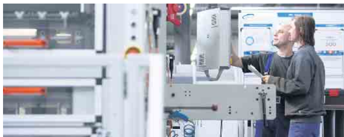
Ausbildung an hochmodernen Produktionsmaschinen in der Faltschachtel-Industrie.

Interessant ist dabei vor allem eine Karriere in der Faltschachtel-Industrie. Karton wird aus nachwachsenden Rohstoffen gewonnen und lässt sich sehr gut recyceln. Karton-Verpackungen gehört die Zukunft, weil die Politik mehr Engagement für den Klimaschutz einfordert und daher nachhaltige Produktion, Recycling und Kreislaufwirtschaft fördert. Vor allem Lebensmittelhersteller ersetzen daher zunehmend Plastik durch papierbasierte Verpackungslösungen - hier sind ständig entsprechende Innovationen gefragt. Eine Tätigkeit in der Faltschachtel-Industrie ist deshalb nicht nur kreativ, sondern wegen der Systemrelevanz