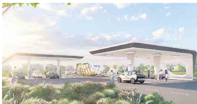
Die Tankstelle der Zukunft.

An der Brakeler Straße in Bad Driburg soll auf einem Grundstück neben Zweirad24 eine Tankstelle der Zukunft entstehen. Das ist eine Tankstelle, an der Elektroautos innerhalb kürzester Zeit aufgeladen werden können. Der Ausschuss für Wirtschaftsförderung, Stadtmarketing und -entwicklung hat jetzt beschlossen, das Grundstück langfristig für den Betrieb einer sogenannten HPC-Schnellladeinfrastruktur freizugeben. „Es ist uns natürlich ein Anliegen, dass die E-Autos vor Ort in Bad Driburg aufgeladen werden können. Der Trend zur E-Mobilität ist deutlich sichtbar und soll auch in Bad Driburg stattfinden.