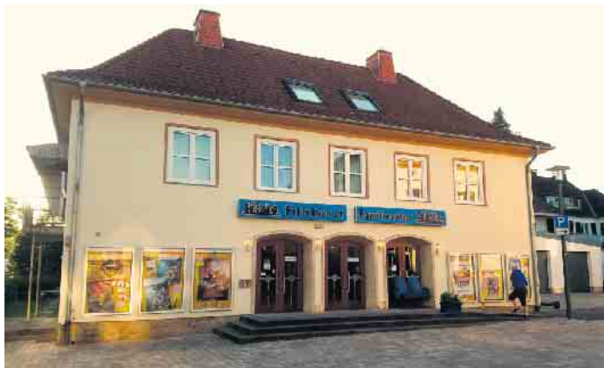
Kino Bad Driburg.

Ein schöner Start in den Herbst. Das Seniorenkino startet wieder nach der Sommerpause. Am Donnerstag, 18. September, wird im Kino Bad Driburg der Film „Wenn der Herbst naht“ gezeigt. Beginn ist um 14 Uhr. Im Anschluss besteht die Möglichkeit, den Nachmittag bei Kaffee und Gesprächen im nahegelegenen Café-Restaurant „Vier Jahreszeiten“ des Seniorenparks Carpe Diem gemütlich ausklingen zu lassen. Die nächste Veranstaltung ist für den 16. Oktober geplant. Kurze Info zum Film: Im idyllischen