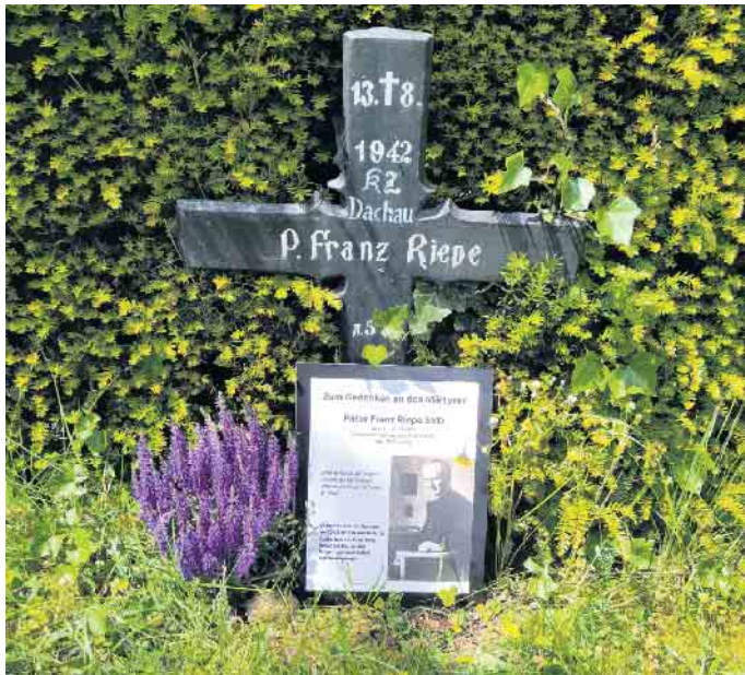
Das Grab des mutigen Pater Riepe auf dem Friedhof des Missionshauses.

Der Friedhof der Patres und die Gebets-Grotte werden unter Schutz gestellt