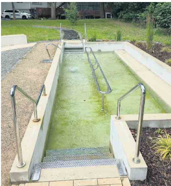
Das Tretbecken im Rest des Eggelandparks bereitet Sorgen.