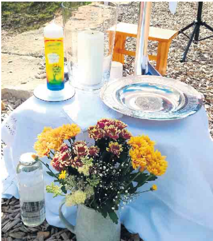
Die Taufkerze steht bereit.

Kraftquellen für den Alltag, der mit dem Ende der Sommerferien wieder beginnt. Unter den Besuchern waren auch Schulanfänger, die in einen neuen Lebensabschnitt starten. Ein herzlicher Dank galt allen Helferinnen und Helfern - für Technik, Musik, Bänke, Organisation und Vorbereitung. Viele Hände haben diesen Gottesdienst zu einem gelungenen Ereignis gemacht. Die Sommerkirche in Reelsen war Teil einer Reihe von Freiluftgottesdiensten in der Region, die auch in Dringenberg, Herste, Bad Driburg und Altenbeken stattfanden. Nicht immer spielte das Wetter mit - beispielsweise beim ursprünglich im Eggelandpark geplanten Gottesdienst in Bad Driburg, der wegen Regens verlegt werden musste. Umso schöner war es, dass das Wetter in Reelsen diesmal ideal war und der Gottesdienst in einer Atmosphäre von Sonne, Musik, Gemeinschaft und Inspiration gefeiert werden konnte. Text: Doris Dietrich