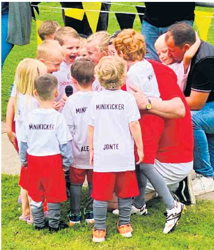
„Teambesprechung“ der Minikicker

fanden sich spontan einige Teams zum Spiel für Jedermann zusammen. In kniffligen Aufgaben und lustiger Runde konnten sie ihr Geschick unter Beweis stellen. Die dann folgende Vorstellung der neuen Minikicker in eigenen Trikots war ein echter Höhepunkt des Festets. Das Programm wurde durch spannende Einlagespiele des F.-C. und B.-Jugend komplettiert. Bis zum nächsten Jahr!