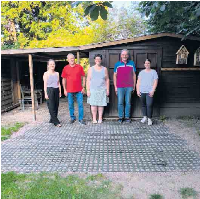
Matsch adé - dank neuer Gummimatten

Die Seniorinnen und Senioren aus Dringenberg und aus den angrenzenden Ortschaften treffen sich am Mittwoch, 11. September (zweiter Mittwoch im Monat, in der Gaststätte „Zum Goldenen Anker“. Alle Personen sind herzlich willkommen bei Kaffee und