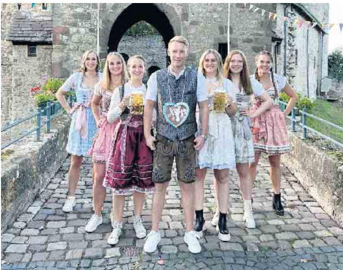
Der traditionelle Bayerische Abend im Schatten der Burg steht an

sorgt die Blaskapelle „Eggeländer Böhmisches“ für zünftige Bayerische Musik zum Mitschunkeln. Ab 22 Uhr startet dann die große Wiesen Gaudi mit DJ Martin. Mit stimmungsvollen Liedern und Partyhits wird er für brodelnde Stimmung und eine volle Tanzfläche sorgen. Natürlich sind wieder alle Gäste aufgerufen in Dirndl und Lederhosen für die richtige Wiesen-Atmosphäre zu sorgen. Ein „Pre-Opening“ mit Faßbieranstich gibt es bereits am Freitag, 12. September, ab 18 Uhr, mit dem Kreispokal der Alte Herren gegen die SG Peckelsheim sowie ab 20 Uhr die Partie unserer Zweiten gegen den SV Alhausen/Pömben.