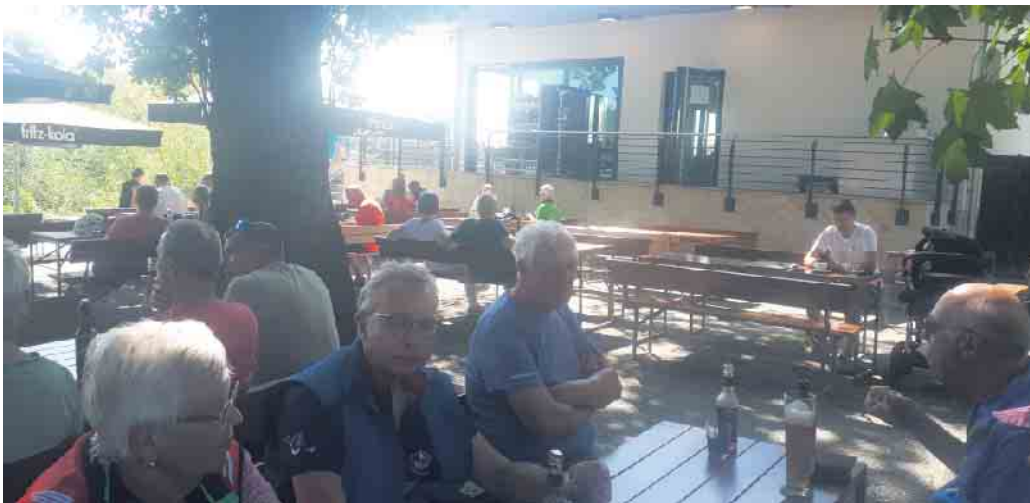
Im Schatten der Bäume am Pier 1 legte die Radfahrergruppe ihre Mittagspause ein.

Am 24. August versammelten sich 22 Radfahrer zu einer vom Heimatverein Bad Driburg organisierten 85 Kilometer langen Tour durch den Kreis Höxter. Dabei waren 21 E-Bikes und ein Trekkingrad. Um 9.30 Uhr startete die Gruppe vom Bad Driburger Rathaus. Als erstes wurde der neue Radweg nach Reelsen unter die Räder genommen und für gut