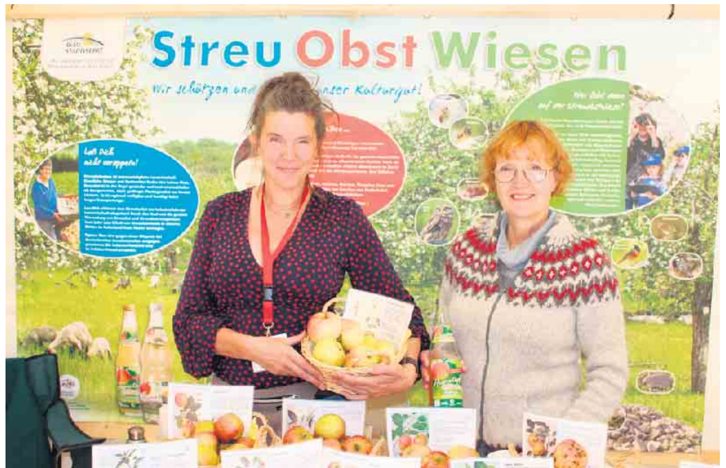
Informationen und Kostproben alter Apfelsorten gibt es am Stand der regionalen Obstexpertinnen.

Für Sonntag, den 14. September haben sich wieder weit über 90 Marktteilnehmer angemeldet. Sie freuen sich darauf ihre Handwerkskunst vorzuführen und ihre Produkte aus eigenem Anbau oder Herstellung anbieten zu können. So wird für jeden was dabei sein, ob er nun nach Holzkunst, Honig, Wildbratwurst oder einer Bürste sucht, neue Hanfprodukte kennenlernen möchte, einen Schal oder ein schönes Dekoelement braucht oder ganz einfach sein Kräuter- und Essigreservoir auffüllen möchte. Das Orgateam freut sich in diesem Jahr die Solidarische Landwirtschaft ( SoLaWi ) aus Dalborn begrüßen zu dürfen, die ihr Konzept an einem Infostand vorstellt. Es gibt auch in Steinheim eine Abholstation für die Gemüseketten. Die Forellenzucht Springborn ist das erste Mal dabei und wird bei gutem Wetter frisch vor Ort räuchern. Zum ersten Mal wird die Bäckerei Mellies aus Bad Meinberg im Holzbackofen vor Ort frisches Brot backen und Kuchen und andere Leckereien anbieten. Den ganzen Tag kann man sich mit leckerem Kuchen, handgemach-