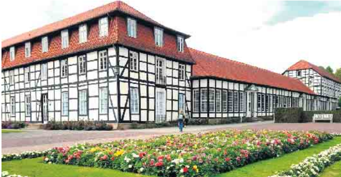
Teilnehmer waren begeistert vom gepflegten Park.