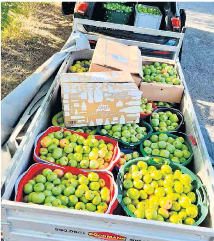
Aus den Äpfeln der heimischen Streuobstwiesen wird köstlicher Apfelsaft hergestellt.

schließend in den lokalen Geschäften unter dem Namen „Heimatapfel“ veräußert. Ein besonderer Nachhaltigkeitsaspekt dieser Direktvermarktung besteht darin, dass mit dem Kauf jeder Flasche Heimatapfelschorle acht Cent in die Pflege der Streuobstwiesen im Kreis Höxter fließen. Damit wird ein wichtiger Betrag zum Erhalt des wertvollen Kulturgutes in der Region geleistet.