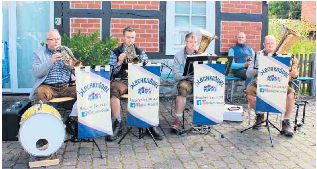
Die „Blechknödel“ sorgen für gute Unterhaltung.

In diesem Jahr gibt es auch wieder einen Übersichtsplan für die Westentasche , damit sich alle Besucher auf dem Markt in den verwinkelten Gassen und mit den Parkplätzen gut zurechtfinden sowie einen Überblick über das kulinarische Angebot bekommen.