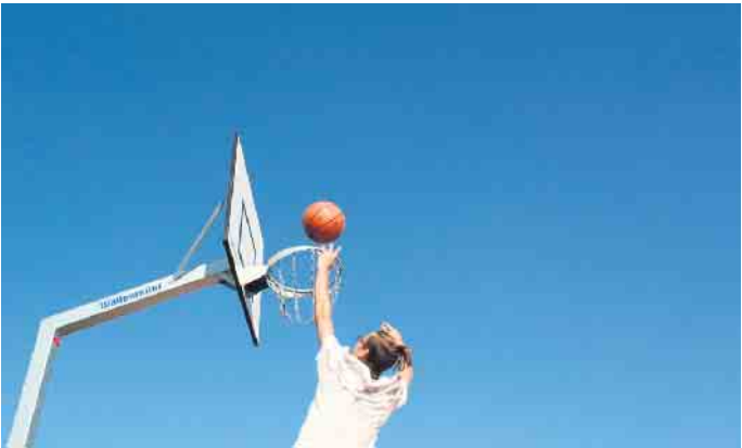
„Spaß am Ballsport“ wird vermittelt am 17. September.

Bereits der August war ein Monat voller Abenteuer für die Kinder von Bad Driburg, doch auch im September gibt es noch viele weitere Bad Driburg-Erlebnisse für die Kleinen. Verschiedene Vereine, Höfe und Unternehmen bieten den Familien der Stadt Aktivitäten aus den Bereichen Sport und Gesundheit, Tiere und Natur, Museen und