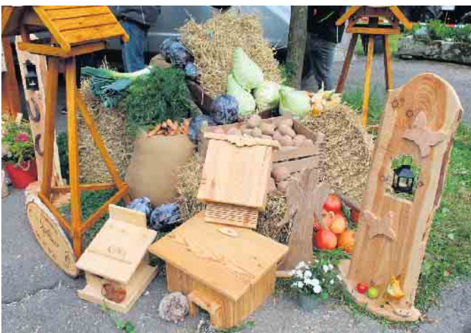
Hübsche Arrangements von Kunsthandwerk und Naturprodukten sind auf dem Bauernmarkt immer ein Hingucker und Publikumsmagnet.

Das Autohaus Henning wird am 14. September von 10.00-18.00 Uhr einen Shuttleverkehr einrichten, um Marktbesucher ab Parkplatz des Autohauses Henning an der Billerbecker Str. nach Ottenhausen zu befördern. 2 Kleinbusse stehen hierzu zur Verfügung. Für die besonders schöne Dekoration des Marktes, das umfangreiche Kinder- und Musikprogramm und für die steuerlichen Verpflichtungen einer solchen Veranstaltung wird am Markttag ein Eintritt von 4,00 Euro für Erwachsene erhoben. Kinder haben freien Eintritt und die Parkplätze stehen auch kostenlos zur Verfügung.