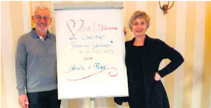
Amelie Fried und Peter Probst