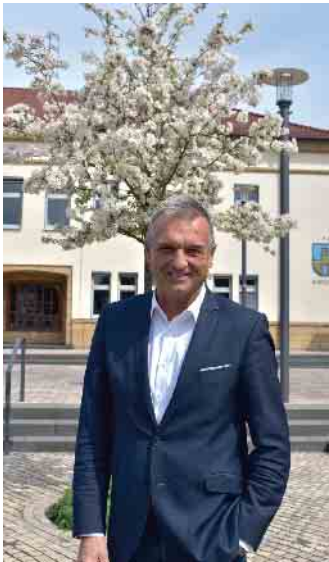
Ihr Burkhard Deppe Bürgermeister

Die beiden städtischen Freibäder in Bad Driburg an der Brunnenstraße und in Neuenheerse schließen am 8. September. Bis dahin hoffen die Bäderteams noch auf einige schöne Sonnentage mit zahlreichen schwimmfreudigen Gästen! Unmittelbar am 9. September öffnet dann das städtische Hallenbad, worauf die Schulen und Vereine bereits warten.