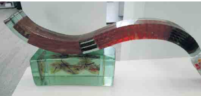
Red Wave 2024. Fusing mit Gold, Lüsterfarben und Farbfritten