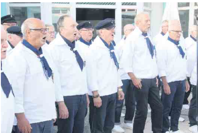
Der bekannte Magellan Shanty-Chor aus Paderborn sorgt mit Seemannsliedern für stimmungsvolle Unterhaltung.