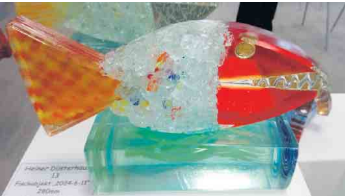
Fischobjekt 2024. Fusing mit Gold, Platin und Farbfritten