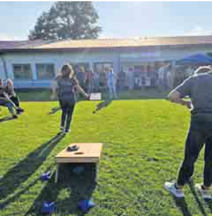
Auch in diesem Jahr werden wieder die RWA-Corne-Hole-Meister ermittelt

genheit, um zusammen mit der Dorfgemeinschaft und Gästen einen unvergesslichen Tag zu erleben. Lasst euch dieses Event nicht entgehen! Mehr Infos auf www.reelsen.de .