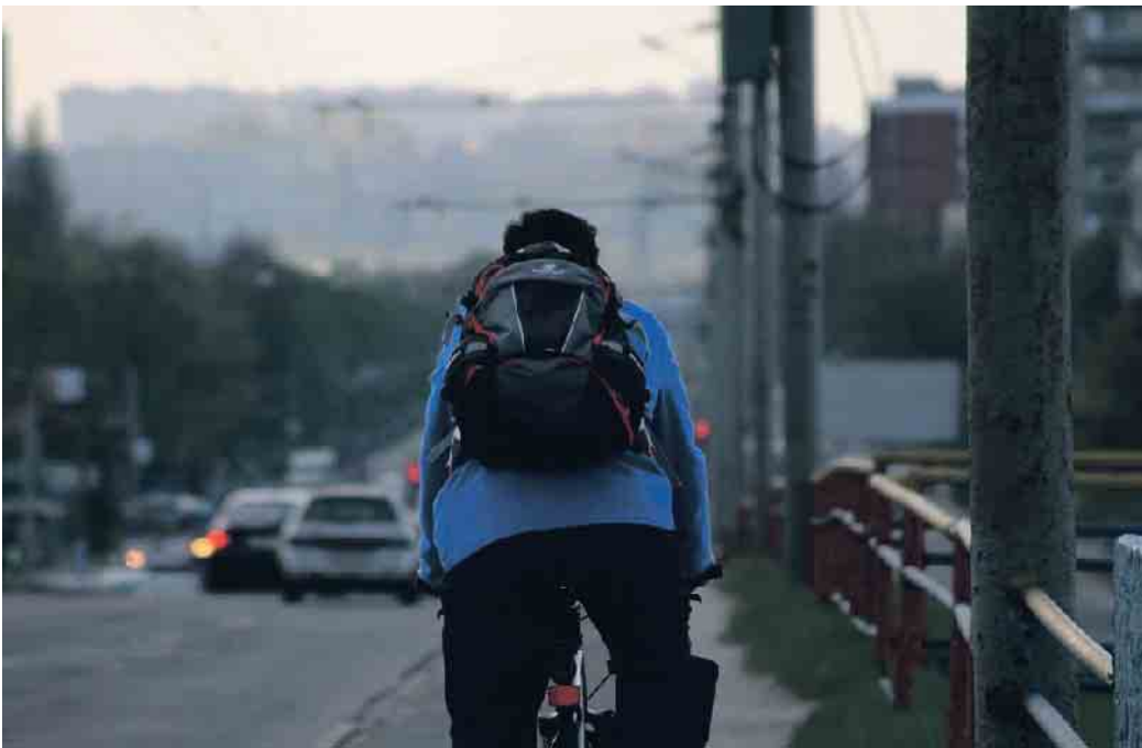
Zum Schutz aller Verkehrsteilnehmer bedarf es mehr gegenseitiger Rücksichtnahme.

Nach wie vor sind Autos die größte Gefahr für Radfahrer. Dabei lassen sich viele Unfälle - vor allem die sogenannten Dooring-Unfälle - bereits durch einfache Maßnahmen und mehr gegenseitige Rücksichtnahme im Verkehr verhindern. Allein in Berlin kommt es seit 2018 statistisch gesehen jeden Tag zu mindestens einem „Dooring-Unfall“, dem Zusammenstoß eines Radfahrers mit der sich öffnenden Tür eines parkenden Autos. Der kann für Radfahrende mit schweren Verletzungen - in einigen Fällen sogar tödlich - enden. Radfahrende selbst können einen Dooring-Unfall nur schwer verhindern. Viele Radwege in der Stadt führen direkt an parkenden Autos vorbei. Bei einer Geschwindigkeit von 20 km/h müssten Radfahrende ca. elf Meter im Voraus sehen, dass jemand aus dem Auto steigen möchte, um noch rechtzeitig bremsen zu können. Wer auf dem Fahrrad sitzt, kann daher oft nur versuchen, das Risiko eines Unfalls zu mindern. Der ACE empfiehlt Radfahrenden - wenn möglich - immer mind. 80 cm Abstand zu den Autos am Straßenrand einzuhalten, damit eine aufgehende Tür sie gar nicht erst berühren kann. Außerdem gilt es, aufmerksam auf Anzeichen wie eingeschlagene Räder, Brems- und Rückleuchten bei parkenden Autos zu achten. Auch sichtbare Kleidung und Reflektoren sind hilfreich, um nicht übersehen zu werden. Dooring-Unfälle verhindern können vor allem diejenigen, die die Autotür öffnen. Beim Aussteigen sollten sie grundsätzlich immer zuerst in den Seitenspiegel und dann über die Schulter schauen,