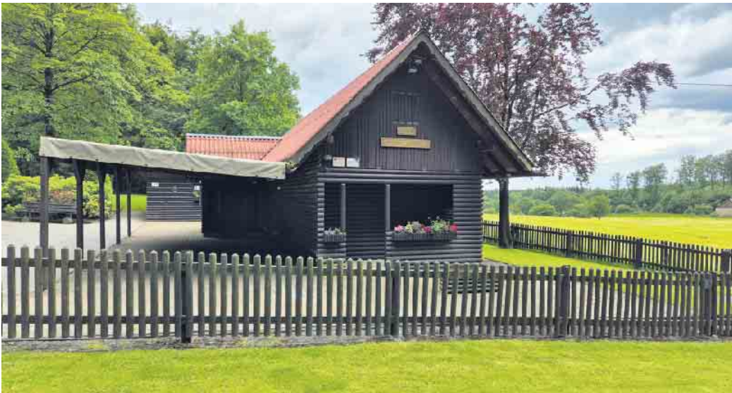
Driburger Hütte des EGS - Ziel der Wanderung

Am Sonntag, 15. September, schnüren die TV'ler wieder einmal die Wanderschuhe und erkunden gemeinsam die wunderschöne Natur rund um Bad Driburg. Egal ob Wanderprofi oder gemütlicher Spaziergänger, bei dieser Tour ist für jeden etwas dabei. Ziel wird die Driburger Hütte des EGV sein. Gestartet wird um 12 Uhr auf dem Schützenplatz. Eine weitere Einstiegsmöglichkeit besteht auf Höhe des Trappistenhofes gegen 13 Uhr, wo eine Rast vorgesehen ist. In und um die Driburger Hütte erwarten die Wanderfreunde dann Kuchen, Gegrilltes, erfrischende Getränke und für die Jüngsten ein „Spiel ohne Grenzen“. Selbstverständlich besteht auch die Möglichkeit, direkt zur Driburger Hütte zu kommen. Der Kostenbeitrag beträgt 5 Euro für Erwachsene und 2 Euro für Kinder. Für eine Rückfahrmöglichkeit wird seitens des Vereins gesorgt. Um verbindliche Anmeldung und Zahlung des Kostenbeitrages bis