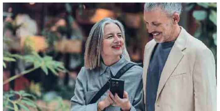
Egal ob man allein oder zu zweit unterwegs ist, ein No-Panic-Button am Smartphone kann zum Lebensretter werden.