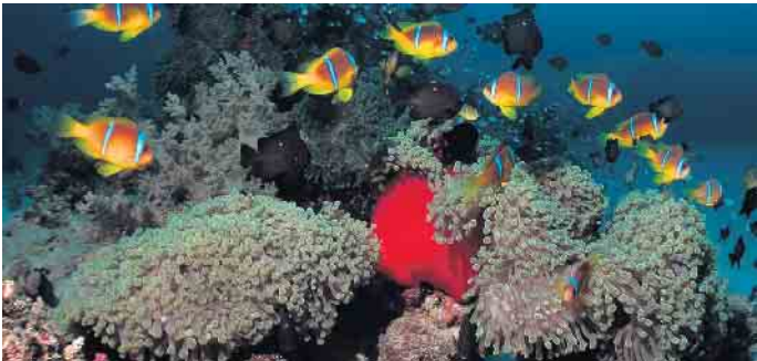
Faszinierende Unterwasserwelt

die kleinen und großen Bad Driburger und Gäste“, informierte Friedhelm Macke im Gespräch. Die Glaskünstlerin Ingrid Heuchel wird im Rahmen des Glasstadtfestes eine Bastelaktion für Kinder anbieten. Der Eintritt ist frei. Spenden werden gern gesehen. Text: Doris Dietrich