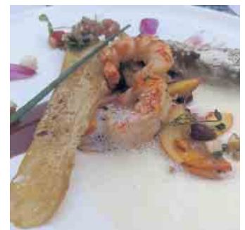
Ein Thunfisch-Garnelen-Salat bildet die Vorspeise zum Captains Dinner.