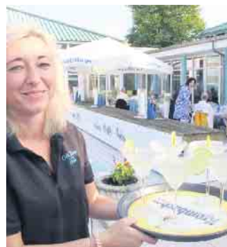
Am Beckenrand werden leckere Cocktails serviert.