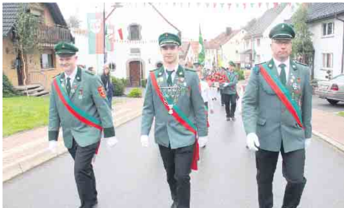
Kühlsen feiert ein strahlendes Schützenfest.