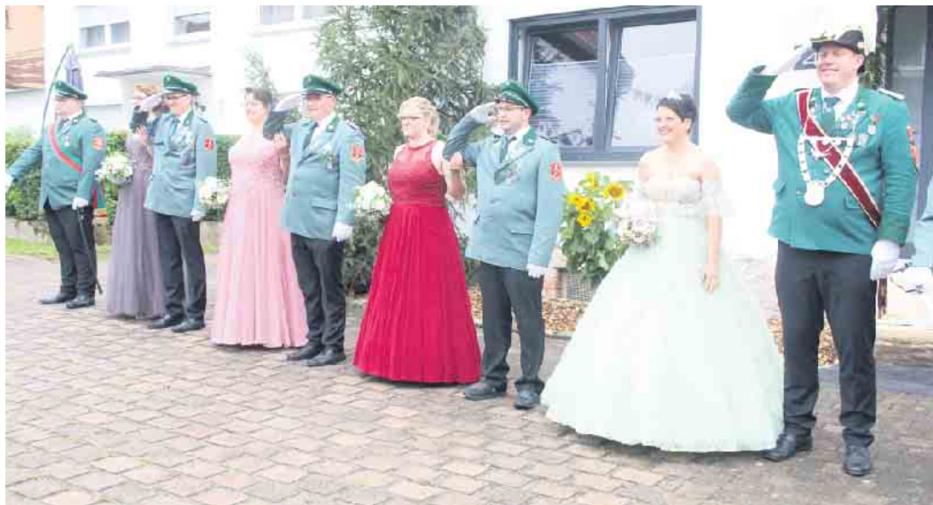
Majestäten und Hofstaat präsentieren sich dem Schützenvolk.