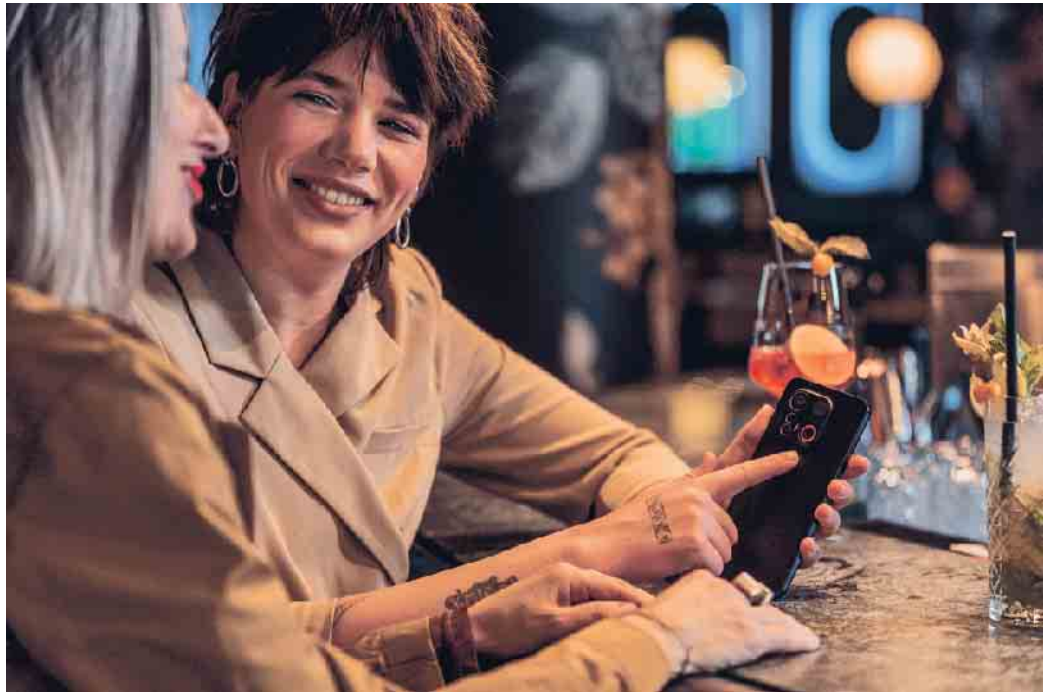
Der No-Panic-Button an der Rückseite des Smartphones gibt Sicherheit, zum Beispiel abends auf dem Nachhauseweg.

Das kann besonders dann hilfreich sein, wenn man eine einsame Gipfeltour plant oder wenn man nachts allein nach Hause geht