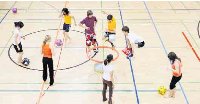
Beim Open Sunday am 22. September verwandelt sich die Großturnhalle in eine Bewegungslandschaft

„Vom Apfel zum Saft“ heißt es am 28. September auf dem Apfel-Lehrpfad in Herste. Ebenfalls am 28. September aber nachmittags beantwortet die Firma Playparc die Frage: „Wie entsteht ein Spielplatz?“ Eltern und Kinder zwischen 6 - 12 Jahren sind herzlich eingeladen zu einer spannenden