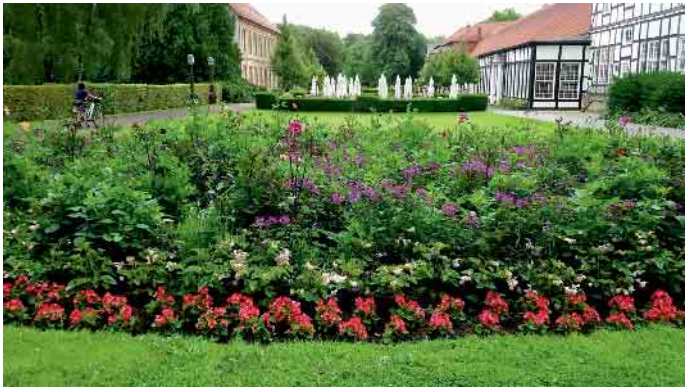
Der gepflegte Gräfliche Park gefiel allen Teilnehmern sehr.

Im Gespräch erzählte die Teilnehmerin begeistert: „Das Ambiente des Gräflichen Parks ist einmalig. Die gepflegten Blumenrabatten und der alte Baumbestand haben mir sehr