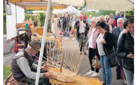
Bei Korbflechterei Nübel wird echte Handwerks- kunst gezeigt.