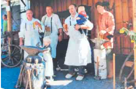
Schmiede der Familie Otto

Größter und schönster Markt in der Region am Sonntag, 15. September 2024