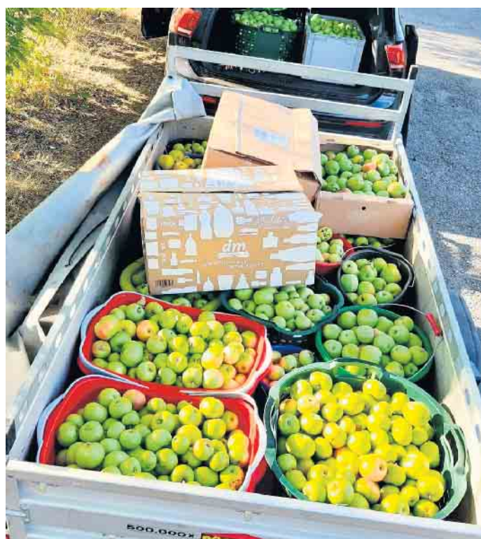
Aus den Äpfeln der heimischen Streuobstwiesen wird köstlicher Apfelsaft hergestellt.

informieren. Das bisher nicht genutzte Streuobst soll durch das Projekt „Heimatapfel“ neu „In-Wert gesetzt“ werden und wird zu einem leckeren Direkt-Apfelsaft und zu weiteren regionalen „Heimatapfel-Produkten“ verwertet. Von jeder Flasche fließen 8 Cent in den Erhalt und die Pflege der Streuobstwiesen im Kreis Höxter. Hierfür haben sich Streuobstakteure und Streuobstwiesenberaterinnen und -Berater aus dem gesamten Kreis Höxter zusammengeschlossen!