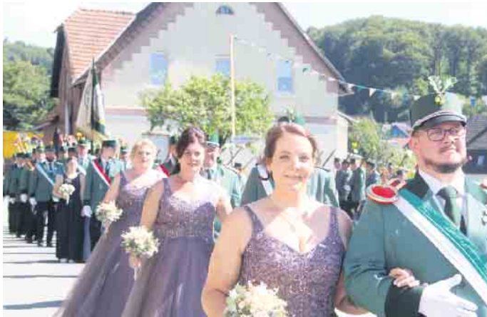
Ein prachtvoller Hofstaat begleitet das Königspaar.