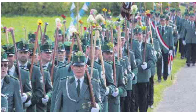
Imposanter Aufmarsch der Schützen zur Abholung des Königspaares.