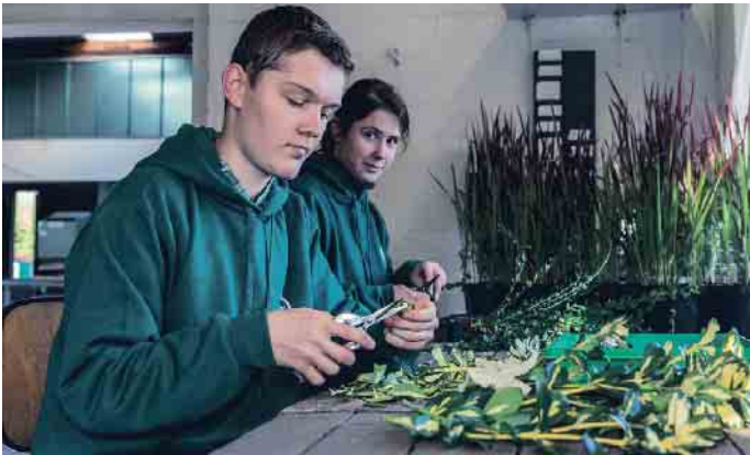
Abwechslungsreich und wichtig für die Zukunft: Ausbildung zum Baumschulgärtner.

Mit einem Blick auf die Klimaveränderungen wird deutlich, wie wichtig es ist, Städte zu begrünen und nachhaltige Lösungen für die Umwelt zu schaffen. Die Ausbildung zum Baumschulgärtner eröffnet dabei einen faszinierenden Berufszweig, der nicht nur abwechslungsreich, sondern auch von großer Bedeutung für unsere Zukunft ist.