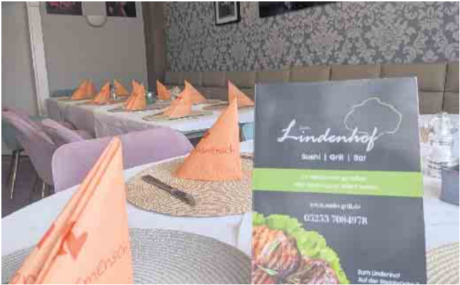
Innen ist das Restaurant frisch renoviert und ansprechend umgestaltet worden.