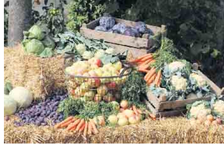
Immer wieder eine Augenweide - liebevoll dekoriertes Obst und Gemüse.