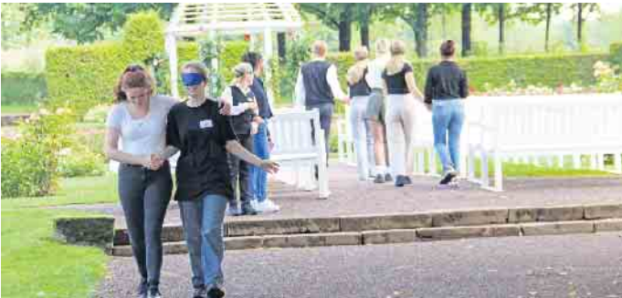
Teambuilding macht es möglich: Kennenlernen und Vertrauen für ein gutes Betriebsklima

Fünf neue Auszubildende starten im Gräflichen Park