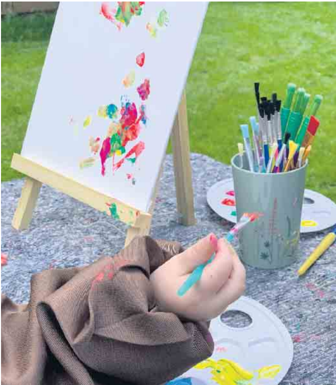
Bei der Waldfreizeit Uhlenmühle erleben Kinder eine inspirierende Zeit in der Natur. Hier können sie ihrer Kreativität freien Lauf lassen und die Welt mit allen Sinnen entdecken - sei es beim Basteln, Spielen, Forschen oder Kindergeburtstag feiern im Wald.

burgen von „Abenteuer Hüpfburg“ verwandeln jedes Fest in ein unvergessliches Ereignis. Doch nicht nur Kinder kommen hier auf ihre Kosten. Auch bei Firmenevents, Sommerfesten oder Stadtfesten sorgen die kreativen Angebote des Unternehmens für Begeisterung. Neben Hüpfburgen bietet Abenteuer Hüpfburg auch Rutschen, Fußball-Darts, einen Bungee Run sowie eine Vielzahl an Spielen, die stundenlangen Spaß garantieren. Eine gelungene Feier erfordert mehr als nur eine Hüpfburg. Deshalb bietet „Abenteuer Hüpfburg“ eine breite Auswahl an Party-Extras, die jedes Event perfekt abrunden. Ob Popcorn-