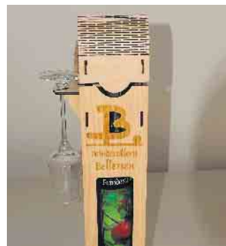
Süffige Geschenke in individuell hergestellten Verpackungen: Das Bellerse Brenn-Team machts möglich! Wer's nicht glaubt, kann sich beim Nieheimer Käsemarkt selbst überzeugen.