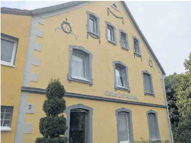
Die Fassade des Traditionsgasthofs in Alhausen ist unverändert.

Geöffnet ist der Lindenhof mittwochs bis sonntags ab 17 Uhr. Montag und Dienstag ist Ruhetag. Kontakt: Zum Lindenhof, Auf der Steinbrücke 2 in Bad Driburg-Alhausen, Tel. 05253 7084978, Mail: info@sushi-grill.de, www.sushi-grill.de