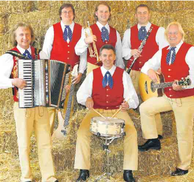
Die Original Steigerwälder aus Franken bringen in kleiner Besetzung einen Hauch Bayern nach Ostwestfalen bei der Bayrischen Sommernacht im Hotel am Park am 28. August.

Hotel am Park lädt zur dritten Bad Driburger Sommernacht ein