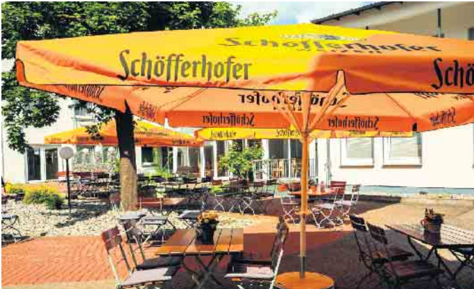
Der gemütliche Biergarten im Hotel am Park lädt zu gemütlichen Stunden ein.

eigenes à-la-carte Restaurant und man weiß dort, wie es sich richtig feiern lässt. Denn nicht umsonst war das Hotel am Park 2025 die offizielle Prinzenburg der Karnevalsgesellschaft Rot-Weiße Garde Bad Driburg. Für das richtige