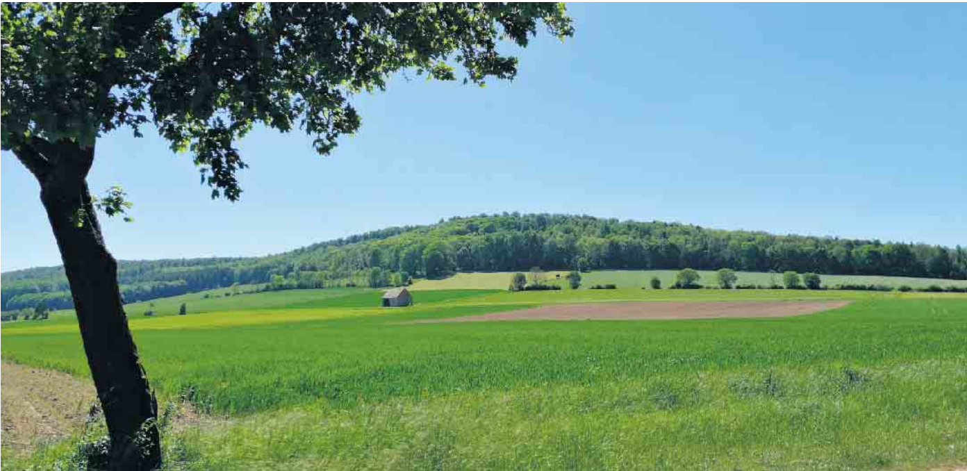
Vom Donhauser Kreuz hat der Wanderer einen schönen Blick in die Landschaft Richtung Kohlberg. Bericht auf Seite 5