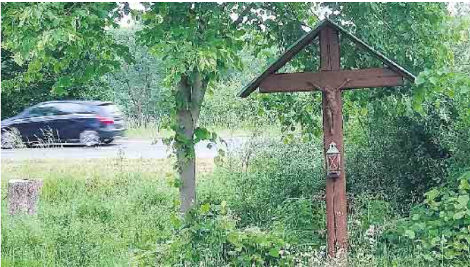
Das Donhauser Kreuz steht an der alten Trasse parallel zur Bundesstraße 64.

Bad Driburg/Herste. In Richtung Donhausen führt ein idyllischer Weg entlang der Hilgenbachaue. Viele Spaziergänger und Radfahrer nutzen diese beliebte Strecke. 2021 wurde der Weg verbreitert und erneuert. Man fährt an der Josefsmühle vorbei und kommt nach einer kurzen Strecke auf der alten Trasse parallel zur heutigen Bundesstraße 64 zum Donhauser Kreuz. Auch Wanderer sind hier oft unterwegs und machen dort gern eine Pause. Eine kleine Bank lädt zum Verweilen ein. „Ich halte gern am Kreuz. Ich sitze auf der Bank und bin ganz für mich inmitten der schönen Natur“, so eine Bad Driburgerin im Gespräch. Das Donhauser Kreuz ist ein schlichtes robustes Holzkreuz mit einem kleinen Korpus. Ursprünglich stand es gegenüber der Ausfahrt vom Gut Donhausen an der alten Reichsstraße. Es musste jedoch 1936 versetzt werden, weil die Straße an dieser Stelle begradigt wurde. Durch das Gewohnheitsrecht hatten die Besitzer des Gutes Donhausen Anspruch darauf, das Kreuz immer in der Nähe