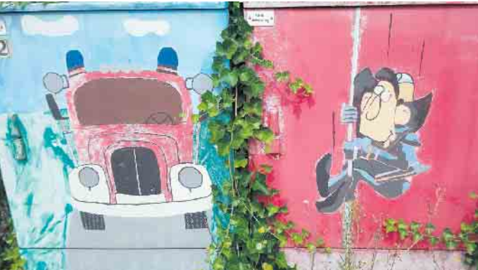
Die Stromkästen sind der Freiwilligen Feuerwehr Bad Driburg gewidmet.