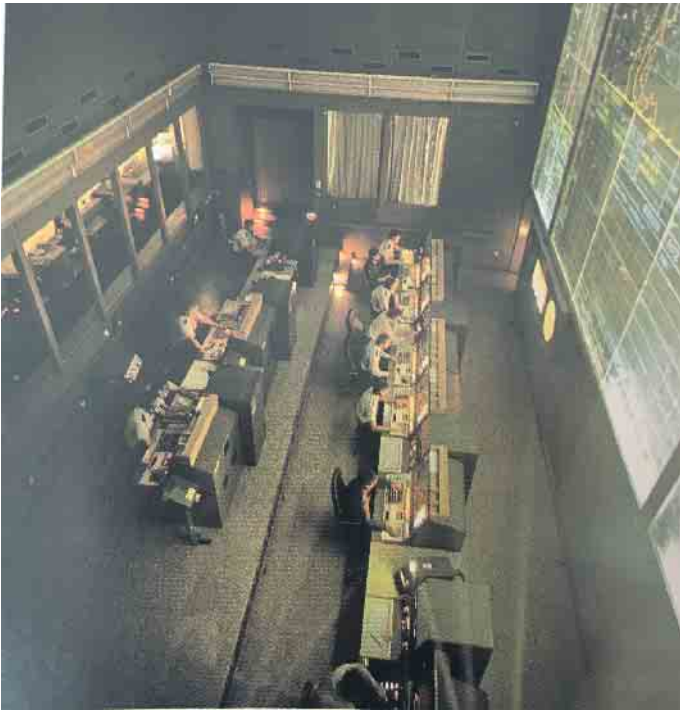
Die Ausstellung gewährt interessante Einblicke.

NATO-Luftverteidigung von den Anfängen bis 1993