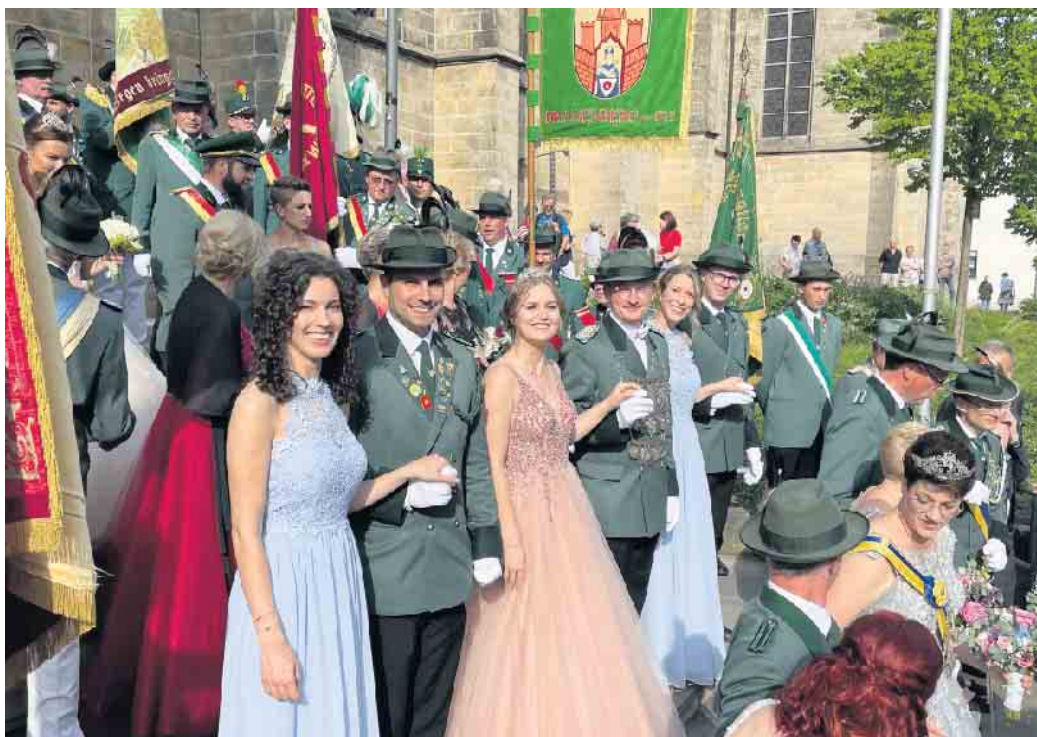
Bei strahlendem Sonnenschein präsentiert sich der Jungschützenhofstaat für das offizielle Foto auf der Kirchentreppe.