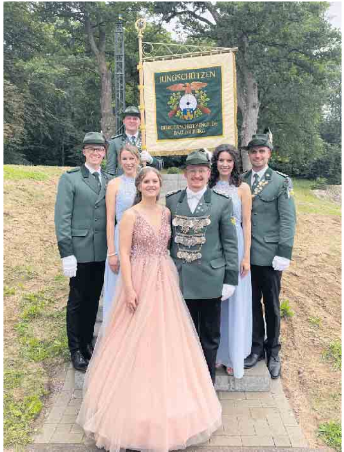
Der Zahl Jungschützen in der Bürgerschützengilde Bad Driburg wird immer größer. Umso wichtiger ist es, diese mit einzubinden und für die Zukunft zu stärken.

einmal wieder gezeigt: es geht ja doch! Wenn wir eins gezeigt haben, dann, dass wir verdammt gut zusammen feiern können! Spätestens als am Sonntag die offiziellen Punkte abgehakt waren und der kurze Blick in die Runde eine eindeutige Sprache gesprochen hat, war klar: dieses Wochenende kann uns niemand mehr nehmen!