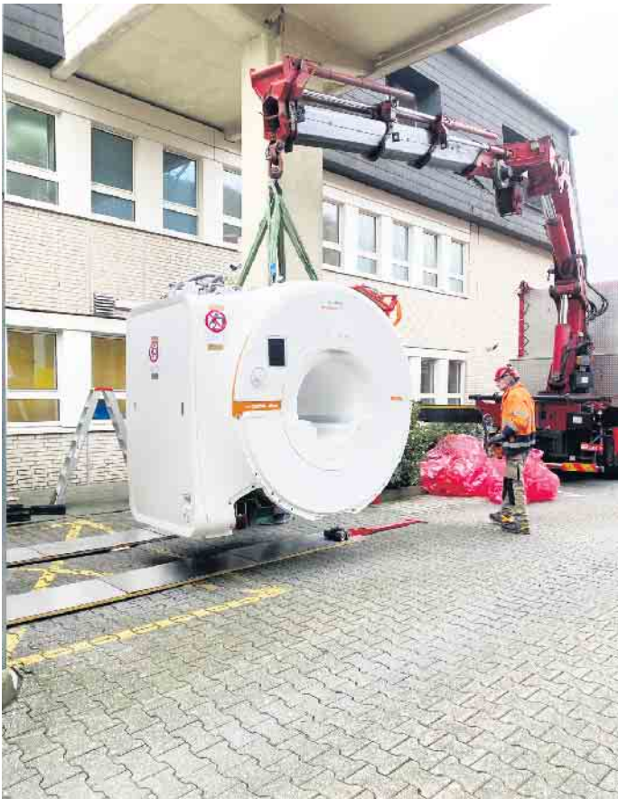
Bereits vor einigen Wochen wird das neue MRT mit einem Schwerlastkran angeliefert.