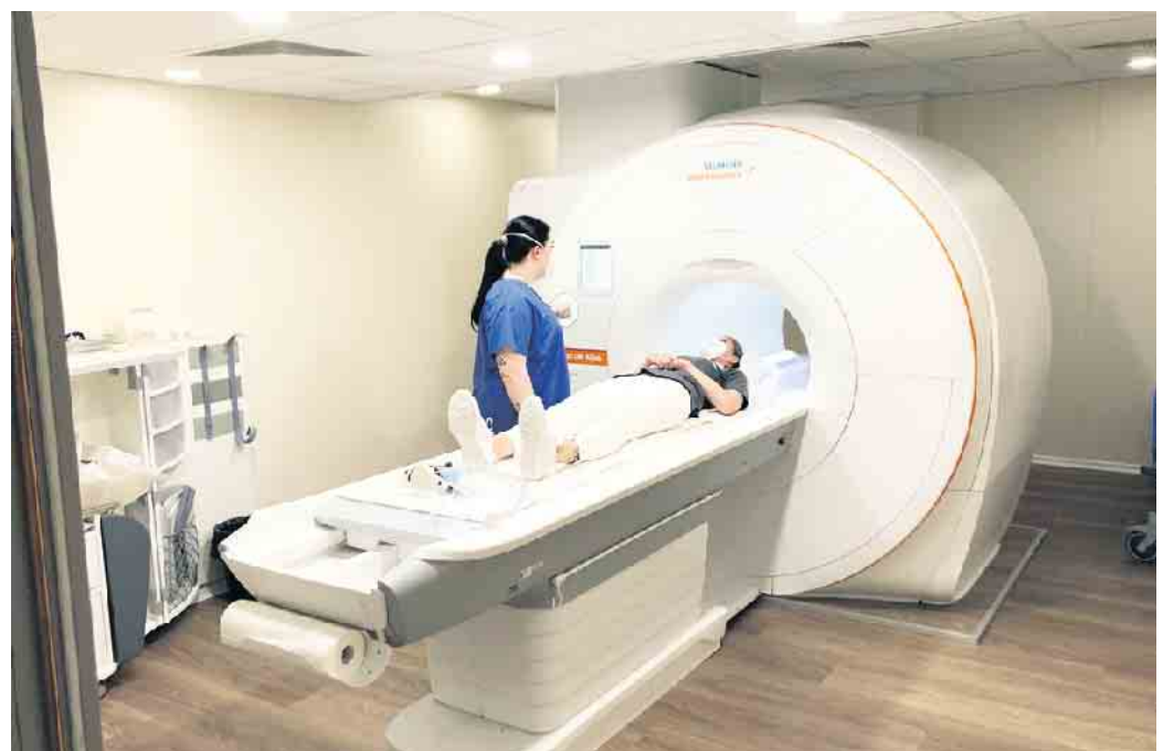
Mit dem neuen CT kann die Untersuchungszeit für die stationären Patienten erheblich verkürzt werden.