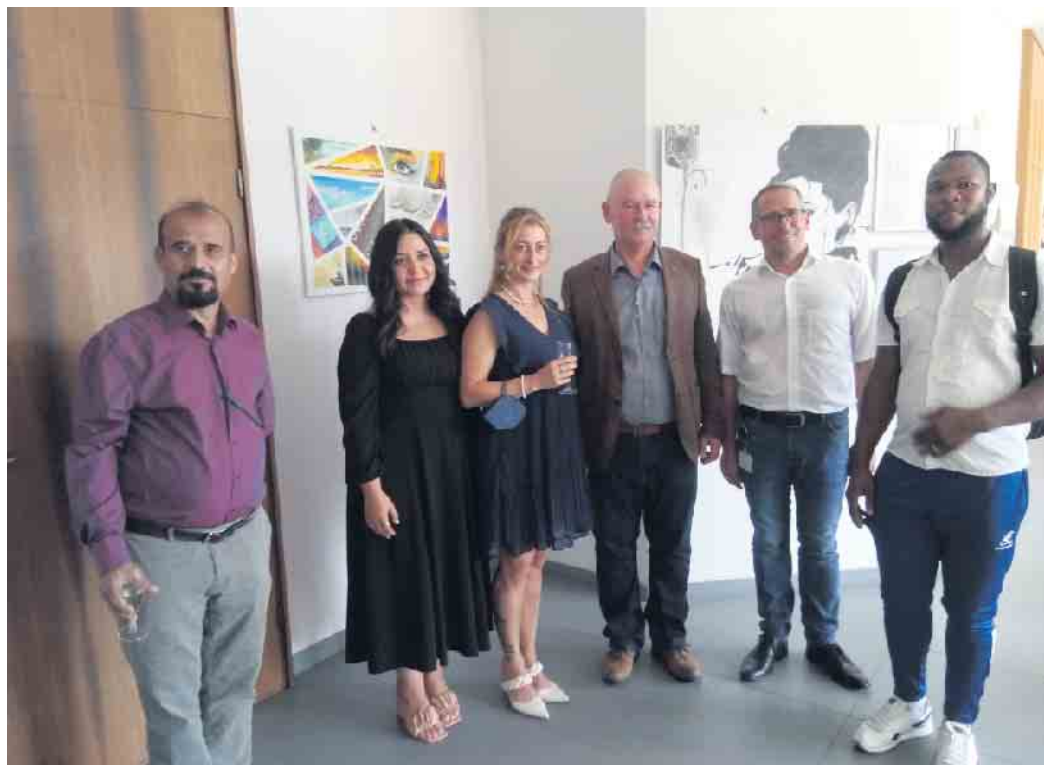
Künstler und Organisatoren der Ausstellung zusammen mit dem stv. Bürgermeister Detlef Gehle

bis zum 19. August zu den Öffnungszeiten des Rathauses besucht werden.