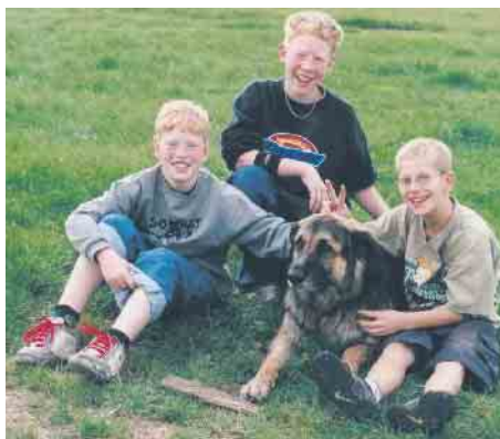
Auch Hunde dürfen kommen

Bei Kaffee und Kuchen, Würstchen und kühlen Getränken zum Selbst-