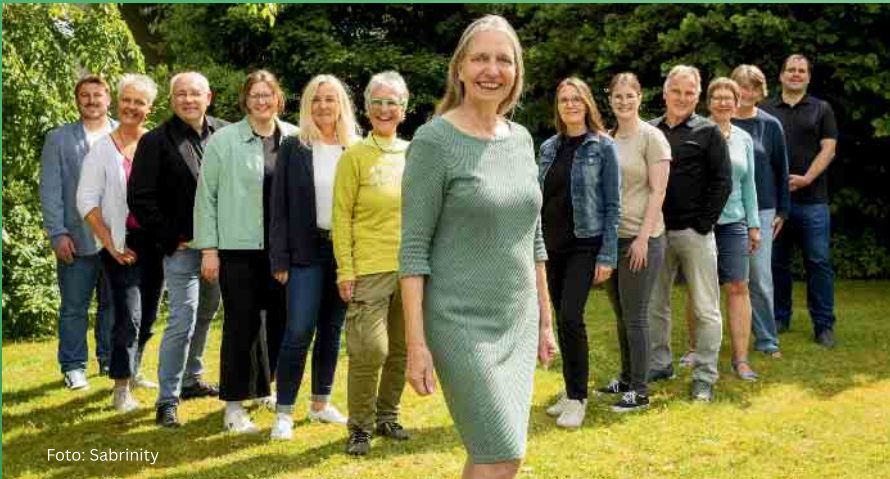
V.i.S.d.P.: BÜNDNIS 90/DIE GRÜNEN Kreisverband Höxter Ludger Roters, Westerbachstr. 34, 37671 Höxter