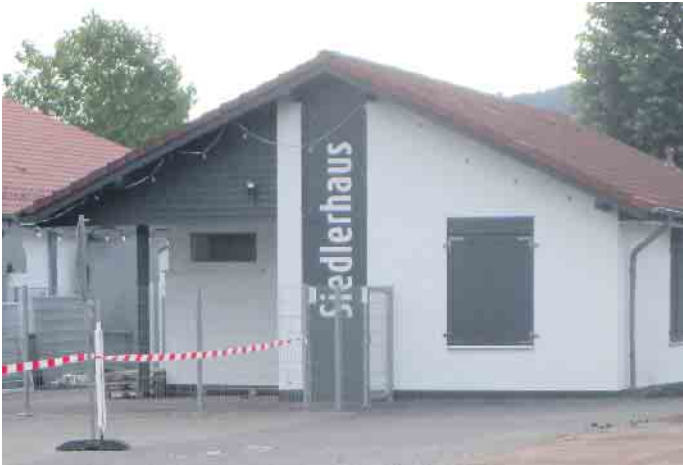
Das Siedlerhaus vorher

der umgebende Platz möchte sich von einer schöneren Seite zeigen. Wie heißt es so richtig: Viele Hände - schnelles Ende. Und nach getaner Arbeit haben sich alle Helfer eine ordentliche Stärkung und Erfrischung verdient. Also: Termin notieren. Wer um 13 Uhr noch keine Zeit hat, der oder die kann gerne auch später noch zum Helfen kommen. Und dann freuen wir uns auf die nächste Veranstaltung, das Sommerfest am Siedlerhaus unter dem Motto „75 Jahre Siedlerfeiern“. HK