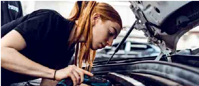
Karrieren in der Kfz-Branche stehen bei Berufseinsteigern beider Geschlechter hoch im Kurs.

Lange galt der Kfz-Bereich als Männerdomäne, doch das ändert sich: Immer mehr Frauen entscheiden sich für eine Ausbildung in der Branche. Der Anteil weiblicher Azubis wächst stetig, denn technisches Know-how und Begeisterung für Innovationen sind keine Frage des Geschlechts. Vielfalt wird im Kfz-Gewerbe groß-