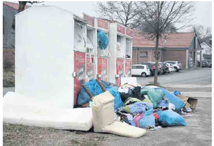
Die Altkleider-Container am Siedlerplatz in Bad Driburg.

Plätzen vor den Containern ist nicht erlaubt, dabei handelt es sich um illegales Müllabladen! Das kann mit Bußgeldern belangt werden, informiert das Ordnungsamt. Bitte arbeiten Sie mit daran, dass die Containerplätze in Bad Driburg sauber bleiben! Dieses gilt insbesondere für die besonders stark frequentierten Bereiche Am Siedlerplatz wie auch an der Allee-straße. Der Vertragspartner der Stadt Bad Driburg stellt aktuell 19 Container in der Kernstadt bzw. in den Ortschaften. Dazu besteht die Möglichkeit der Abgabe der Altkleider an mindestens 15 weiteren Altkleidercontainern im Stadtgebiet.