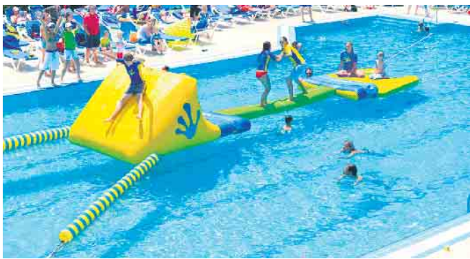
Es startet eine Poolparty am 16.8.

im Freizeitbad nach dem jeweils nächsten Termin fragen. Doch das Driburger Freibad hat noch mehr zu bieten: „Ein 50-Meter-Becken, eine absolute Seltenheit im näheren Umkreis, zudem auch ein Abenteuerbecken mit einer 40 Meter-Röhrenrutsche für die etwas älteren Kinder und Jugendlichen und einen separaten Sprungbereich. Besonders vielfältig ist das Becken für die ganz Kleinen - überdacht mit einem großen Sonnensegel“, berichtet Bademeister Lutz Egeling. Abkühlung an Hitze-Tagen im Abenteuerbecken Auf der weitläufigen Liegewiese gibt es mehrere Bäume, die großzügigen Schatten spenden. Daneben liegt das Beach-Volleyball-Feld, das gerne genutzt wird. Wer sich hier sportlich betätigt hat, kann danach im Abenteuerbecken Abkühlung bekommen. Neben der Röhrenrutsche gibt es hier noch einen Rutschenberg, eine Felsgrotte, einen Wasserfall, einen Whirlpool und einen Strömungskanal. Diese verschiedenen Elemente können die Bademeister individuell vom Turm aus oder auch vom Kassenhäuschen aus zuschalten. Das Eggefreibad in Neuenheerse ist ebenfalls sehr vielfältig aufge-