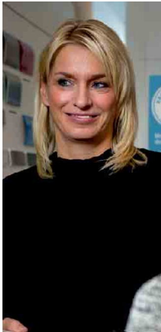
Die Kfz-Branche bietet viele Berufschancen - nicht nur in der Werkstatt, sondern auch in der Beratung und im kaufmännischen Bereich.