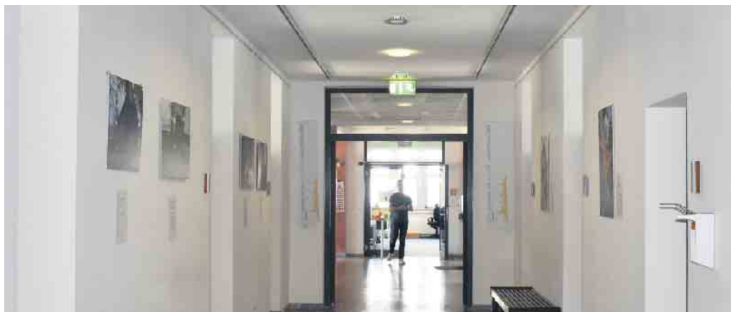
Die Fotos sind im Erdgeschoss des Rathauses ausgestellt.

Die eingereichten Motive sind vielfältig und zeigen neben bekannten Bad Driburger Sehenswürdigkeiten auch viele Geheimtipps wie das Backhaus in Reelsen, das Rommenhöller Ehrenmal bei Herste, die Kluskapelle an der Ösequelle und Privathäuser mit interessantem Baustil.