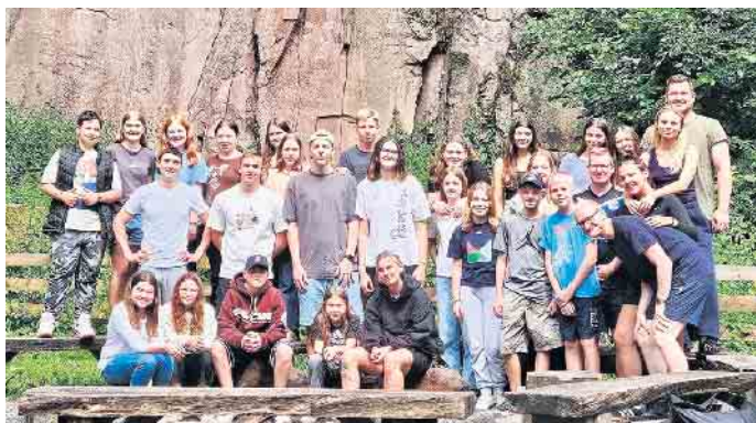
Die diesjährigen Gruppenkinder, Leiter und Betreuer (leider nicht ganz vollständig)

In manchen Hinterländern steht die Zeit noch stiller als in anderen Hinterländern.