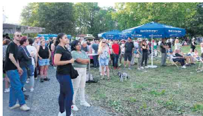
Viele Besucher kamen zum zweiten Freiluft-Konzert in den Eggelandpark.

Die Bad Driburger Touristik und der Werbering Bad Driburg luden zu den Konzerten ein. So waren auch