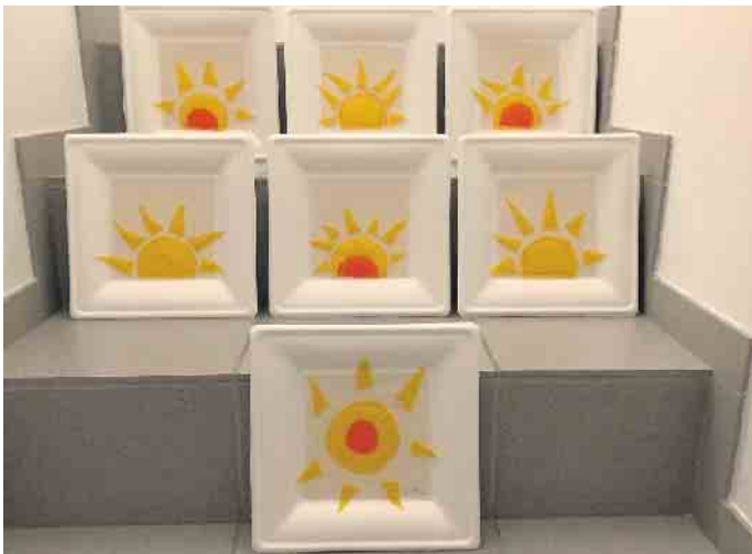
Diese hübschen Bilder haben die Schülerinnen und Schüler im Lernprofil „Abenteuer Nähmaschine“ kreiert.