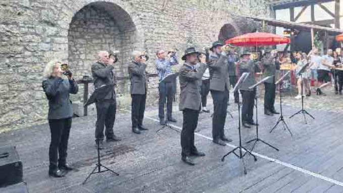
Das Jagdhornbläsercorps aus Bad Driburg gibt ein Stelldichein.

Dringenberg. Die, die in diesem Jahr dabei waren, haben sich den Termin bereits notiert. Alle, die das traditionelle Burgfest im Innenhof der Burg Dringenberg verpasst haben, werden es bestimmt im Kalender eintragen. Am Samstag, 19. Juli 2025, wird das 50-jährige Jubiläum des Burgfests in Dringenberg gefeiert, zu dem der Förderverein für Musik und Kultur in Dringenberg schon jetzt einlädt. Dann wird sich zeigen, ob man das Fest überhaupt noch top-