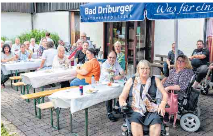
Die neue barrierefreie Bushaltestelle „Ev. Kirche“ am Gemeindehaus in der Brunnenstraße

Auch die neue barrierefreie Bushaltestelle direkt vor der Evangelischen Kirche wurde genutzt. Das Gemeindehaus, wo sich die gemeinnützige Selbsthilfegruppe jeden 1. und 3. Freitag um 18 Uhr trifft, ist stufenlos erreichbar. Eine Rollstuhltoilette vorhanden. Insgesamt sei es ein wirklich kurzweiliger gelungener Abend gewesen, so die Gruppe. Viele Gäste konnten begrüßt werden und drei neue Mitglieder haben ihre Mitgliedschaft vor Ort beantragt. Besuchen Sie uns doch einfach mal und lernen Sie uns kennen. Mehr Informationen unter www.probarrierefrei.de oder telefonisch unter 01511 24 83 764.