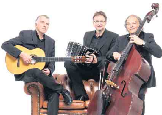
Das „Trio Tipico Westfalica“ spielt am „Argentinischen Abend“ im Steakhaus La Estancia in Bad Driburg