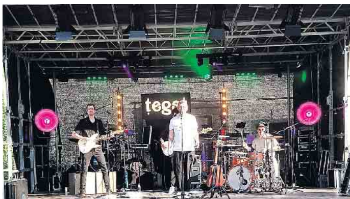
Die Band „teget“ aus Hildesheim trat bei „Live in Bad Driburg“ im Eggelandpark auf.

Am Donnerstag, 18. Juli, hieß es zum zweiten Mal „Live in Bad Driburg“. Das traumhafte Sommerwetter lockte viele Gäste auf das Gelände des Eggeland-Parks. Für super Stimmung sorgten die Band „teget“ aus Hildesheim und die Partyband „Unglaublich“ aus dem Kreis Höxter. Bei kühlen Getränken und