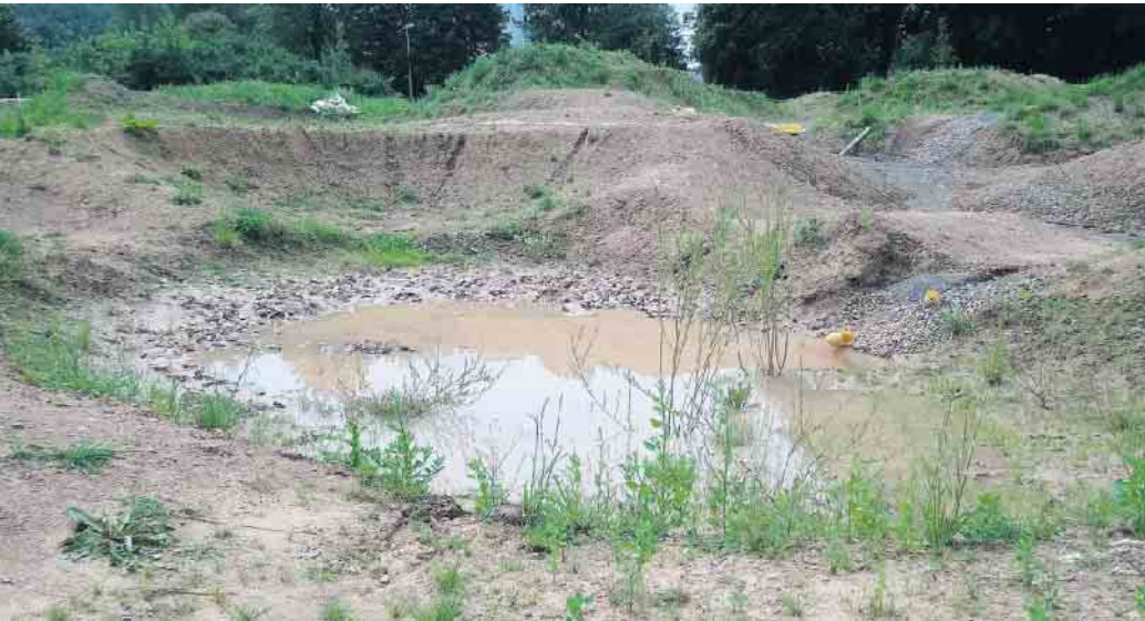
Die Dirtbikestrecke in der Bad Driburger Südstadt sollte schon im September 2023 eingeweiht werden. Die Arbeiten verzögern sich.

Täglich gehen viele große und kleine Bad Driburger an der unvollendeten Anlage der Dirtbikestrecke in der Südstadt vorbei. Sie liegt verwaist und wartet auf die Fertigstellung. Das Flatterband zur Abspernung ist längst zerrissen. Ein paar Mutige wagten es dennoch vom oberen Hügel hinabzusausen. Zur Freude vieler ist jedoch die fertige Pumptrackstrecke uneingeschränkt