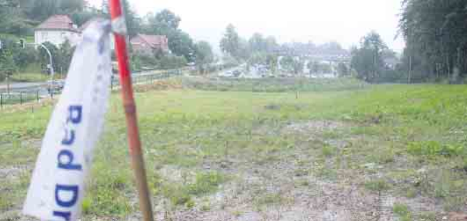
Die Gräfliche Unternehmensgruppe will im Bereich der Marcusklinik den Parkplatz weiter vergrößern.

Kreis, Stadt und das Gräfliche Haus freuen sich über die Fertigstellung der Brunnenstraße in Bad Driburg