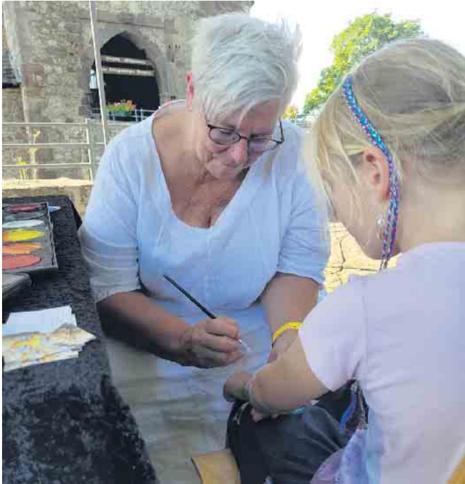
Mit Hüpfburg und Kinderschminken wurde auch an die jüngsten Besucher gedacht.