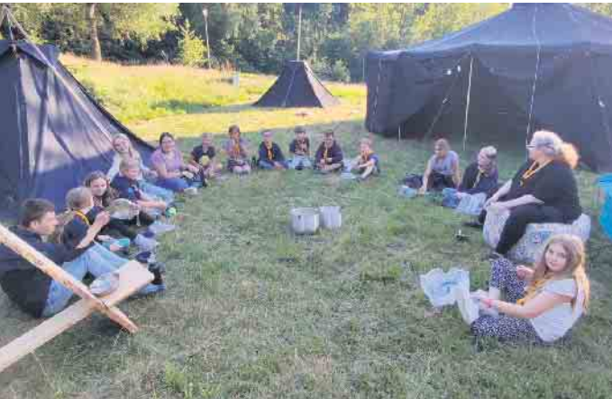
Essen am Abend

BdP Stamm Waldmeister verbringen eine Woche am Stausee