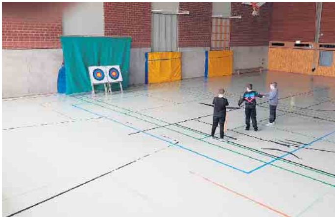
Gefragt sind Konzentration und Fingerspitzengefühl: Das Lernprofil Bogenschießen.

terricht gekoppelt. Ergänzend dazu finden sowohl Probenwochenenden als auch Orchesterfahrten statt, wie in diesem Jahr kürzlich nach Kroatien oder jedes Jahr nach Helgoland in den Osterferien. Der monatliche Elternbeitrag in Höhe von 10 Euro um-