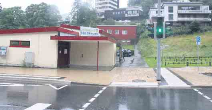
Am Freibad wurde eine neue LED-Fußgängerampel aufgestellt.

außerorts in Richtung Alhausen noch mal 2.000 Quadratmeter entsiegelt werden. Ein ökologischer Grünstreifen trennt Fußgängerweg und Fahrbahn. „Die Neugestaltung der Brunnenstraße ist eine der größten Investitionen in das Kreisstraßennetz in den vergangenen Jahren“, betonte der Landrat. Der Kreis Höxter ist Maßnahmen-träger der Straßensanierung. In Summe belaufen sich die Kosten für den Kreis Höxter voraussichtlich auf 2,9 Millionen Euro. Das Land Nordrhein-Westfalen beteiligte sich über das Förderprogramm zum kommunalen Straßenbau mit 1,1 Millionen Euro sowie mit rund 68.000 Euro über das Sonderprogramm Stadt und Land an der Maßnahme. Mit 1,22 Millionen Euro beteiligte sich außerdem der Bund aus dem Förderprogramm Nahmobilität. Somit beläuft sich der Eigenanteil des Kreises Höxter auf etwa 510.000 Euro. Aber auch die Stadt Bad Driburg und die Gräfliche Unternehmensgruppe haben sich an