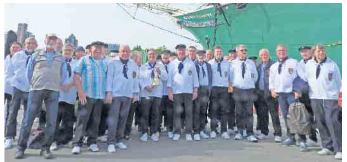
Magellan Shanty-Chor Paderborn zu Gast beim „Captains Dinner“ in der Driburg Therme

Bandoneon, Gitarre und Kontrabass widmen sich die drei Musiker in kam- mermusikalischer Besetzung ganz dem argentinischen Tango und Tän- zer bringen die lateinamerikanische Leidenschaft auf die Tanzfläche. Die Gäste können sich auf Musik freuen, die sanft bis scharf, manchmal auch schwermütig und mysteriös, immer aber authentisch anmutet und ein Stück argentinisches Lebensgefühl vermittelt. Tickets für den „Argen- tinischen Abend“ in originellem Am- biente inklusive Essen und mitrei- ßender Livemusik gibt es für 69 Euro pro Person. Die Bad Driburger Som- mernächte gehen von 18 bis 21.30 Uhr. Die limitierten Karten sind ab sofort in der Tourist Information in Bad Driburg, Lange Straße 87 oder online unter www.bad-driburg.com erhältlich.