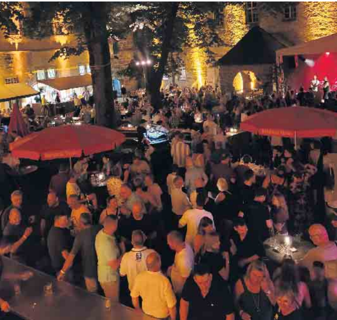
Der atmosphärisch beleuchtete Burginnenhof ist am Abend rappellvoll.

pen kann. In diesem Jahr war die 49. Auflage ein riesen Erfolg. Wenn das Wetter beim Jubiläumsfest im nächsten Jahr genauso gut mitspielt wie in diesem Jahr, ist der Erfolg garantiert. Der Förderverein für Musik und Kultur in Dringenberg wird getragen von den drei musiktreibenden Dringenberger Vereinen Burgmusikanten, Spielmannszug und Fanfarenzug, die alle ihren Sitz in den Räumlichkeiten der Burg haben. Einmal im Jahr verwandeln die